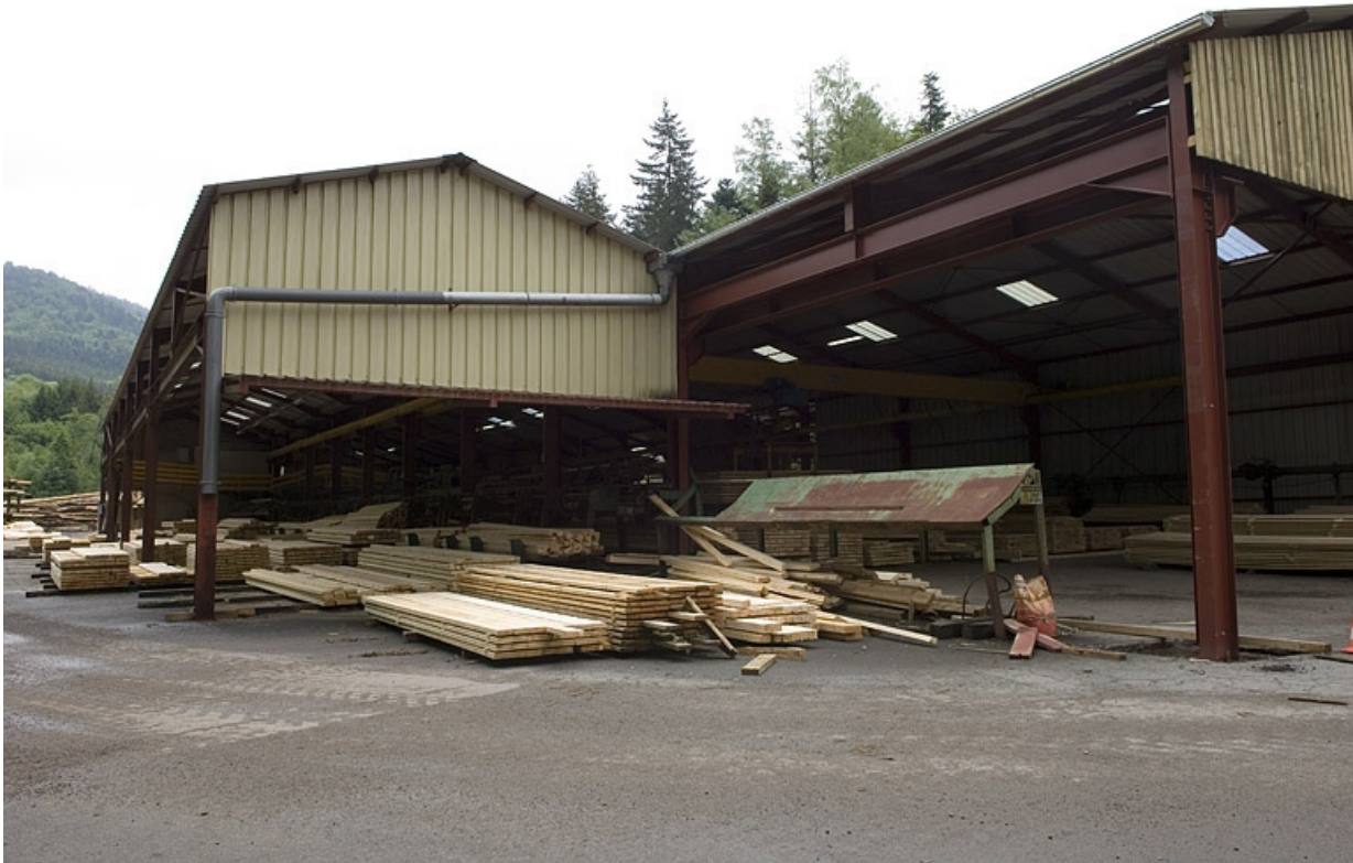
Atelier de fabrication de la nouvelle scierie.