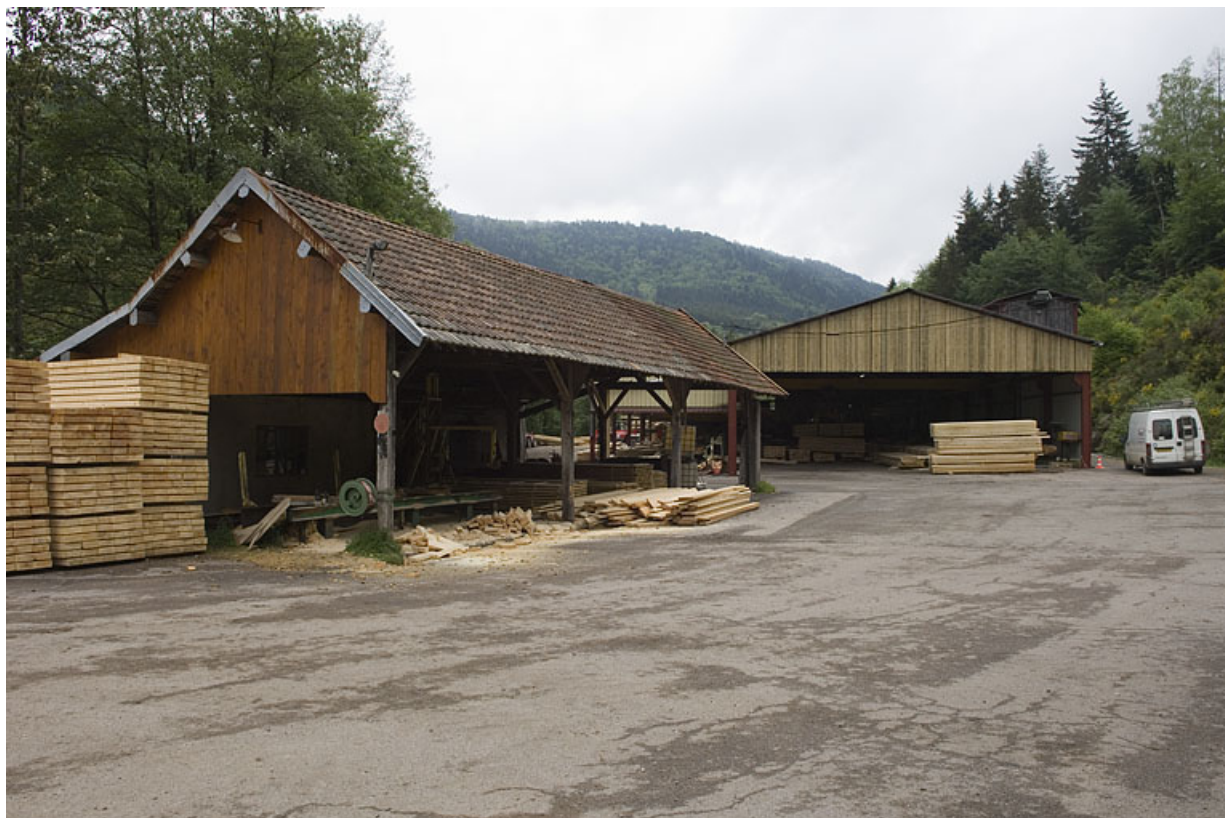
Vue depuis le sud de la nouvelle scierie.