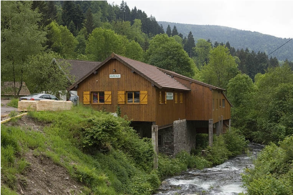
Bâtiment (réhabilité) de la scierie primitive.