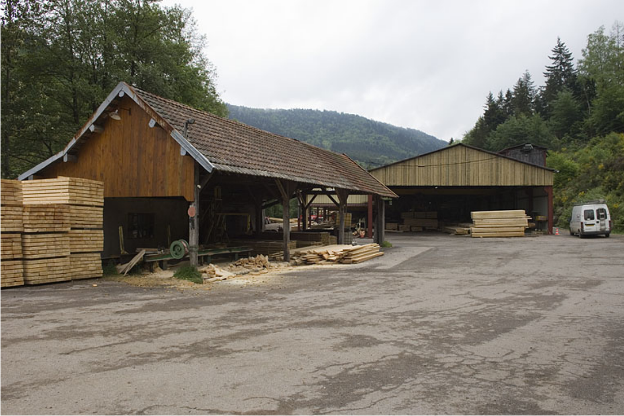
Vue depuis le sud de la nouvelle scierie.