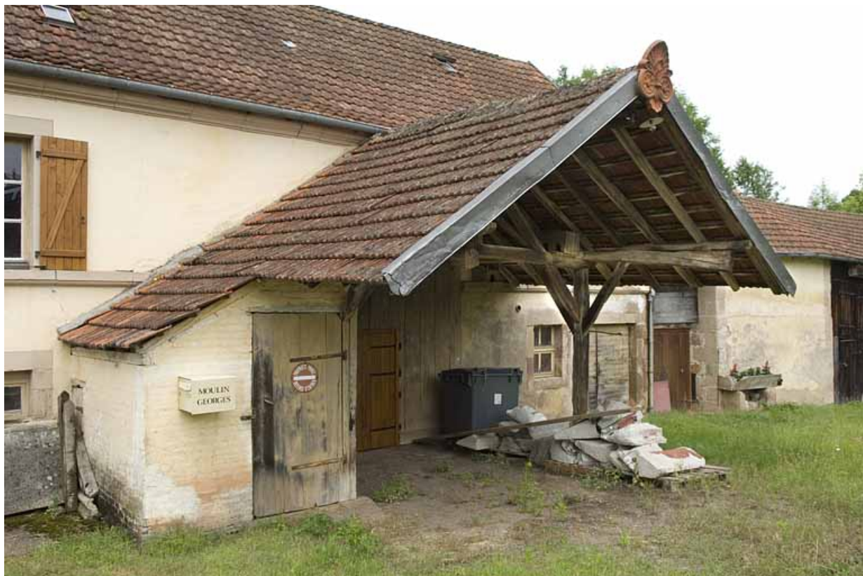
Auvent sur la façade antérieure.