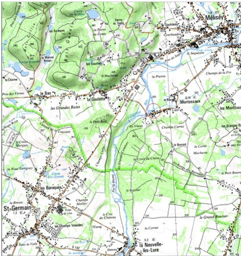
Carte de localisation. Carte topographique au 1:25000, I.G.N., Mélisey, 3520 O. SCAN 25, Licence n°2008CISE29-68. 70, Montessaux rue de la Maisonnée