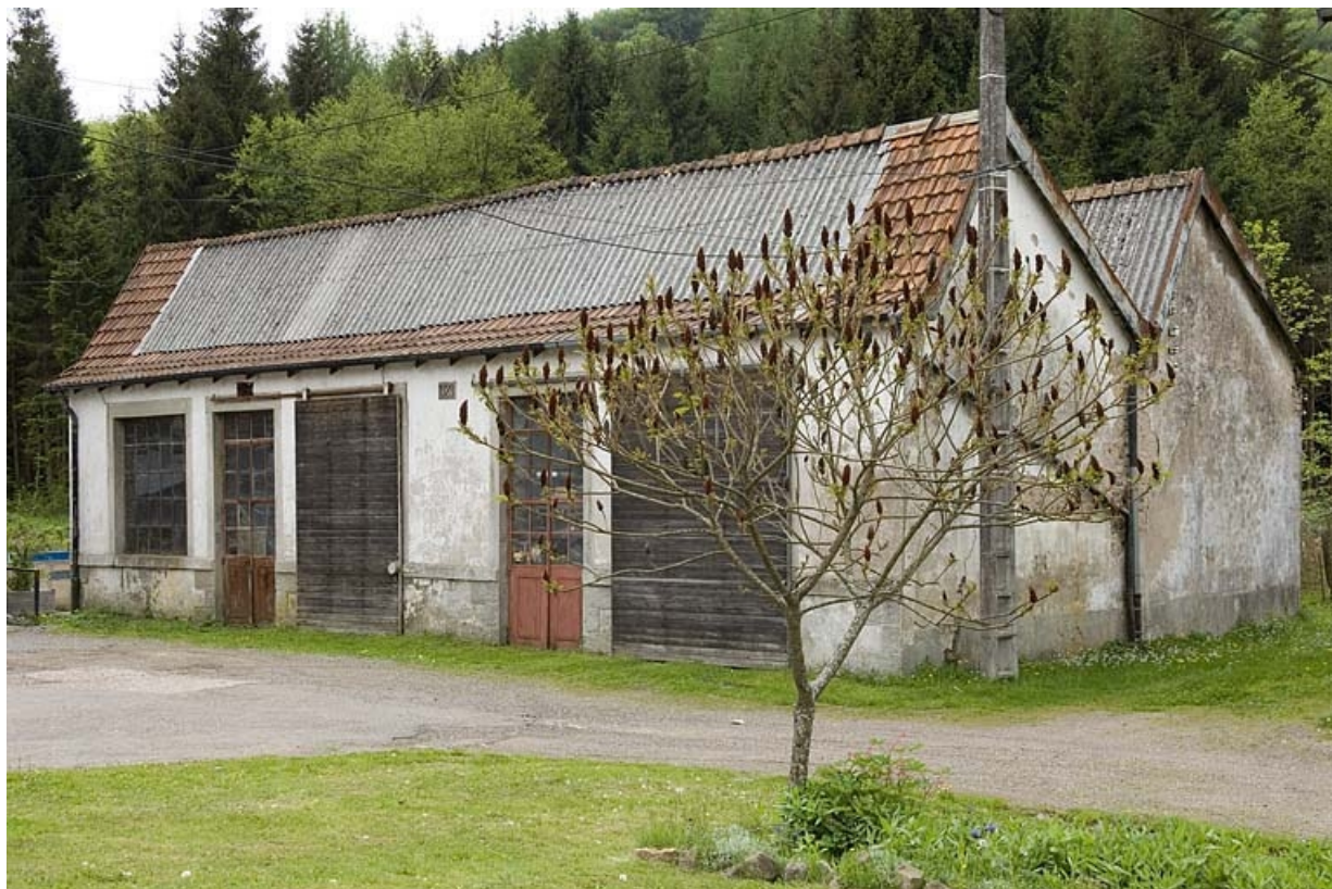
Atelier de réparation (menuiserie, forge).