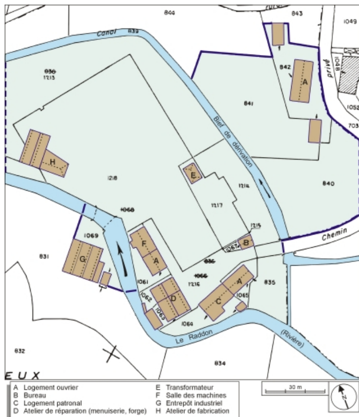
Plan-masse et de situation. Extrait du plan cadastral numérisé, 2005, section H, 1:1000. 70, Fresse, lieudit : le Volvet