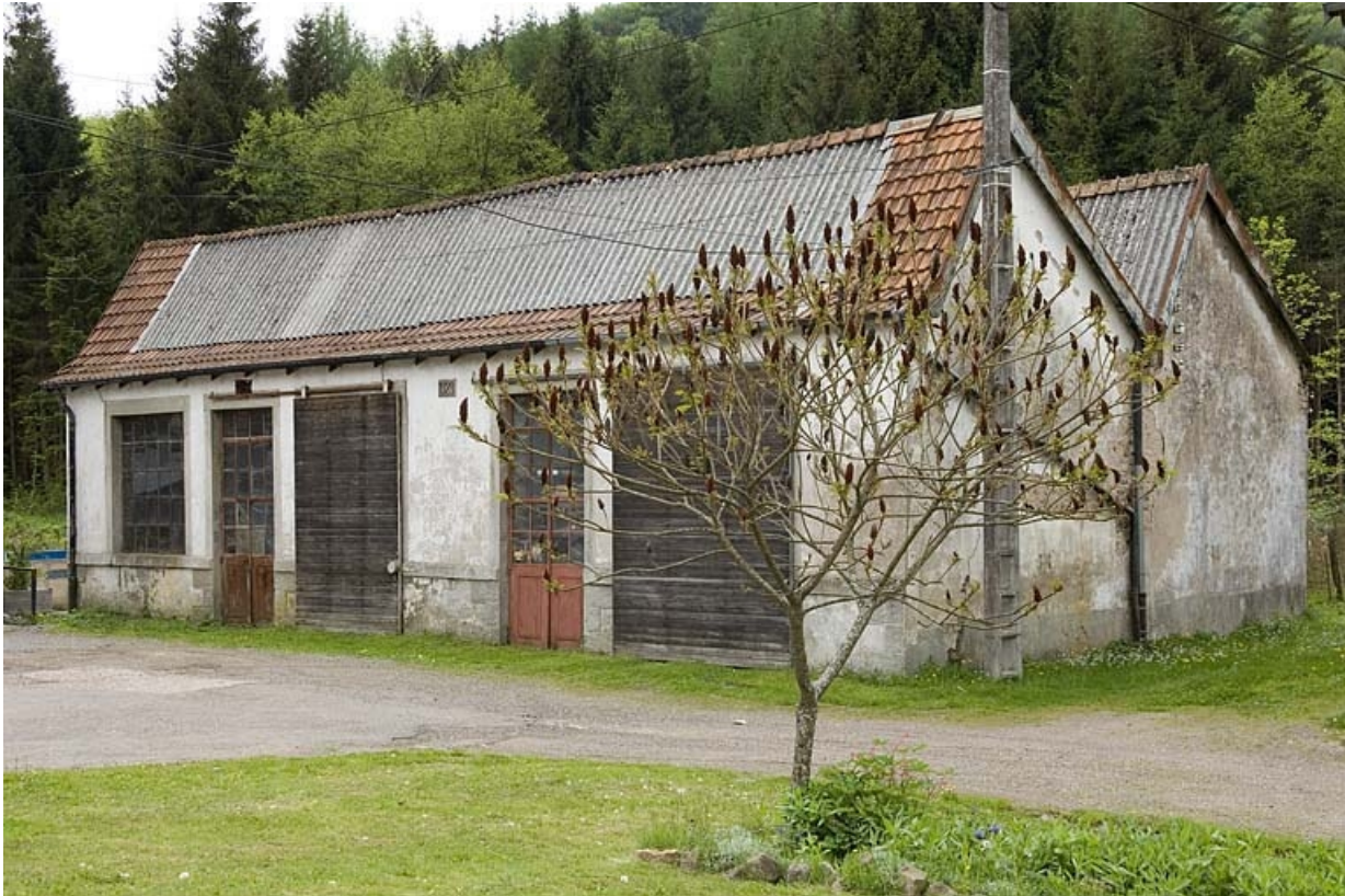
Atelier de réparation (menuiserie, forge).