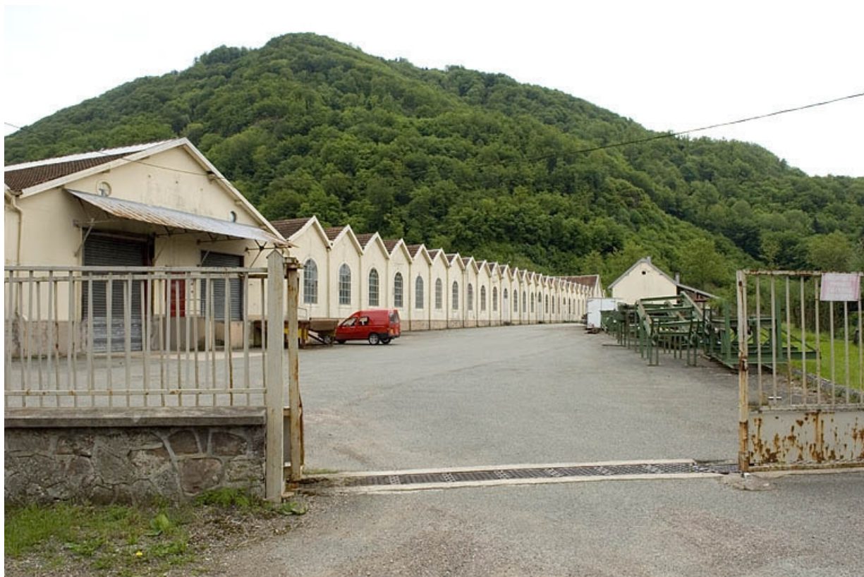
Pignons de l'atelier de fabrication depuis l'entrée.