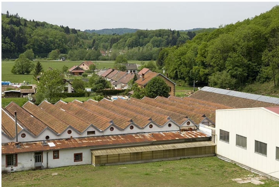
Vue plongeante depuis l'est. Extrémité nord. 70, Belonchamp, lieudit : le Raddon