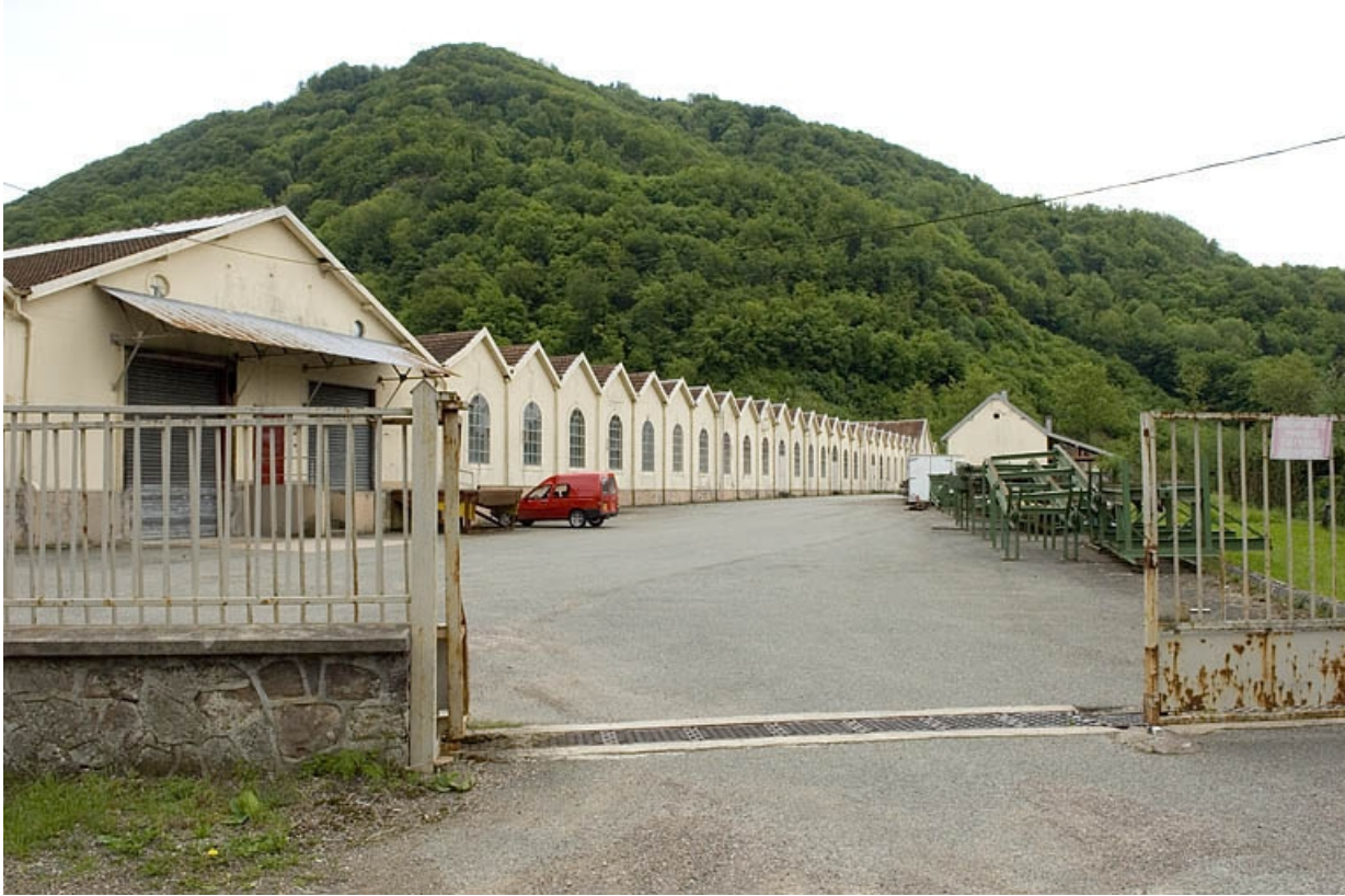
Pignons de l'atelier de fabrication depuis l'entrée.