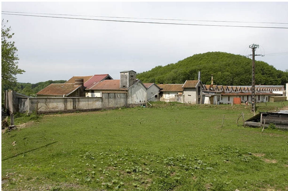
Vue d'ensemble depuis le sud-est.