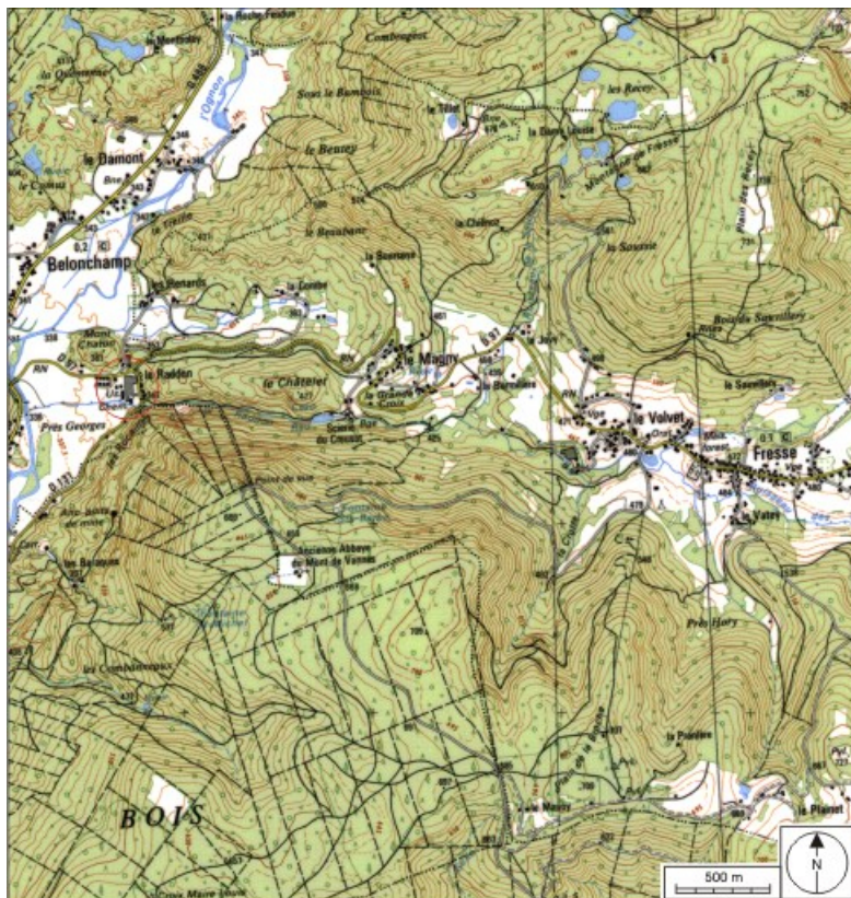
Carte de localisation. Carte topographique au 1:25000, I.G.N., Mélisey, 3520 O. SCAN 25, Licence n°2008CISE29-68. 70, Belonchamp, lieudit : le Raddon