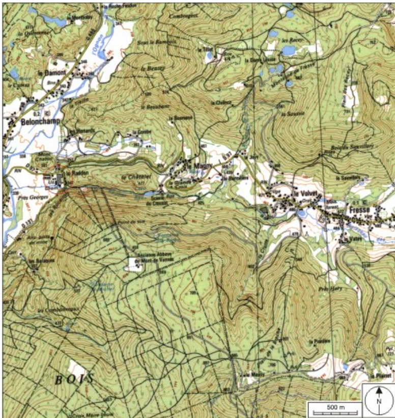
Carte de localisation. Carte topographique au 1:25000, I.G.N., Mélisey, 3520 O. SCAN 25 70, Belonchamp, lieudit : le Raddon