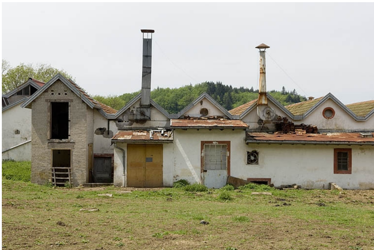
Pignons est de l'atelier de fabrication.