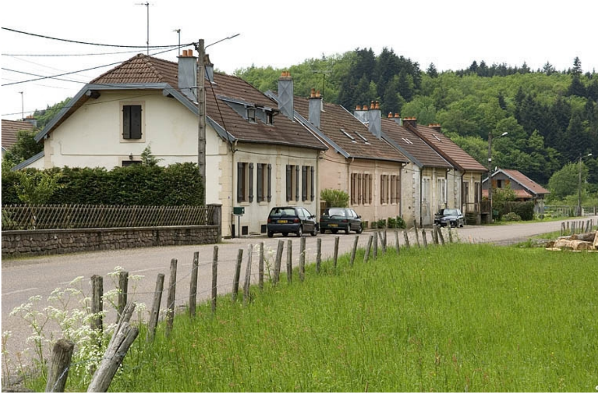
Vue d'ensemble de la cité ouvrière.