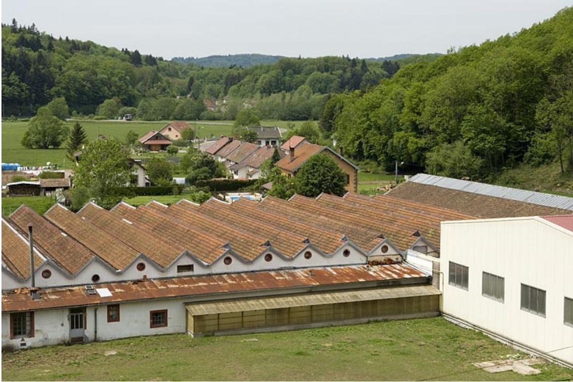
Vue plongeante depuis l'est. Extrémité nord. 70, Belonchamp, lieudit : le Raddon