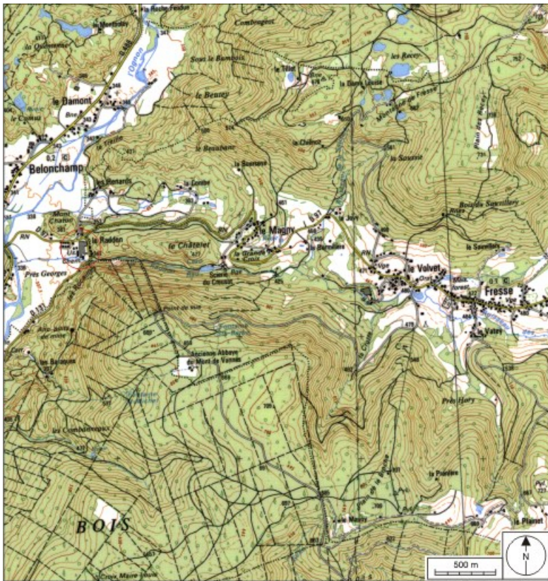
Carte de localisation. Carte topographique au 1:25000, I.G.N., Mélisey, 3520 O. 70, Belonchamp, lieudit : le Raddon