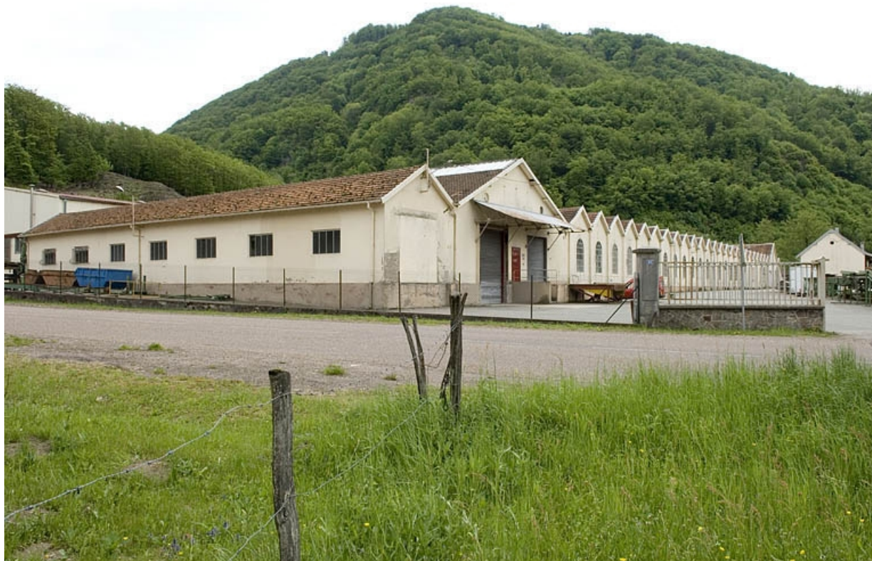
Vue de trois quarts de l'atelier de fabrication.