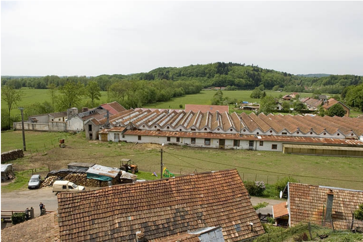
Vue plongeante depuis l'est.