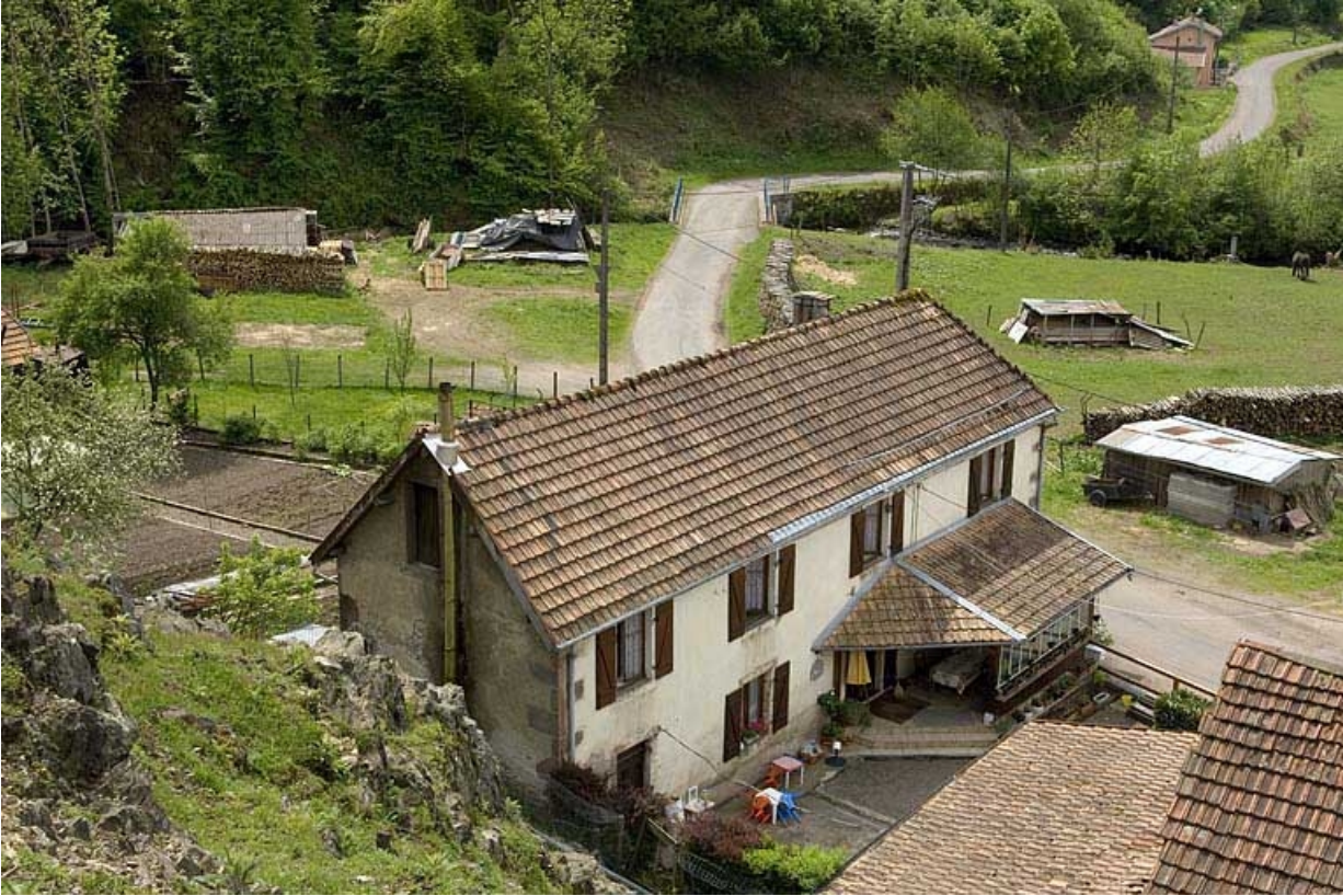
Vue plongeante sur un logement ouvrier.