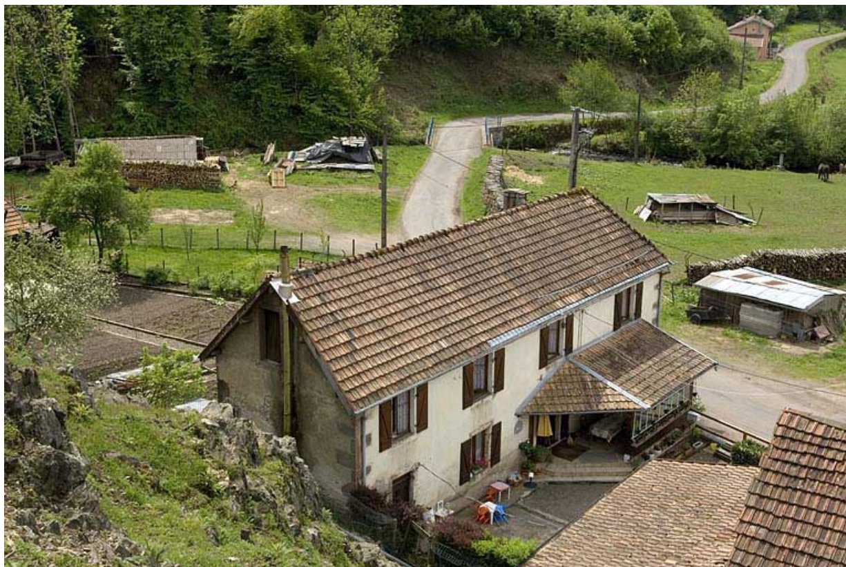
Vue plongeante sur un logement ouvrier.