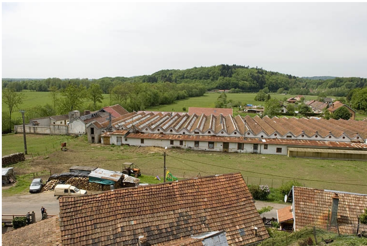
Vue plongeante depuis l'est.