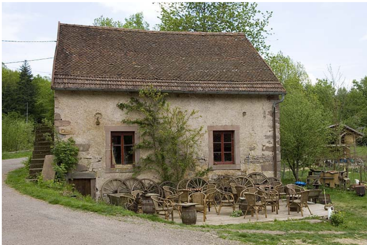
La façade ouest du moulin à farine.

70, Mélisey, lieudit : les Granges Baverey