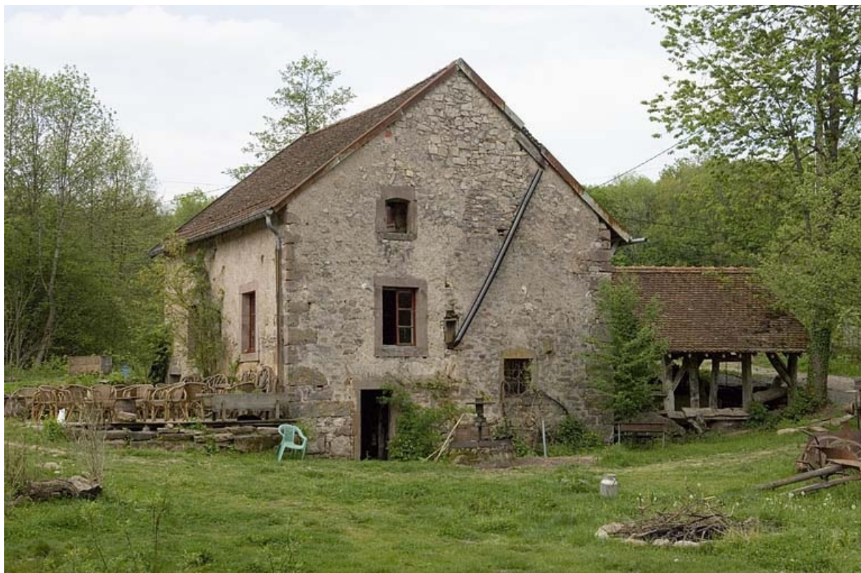
Le moulin vu de trois quarts arrière.

70, Mélisey, lieudit : les Granges Baverey