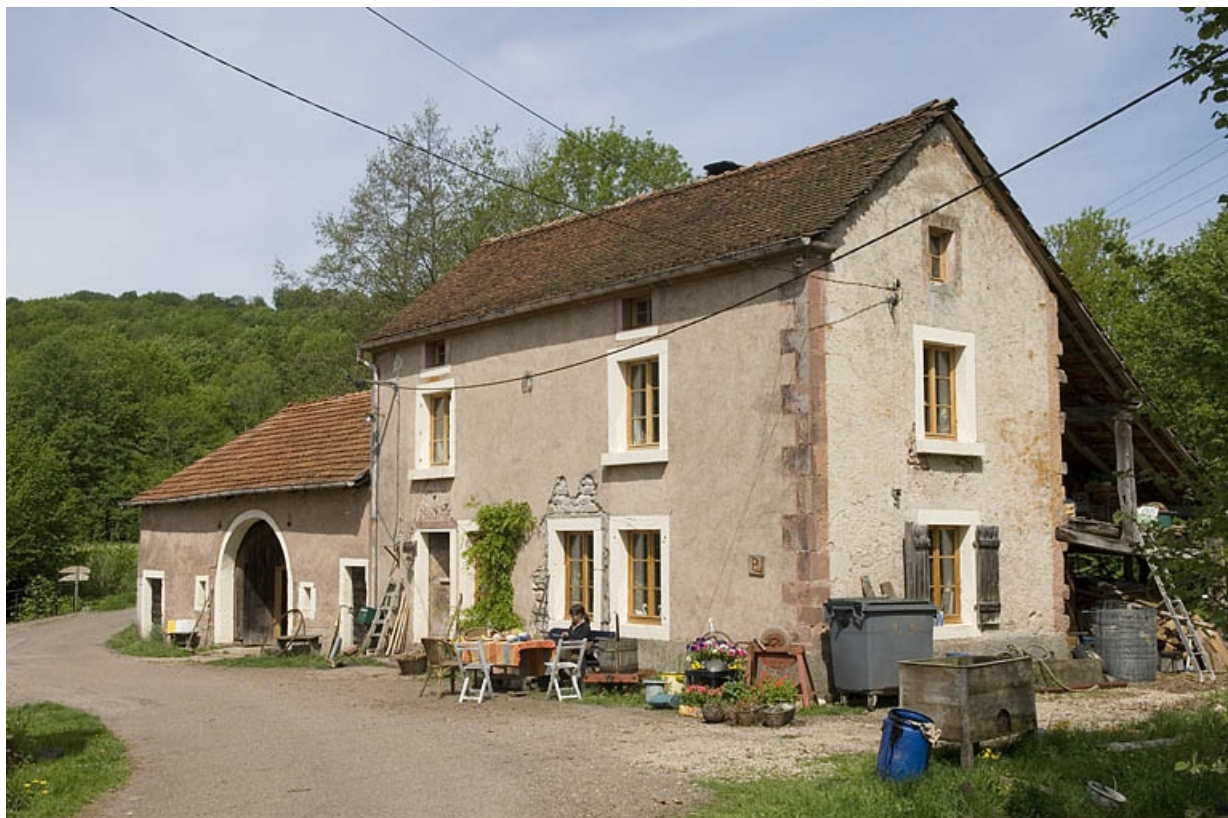
Les parties agricoles et le logement vus de trois quarts.

70, Mélisey, lieudit : les Granges Baverey