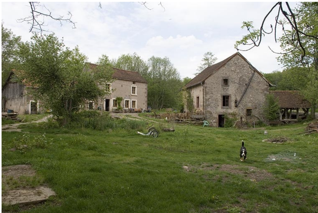
Vue d'ensemble depuis le sud-ouest.

70, Mélisey, lieudit : les Granges Baverey