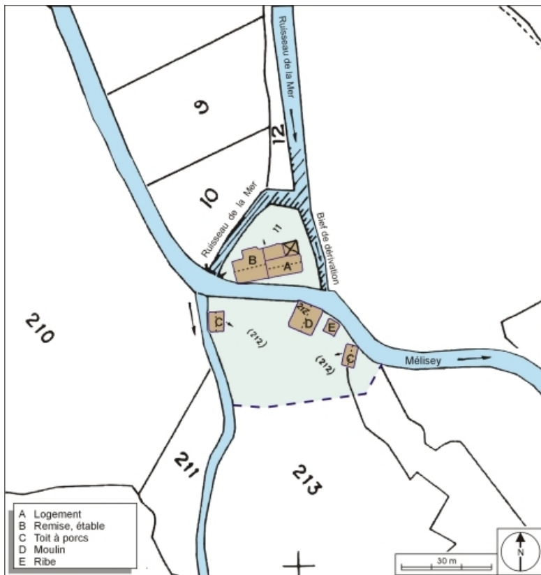
Plan-masse et de situation. Assemblages d'extraits de plans cadastraux numérisés, 2005, sections A et D, 1:2000 agrandi à 1:1000. 70, Mélisey, lieudit : les Granges Baverey