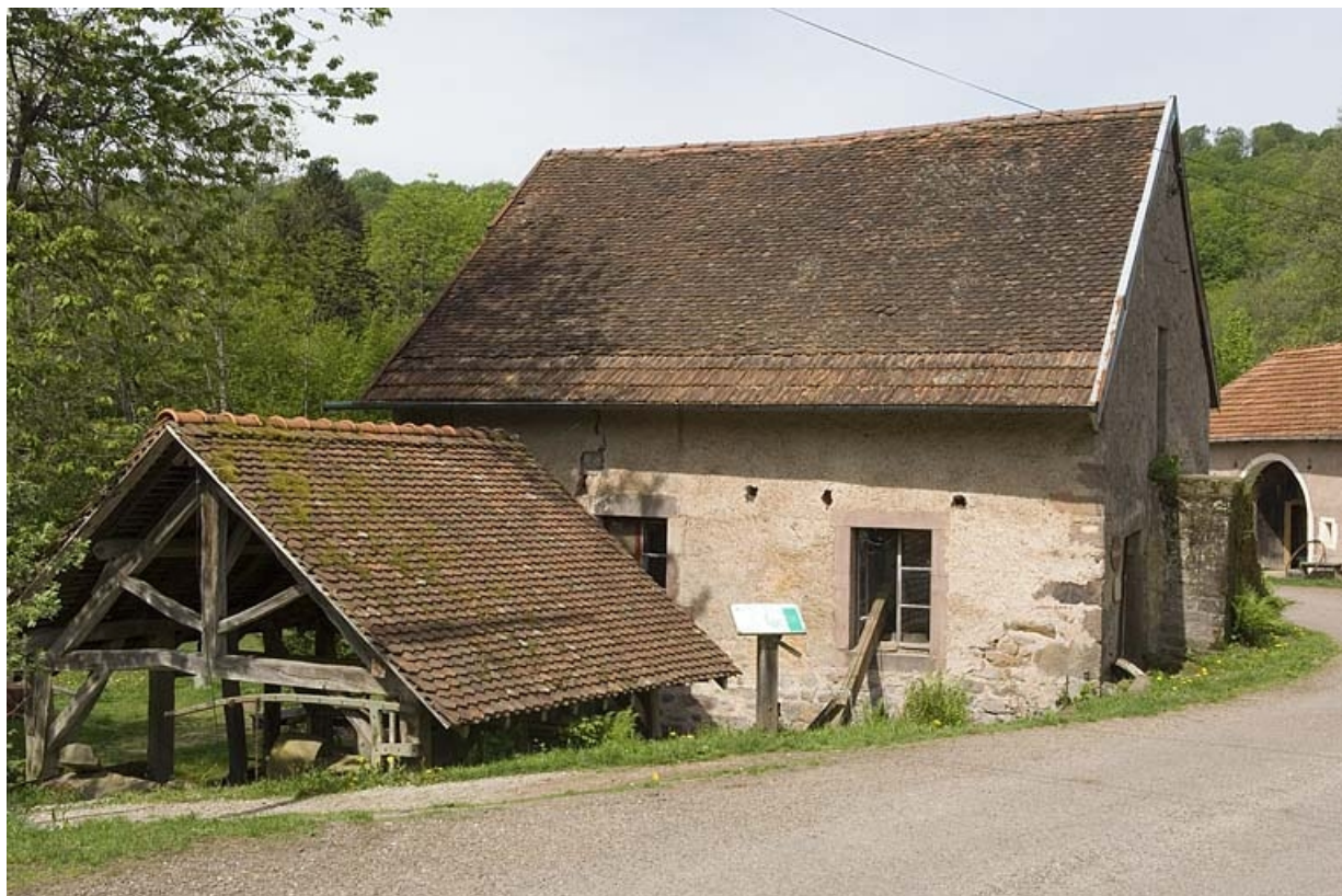
Le moulin à huile et le moulin à farine vus depuis l'est.

70, Mélisey, lieudit : les Granges Baverey