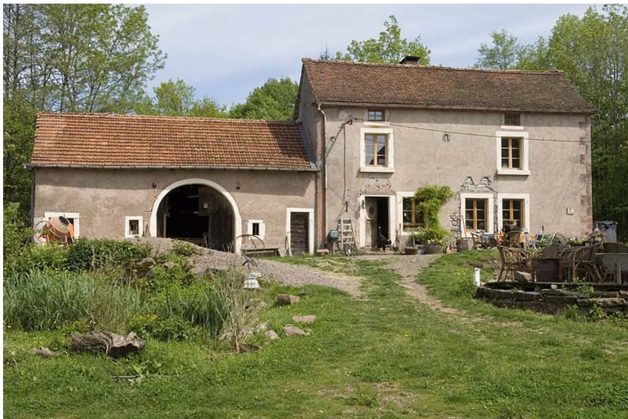
Façade antérieure des parties agricoles et du logement.

70, Mélisey, lieudit : les Granges Baverey