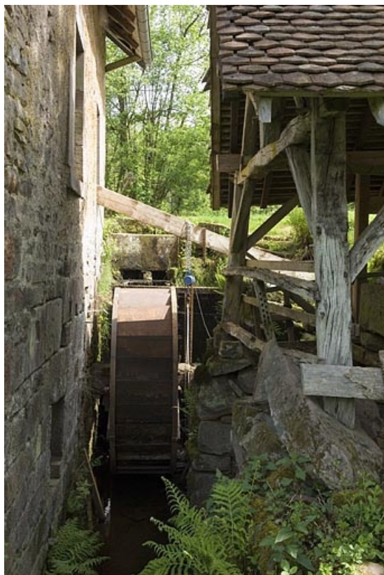
La roue hydraulique en dessus (en cours de réparation).

70, Mélisey, lieudit : les Granges Baverey