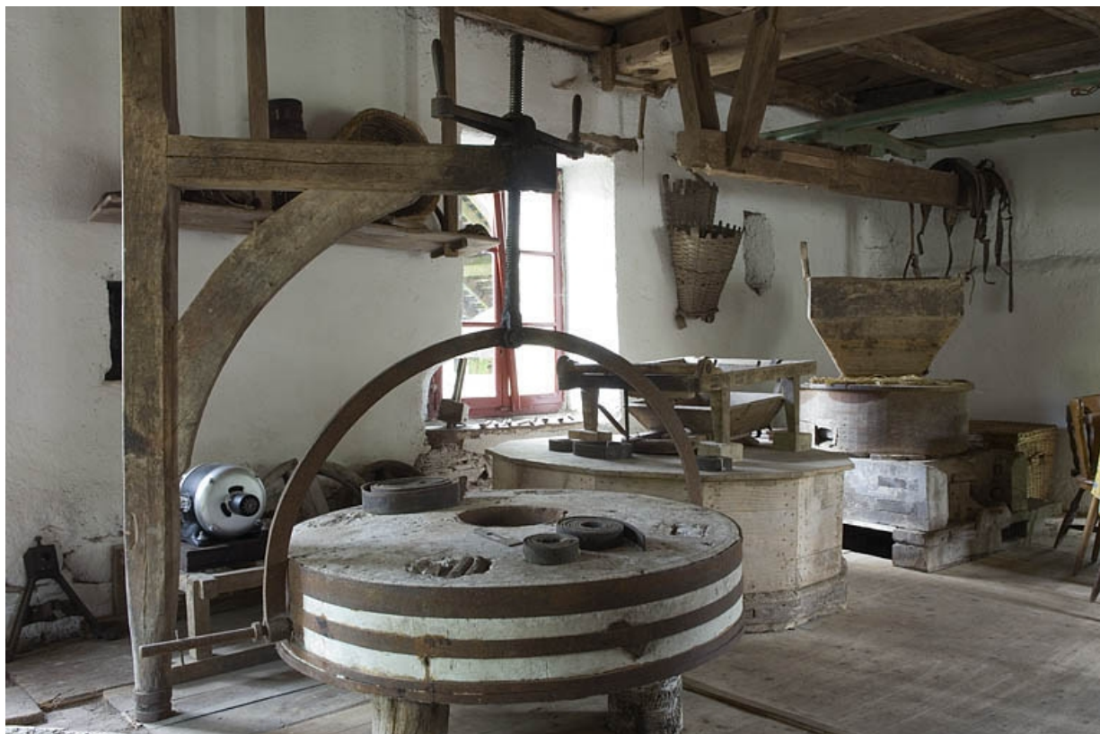
La chambre des meules du moulin à farine. 70, Mélisey, lieudit : les Granges Baverey