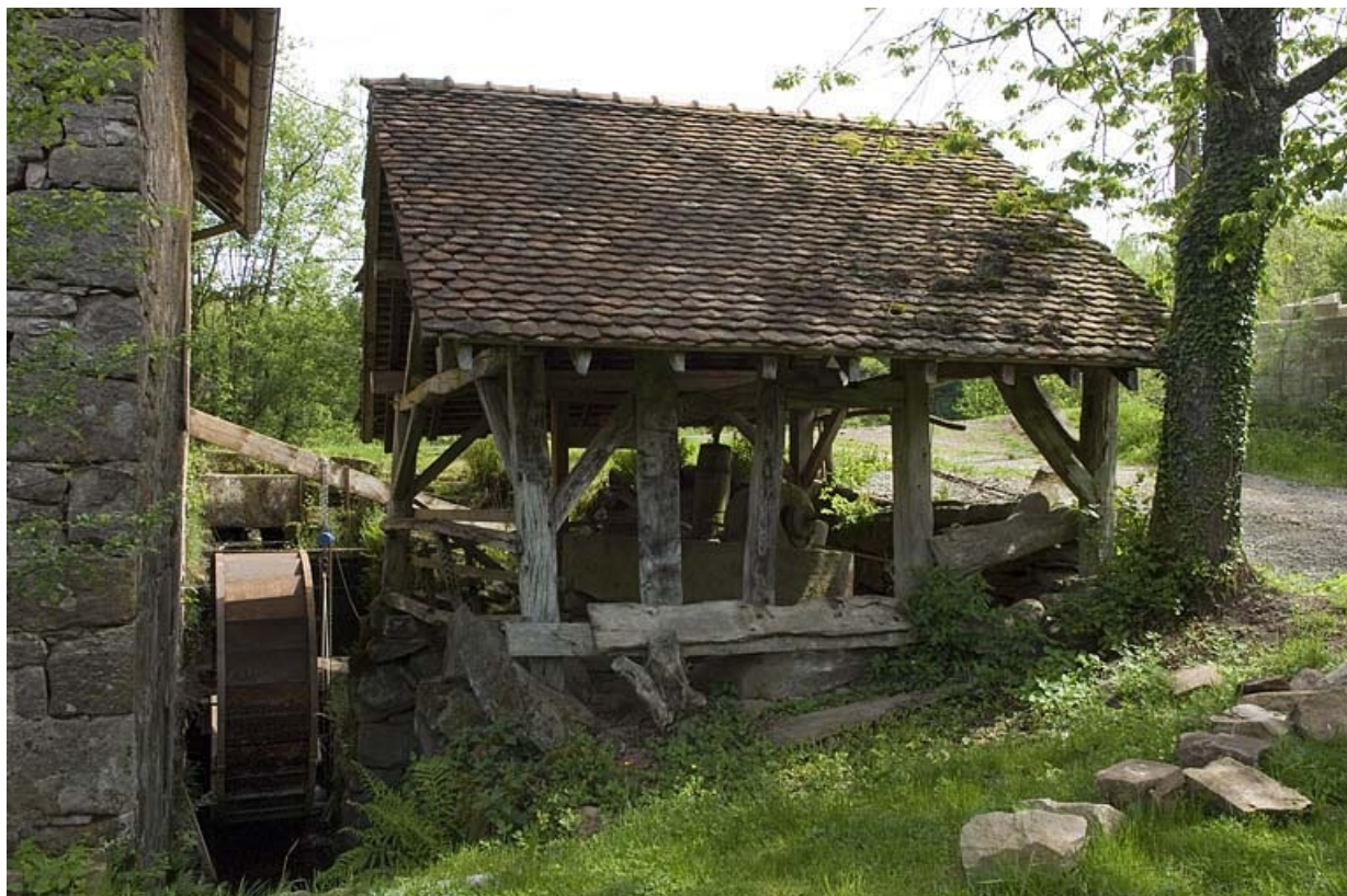
La roue hydraulique et la ribe vues depuis le sud.

70, Mélisey, lieudit : les Granges Baverey