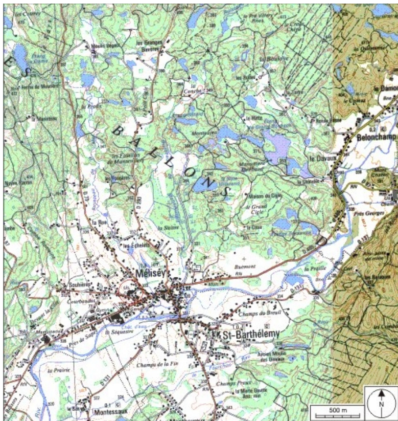
Carte de localisation. Carte topographique au 1:25000, I.G.N., Mélisey, 3520 O. Licence n°2008CISE29-68. 70, Mélisey, 2, 4 place de la Gare