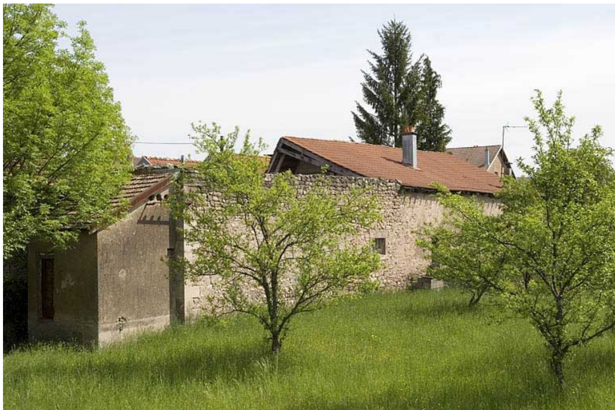
Transformateur et façade sud de l'atelier de fabrication.