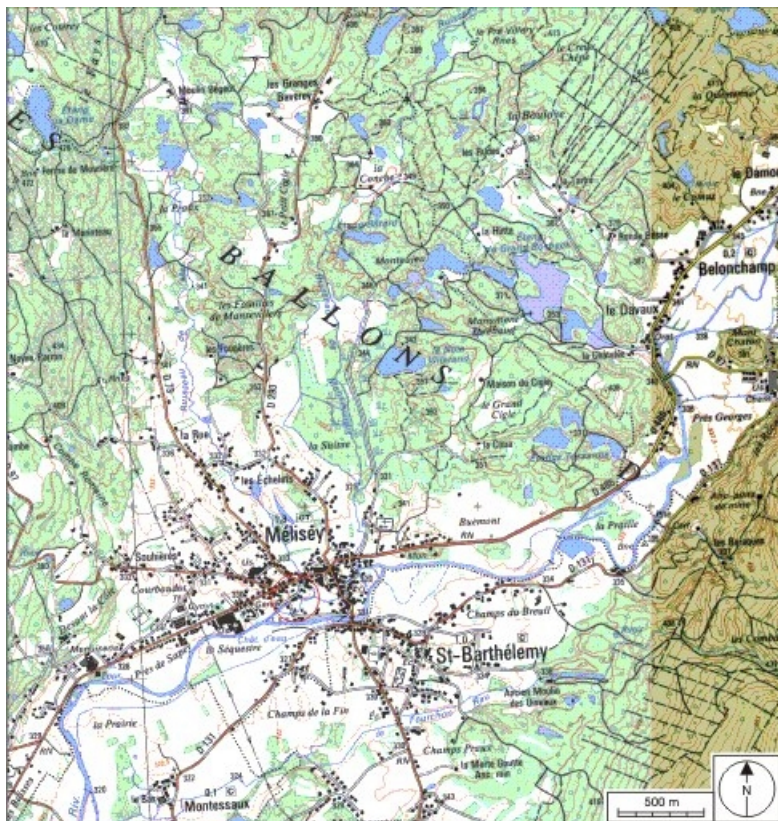
Carte de localisation. Carte topographique au 1:25000, I.G.N., Mélisey, 3520 O. Licence n°2008CISE29-68. 70, Mélisey, 5 rue de l' Abattoir