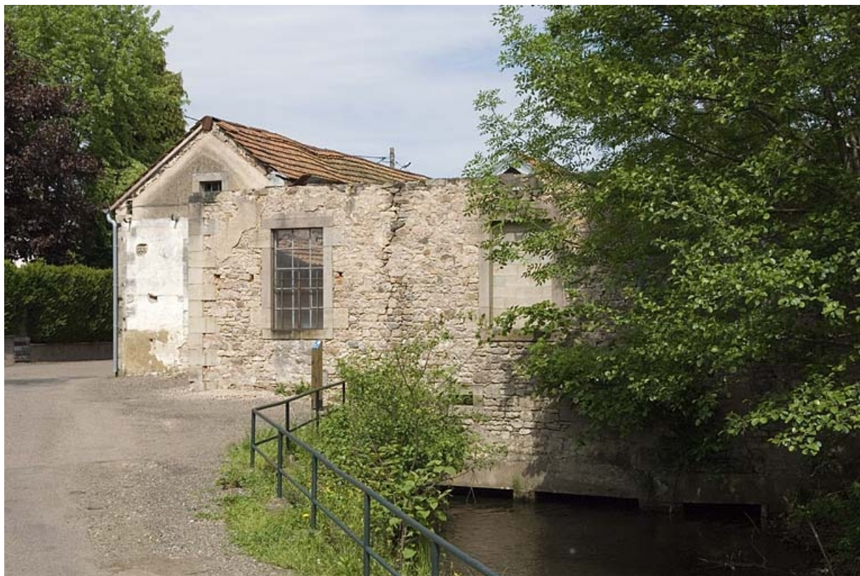
Pignons ouest de l'atelier de fabrication et canal de fuite.