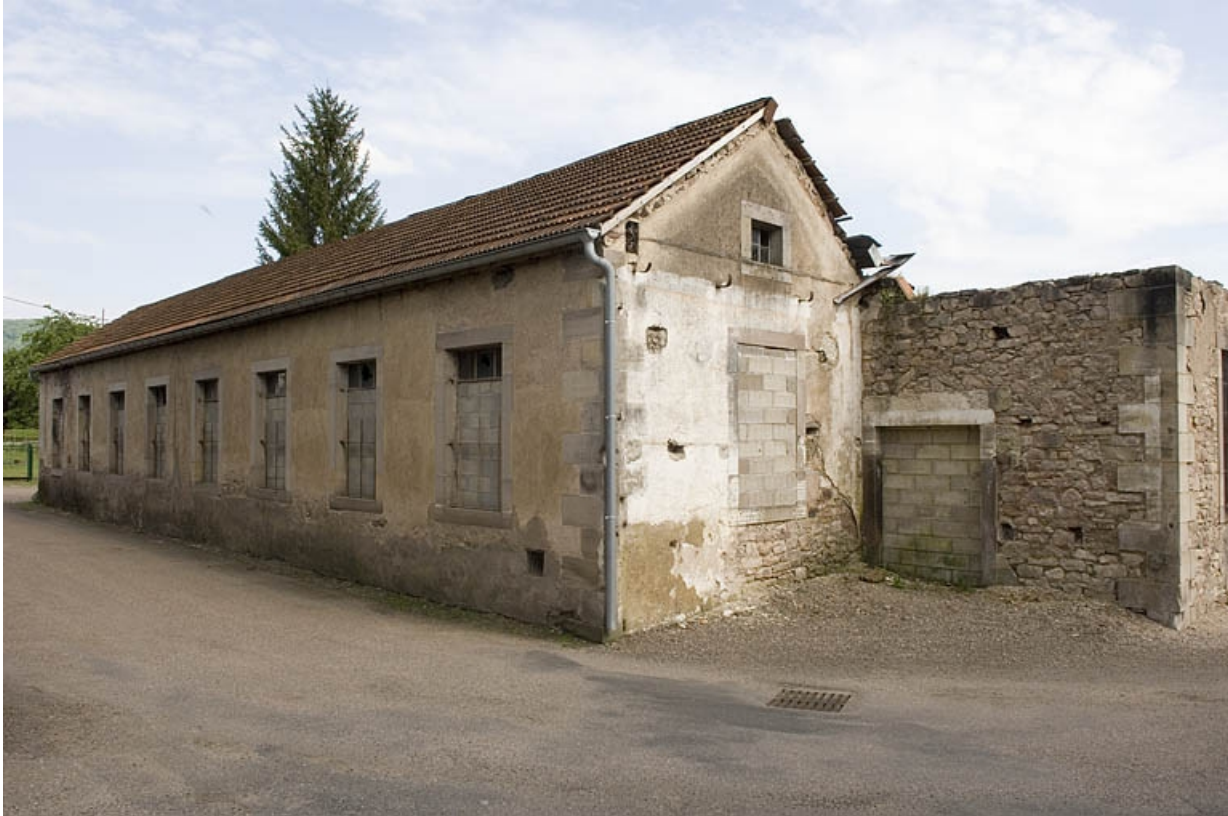
Façade nord de l'atelier de fabrication.