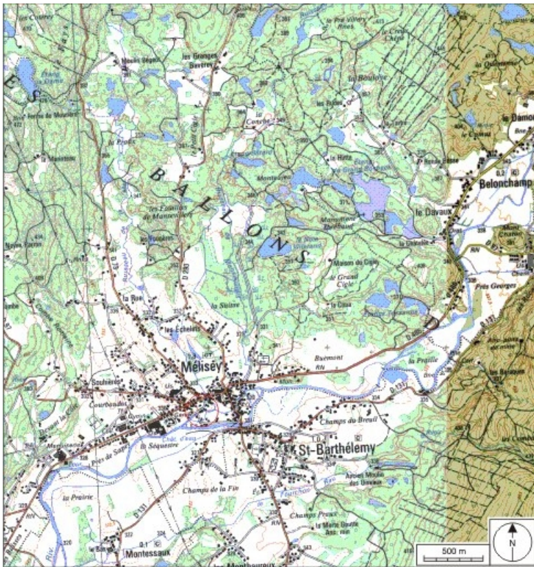
Carte de localisation. Carte topographique au 1:25000, I.G.N., Mélisey, 3520 O. SCAN 25, Licence n°2008CISE29-68. 70, Mélisey, 5 rue de l' Abattoir