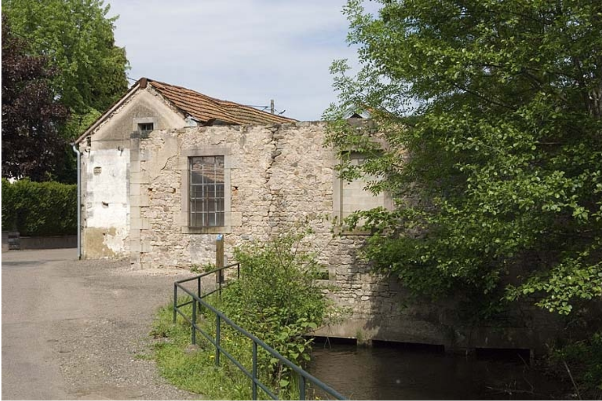
Pignons ouest de l'atelier de fabrication et canal de fuite.