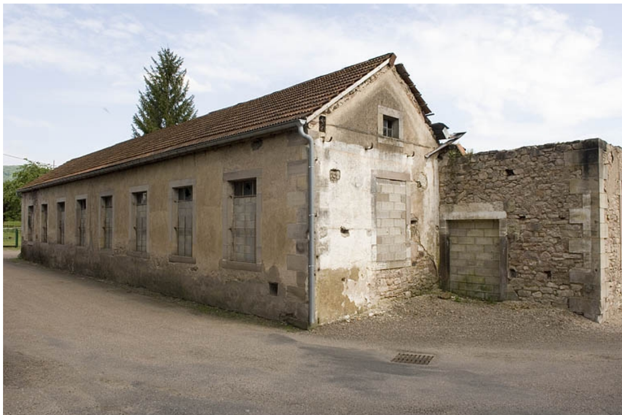
Façade nord de l'atelier de fabrication.