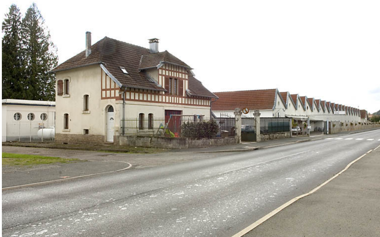
Vue d'ensemble depuis le nord-est.