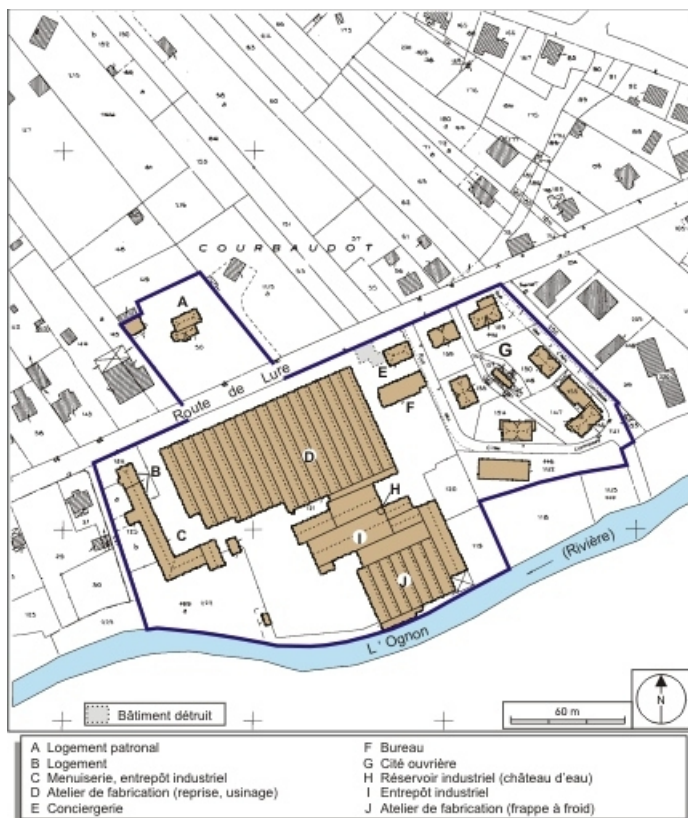
Plan-masse et de situation. Extrait du plan cadastral numérisé, 2005, section AC, 1:1000 réduit à 1:2000.