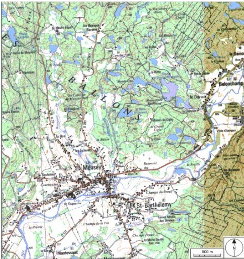
Carte de localisation. Carte topographique au 1:25000, I.G.N., Mélisey, 3520 O. 70, Mélisey, 54 à 58 route de Lure