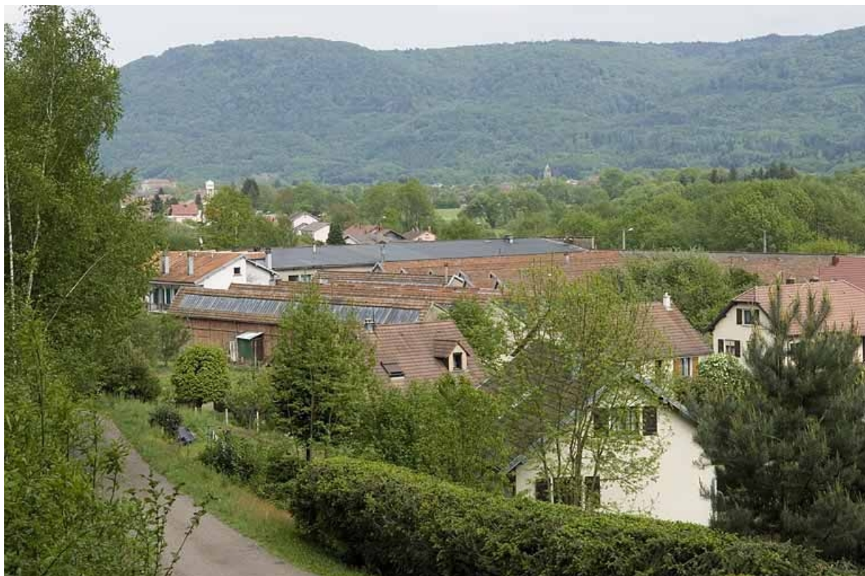
Vue plongeante depuis le nord-ouest.