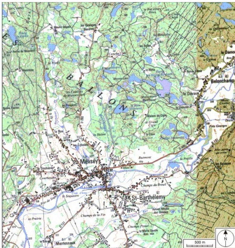
Carte de localisation. Carte topographique au 1:25000, I.G.N., Mëlisey, 3520 O. SCAN 25, Licence n°2008CISE29-68. 70, Mëlisey, 54 à 58 route de Lure