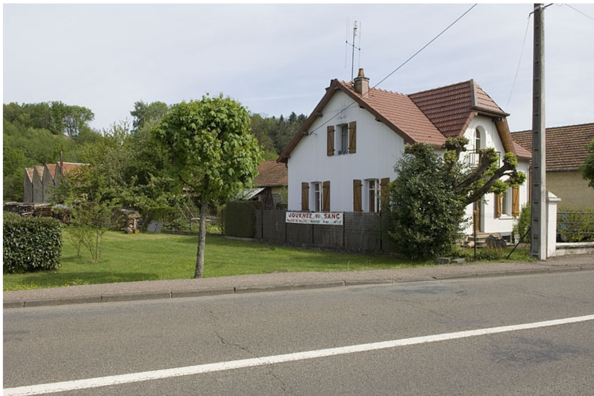
Vue d'ensemble depuis l'ouest.