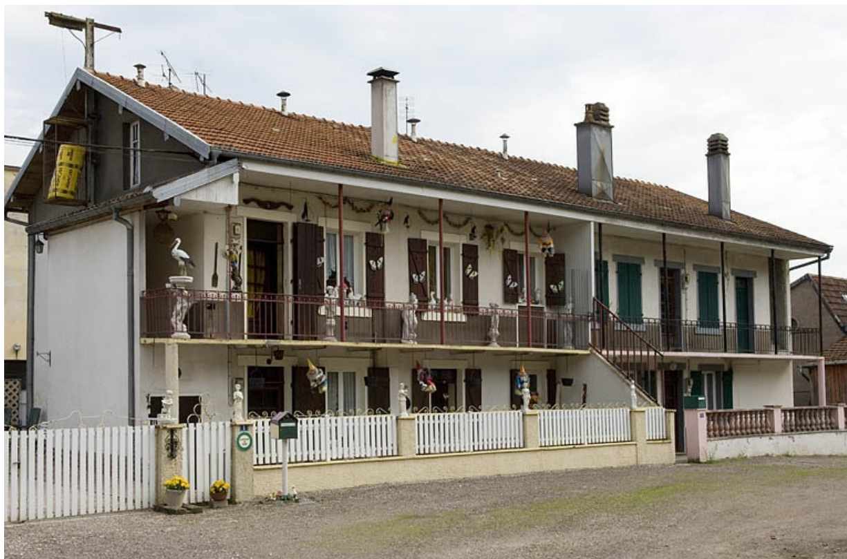
Logement ouvrier à étage (est). 70, Mélisey, 54 à 58 route de Lure