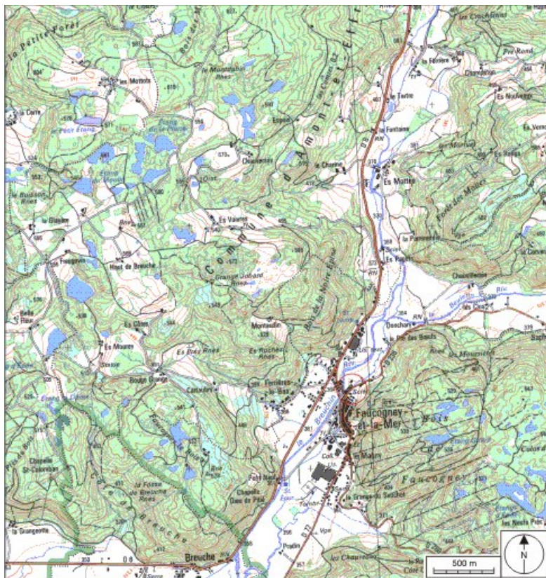
Carte de localisation. Carte topographique au 1:25000, I.G.N., Mélisey, 3520 O. Licence n°2008CISE29-68. 70, Faucogney-et-la-Mer, 1 rue de la Petite Rochotte