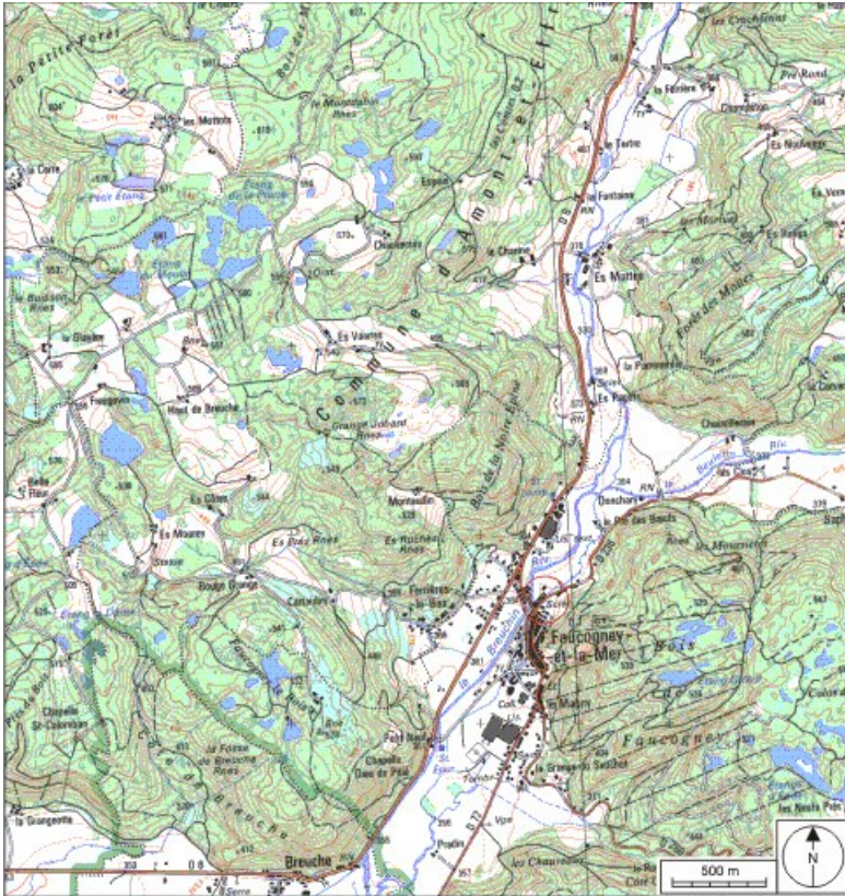
Carte de localisation. Carte topographique au 1:25000, I.G.N., Mélisey, 3520 O. 70, Faucogney-et-la-Mer, 1 rue de la Petite Rochotte