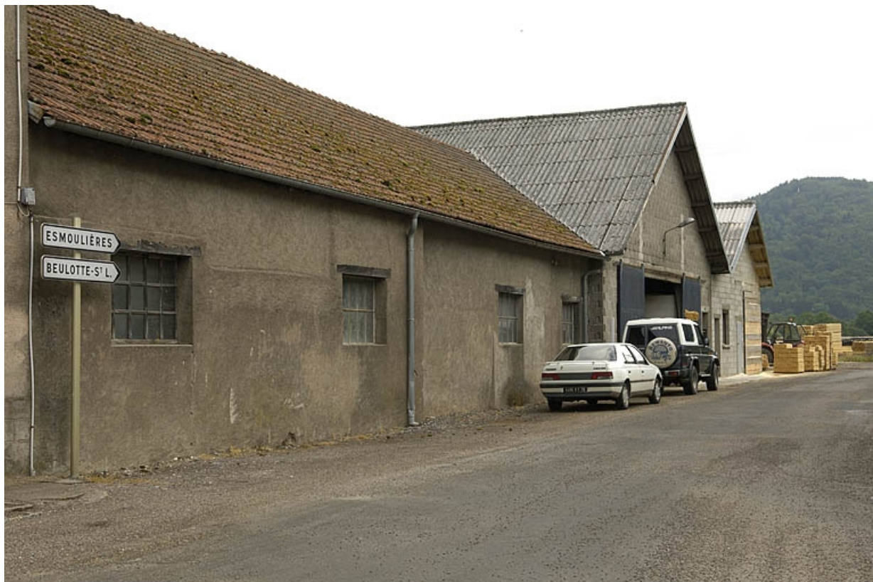
Façade de l'atelier de tournerie.

70, Faucogney-et-la-Mer, 1 rue de la Petite Rochotte