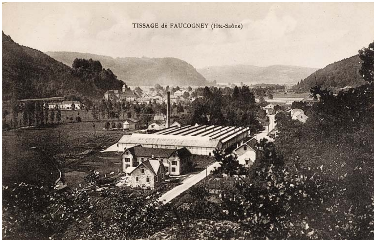
Tissage de Faucogney (Haute-Saône).