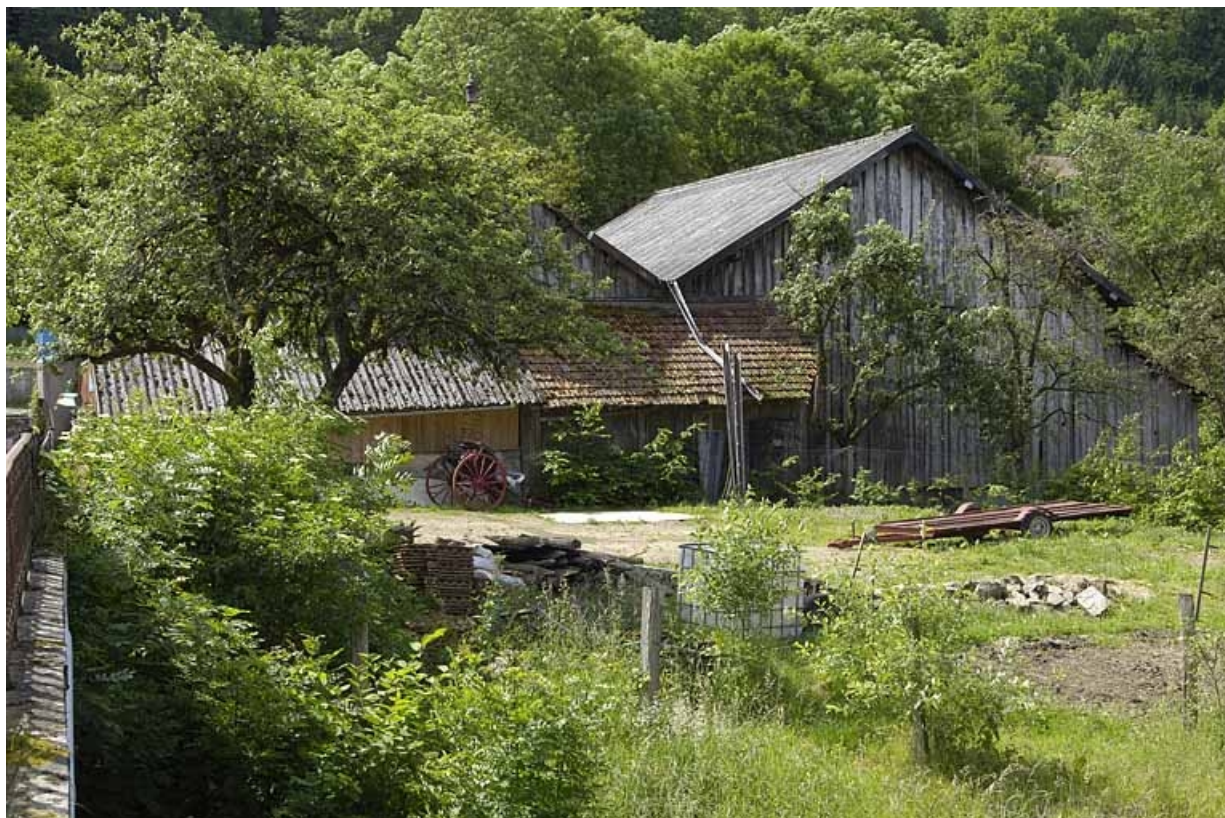
Pignons de l'atelier de scierie.