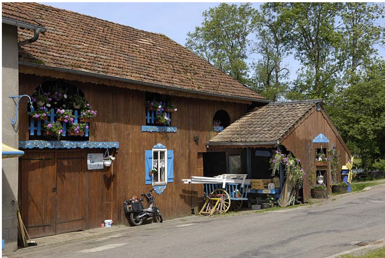
Façade est de l'atelier de scierie.