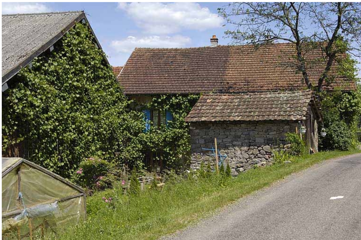
Façade postérieure du logement.