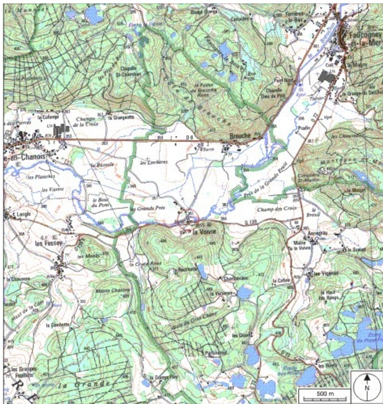
Carte de localisation. Carte topographique au 1:25000, I.G.N., Mélisey, 3520 O. 70, La Voivre R.D.139