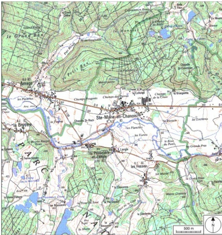
Carte de localisation. Carte topographique au 1:25000, I.G.N., Mélisey, 3520 O. 70, Sainte-Marie-en-Chanois, lieu-dit : sur le Breuchin