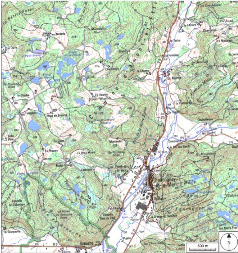
Carte de localisation. Carte topographique au 1:25000, I.G.N., Mélisey, 3520 O. 70, Amont-et-Effreney, lieu-dit : Es Mottes