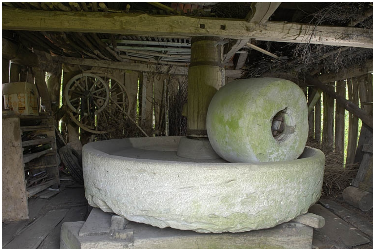
La ribe vue depuis l'entrée.

70, Amont-et-Effreney, lieudit : Es Mottes