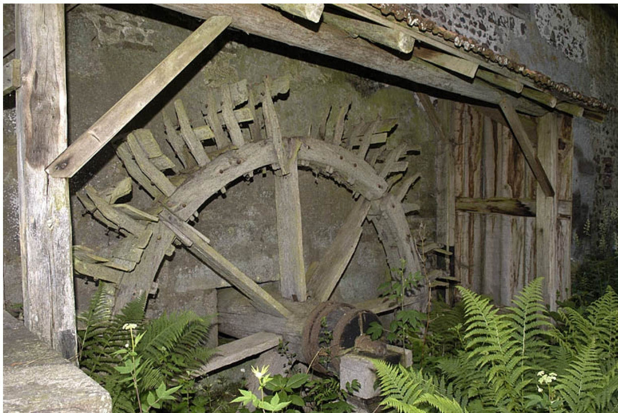
Détail de la roue hydraulique en dessous.

70, Amont-et-Effreney, lieudit : Es Mottes