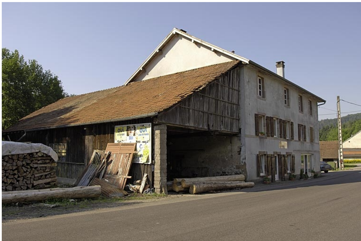
Atelier de la scierie et moulin vus depuis la route départementale.

70, Amont-et-Effreney, lieudit : la Rochotte