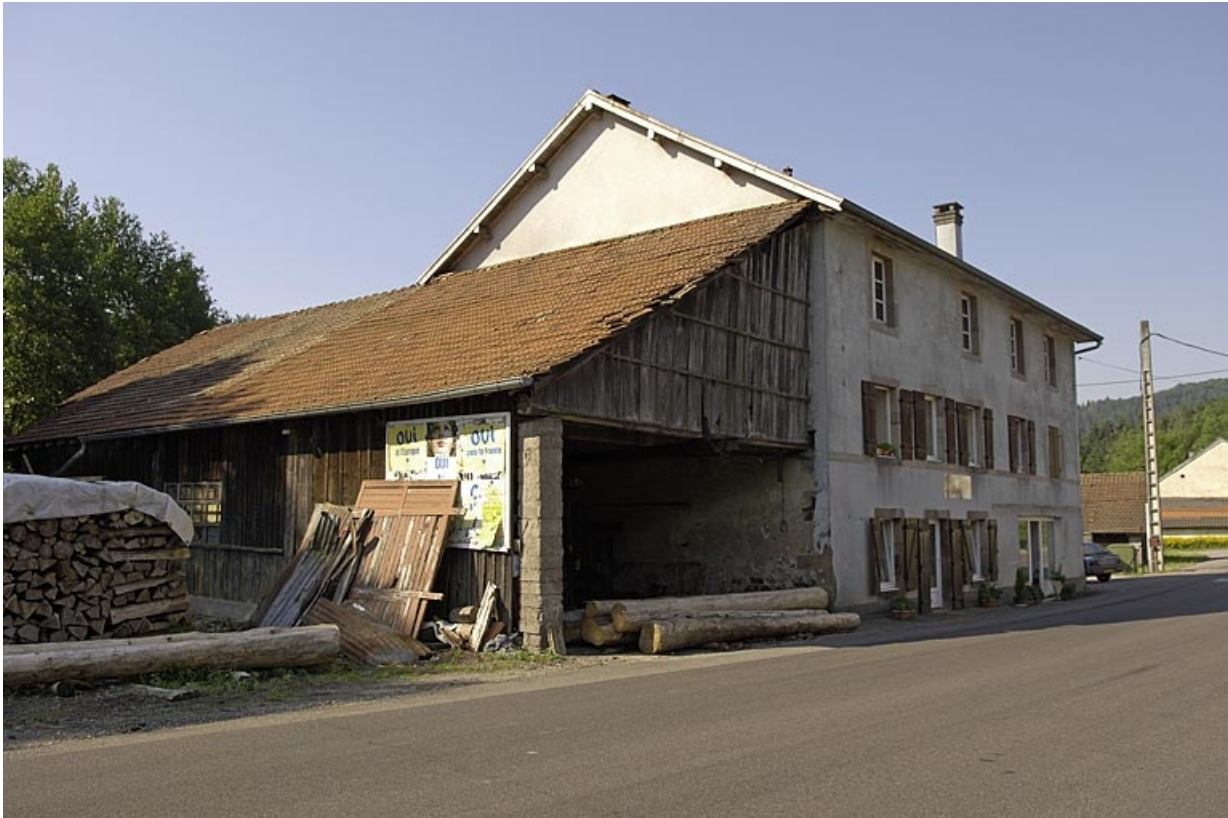
Atelier de la scierie et moulin vus depuis la route départementale.

70, Amont-et-Effreney, lieudit : la Rochotte