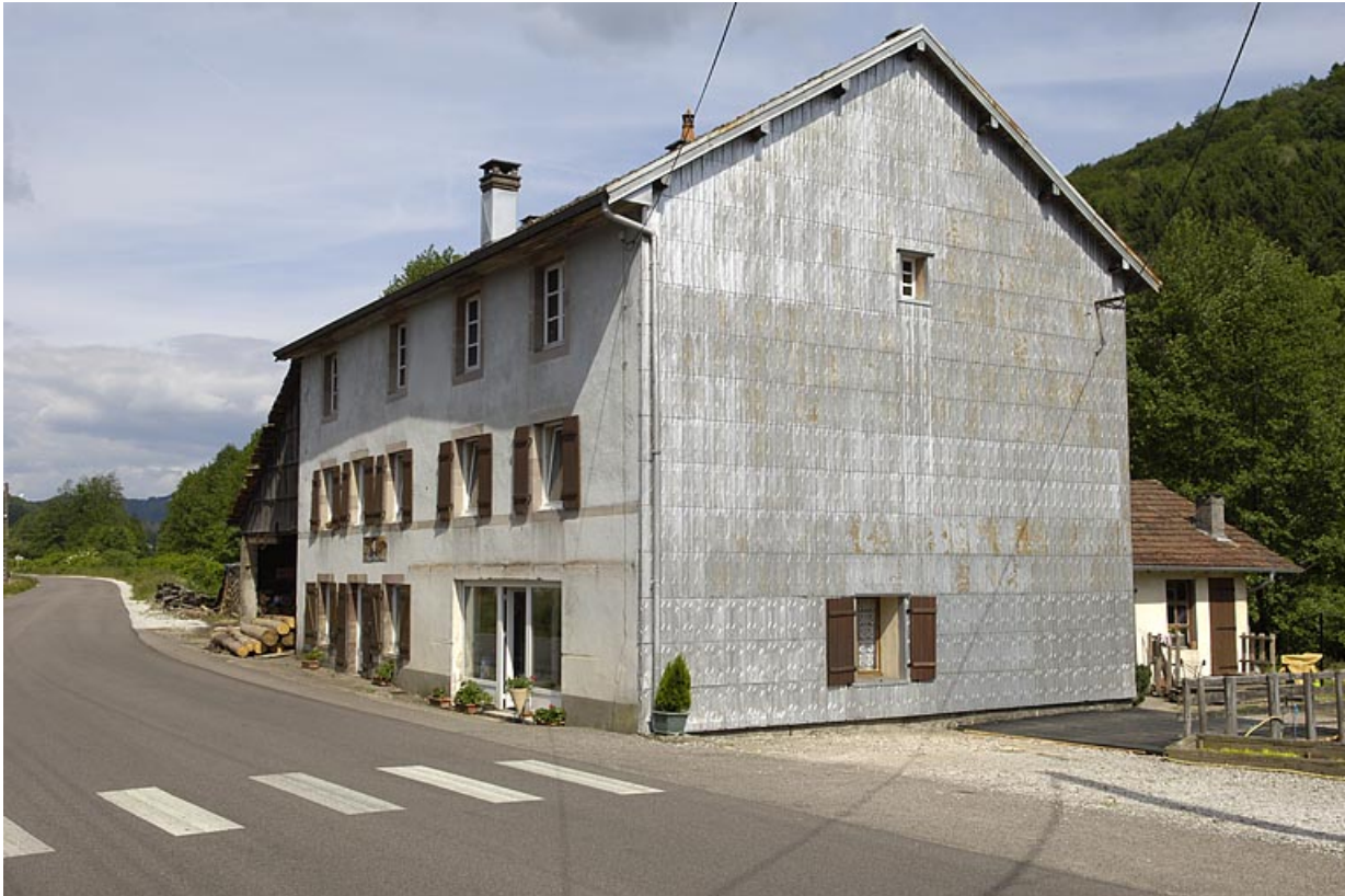
Le moulin vu de trois quarts droite.

70, Amont-et-Effreney, lieudit : la Rochotte