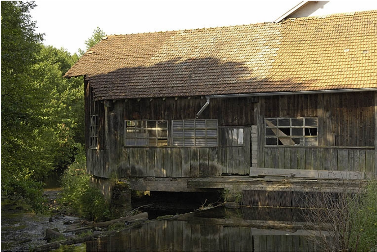
Atelier de la scierie sur le Breuchin.

70, Amont-et-Effreney, lieudit : la Rochotte