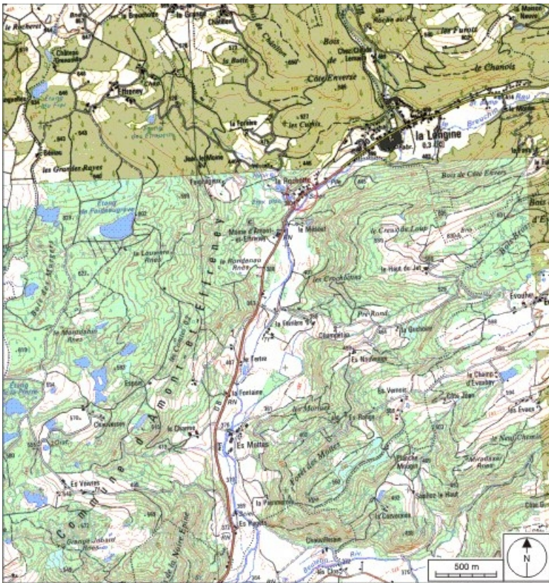
Carte de localisation. Carte topographique au 1:25000, I.G.N., Mélisey, 3520 O. SCAN 25, Licence n°2008CISE29-68. 70, Amont-et-Effreney, lieu-dit : la Rochotte