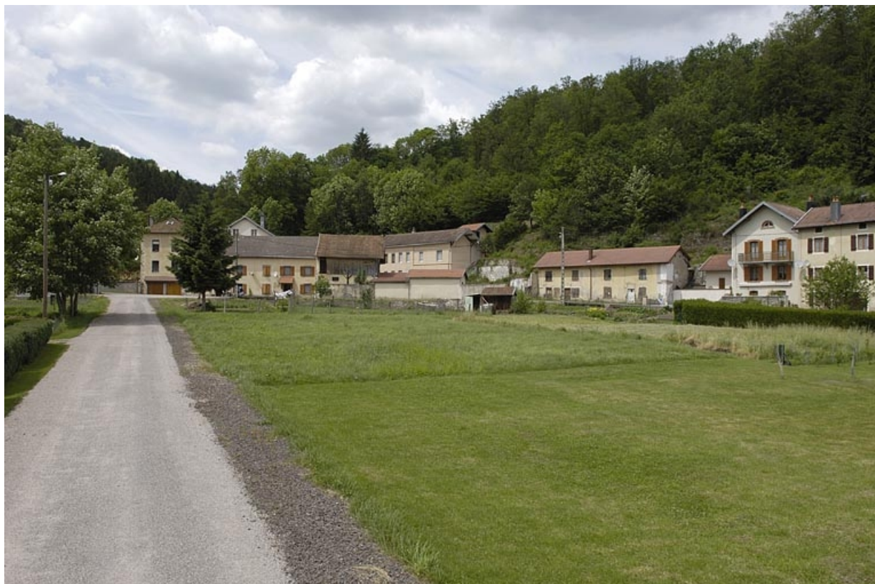
Vue d'ensemble depuis le sud. 70, La Longine impasse du Tissage