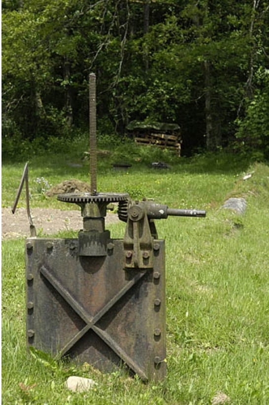
Vannage de la conduite forcée.