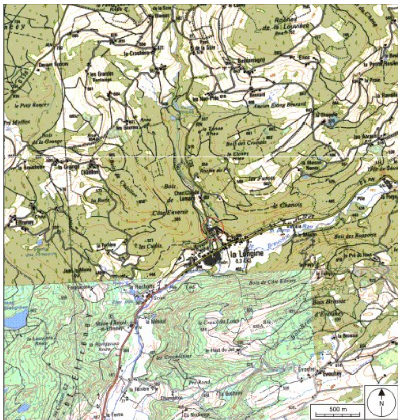
Carte de localisation. Carte topographique au 1:25000, I.G.N., Remiremont, 3519 OT. SCAN 25 © IGN - 2008, Licence n°2008CISE29-68.