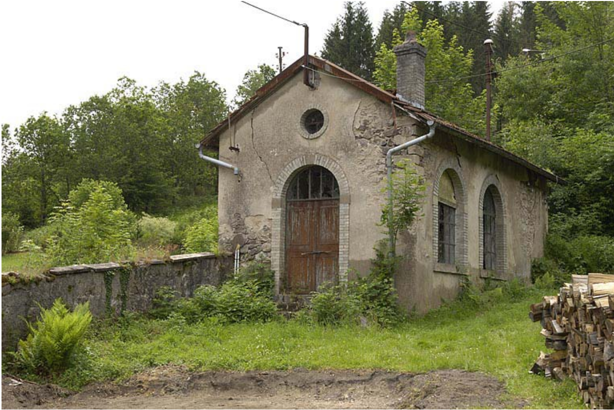
Ancienne centrale hydroélectrique.