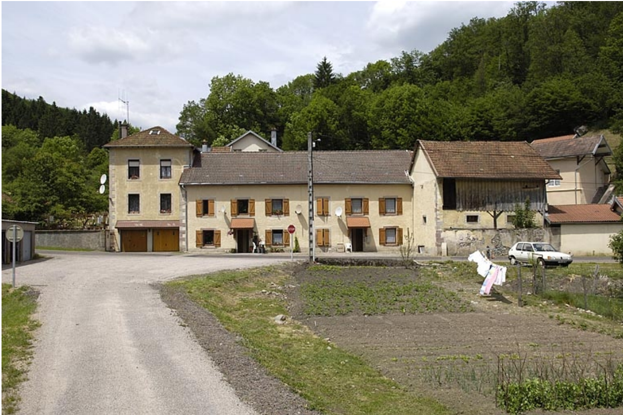
Logements vus depuis le sud.