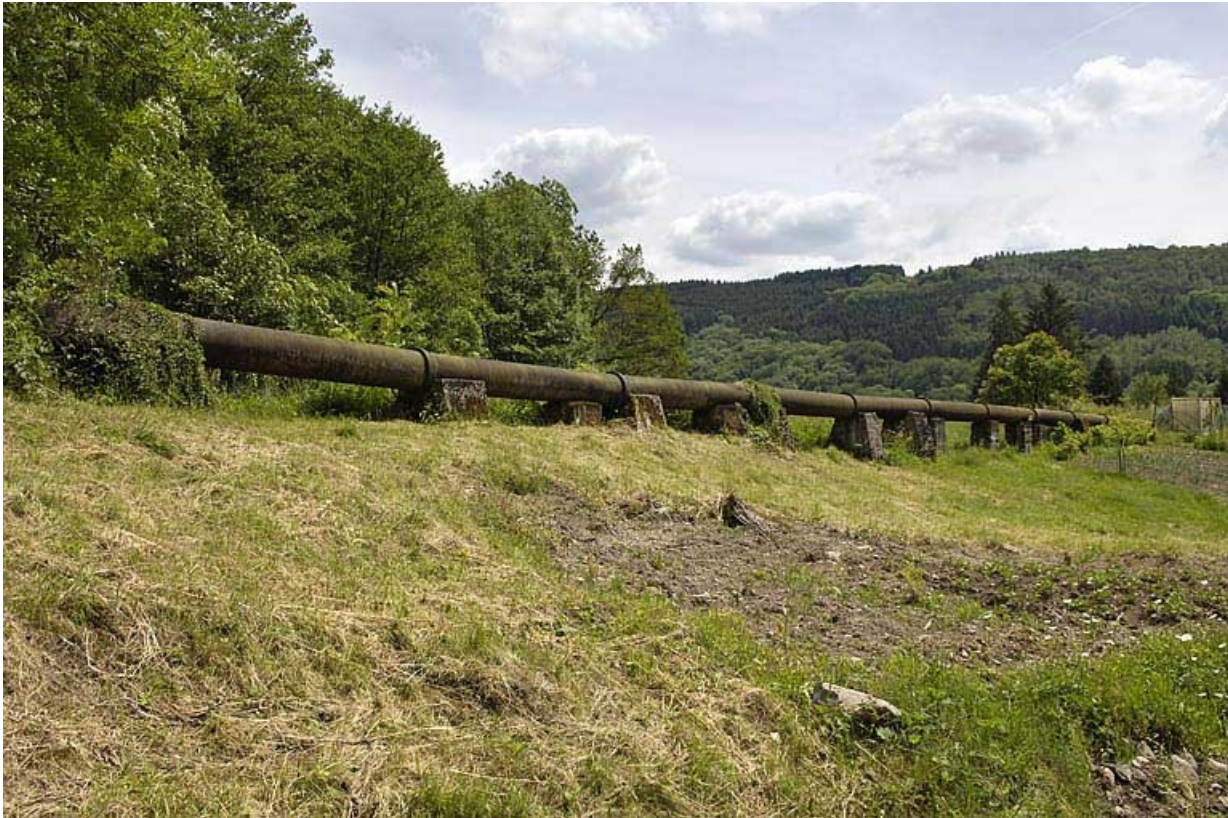
Conduite forcée de la centrale hydroélectrique.