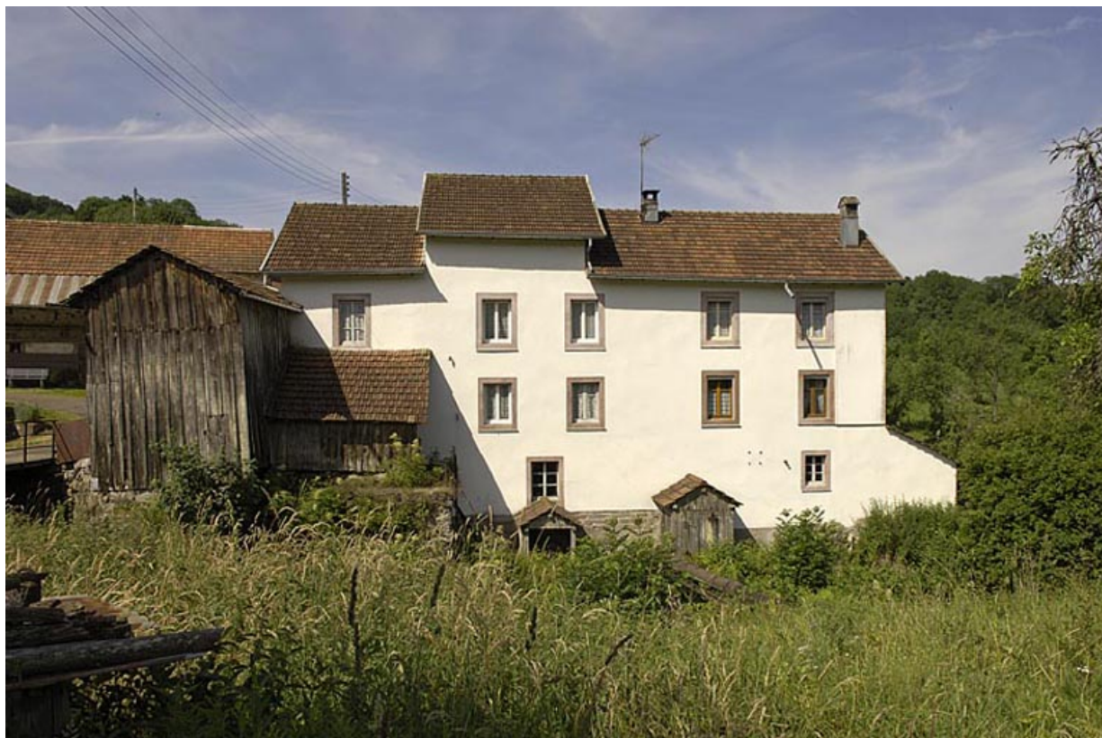
Façade est de la minoterie.