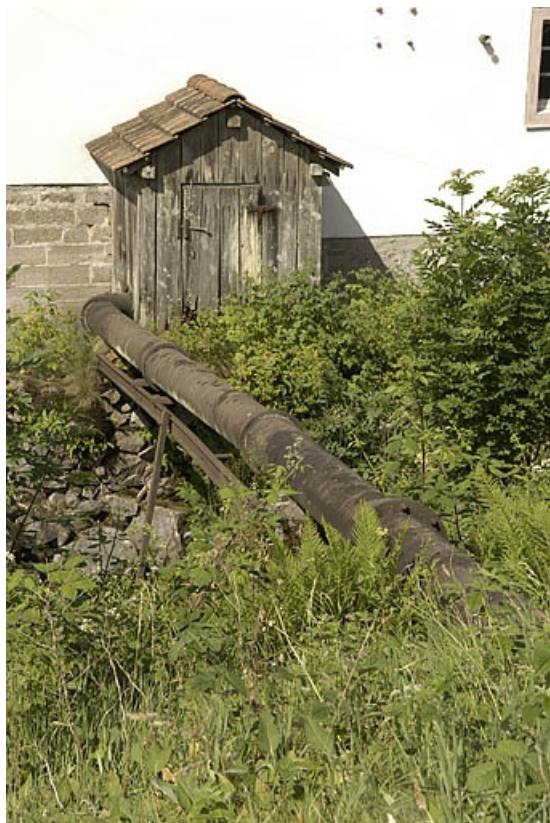
Conduite forcée et bâtiment d'eau abritant la turbine.