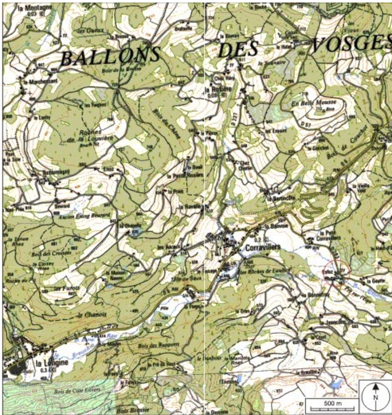
Carte de localisation. Carte topographique au 1:25000, I.G.N., Remiremont, 3519 OT. SCAN 25 © IGN - 2008, Licence n°2008CISE29-68.