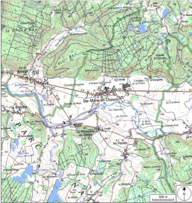
Carte de localisation. Carte topographique au 1:25000, I.G.N., Mélisey, 3520 O. SCAN 25, Licence n°2008CISE29-68. 70, Amage, lieudit : sur le Breuchin