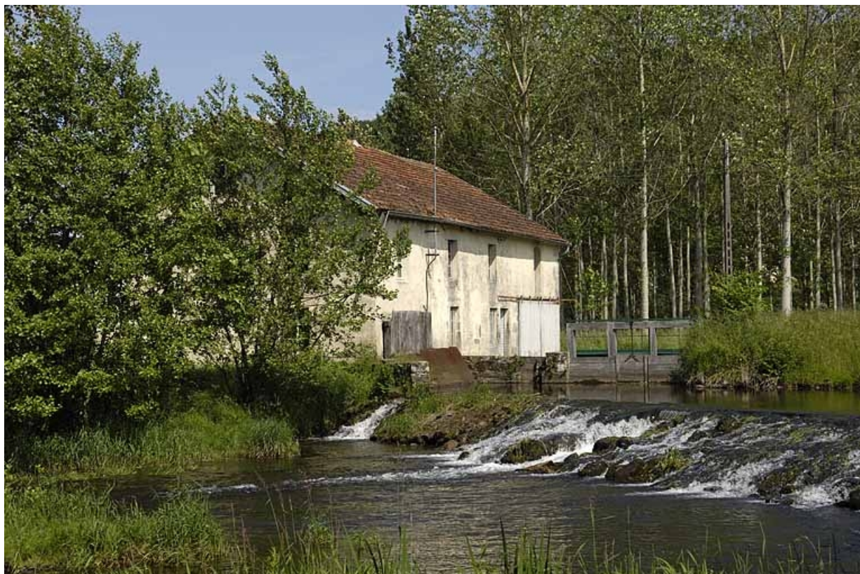
Vue de trois quarts depuis la rive gauche du Breuchin.