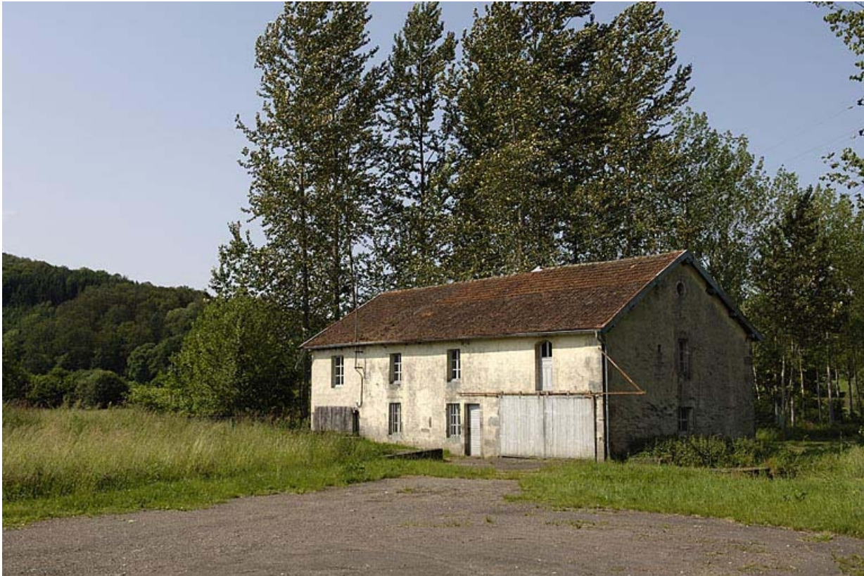
Vue de trois quarts droite.