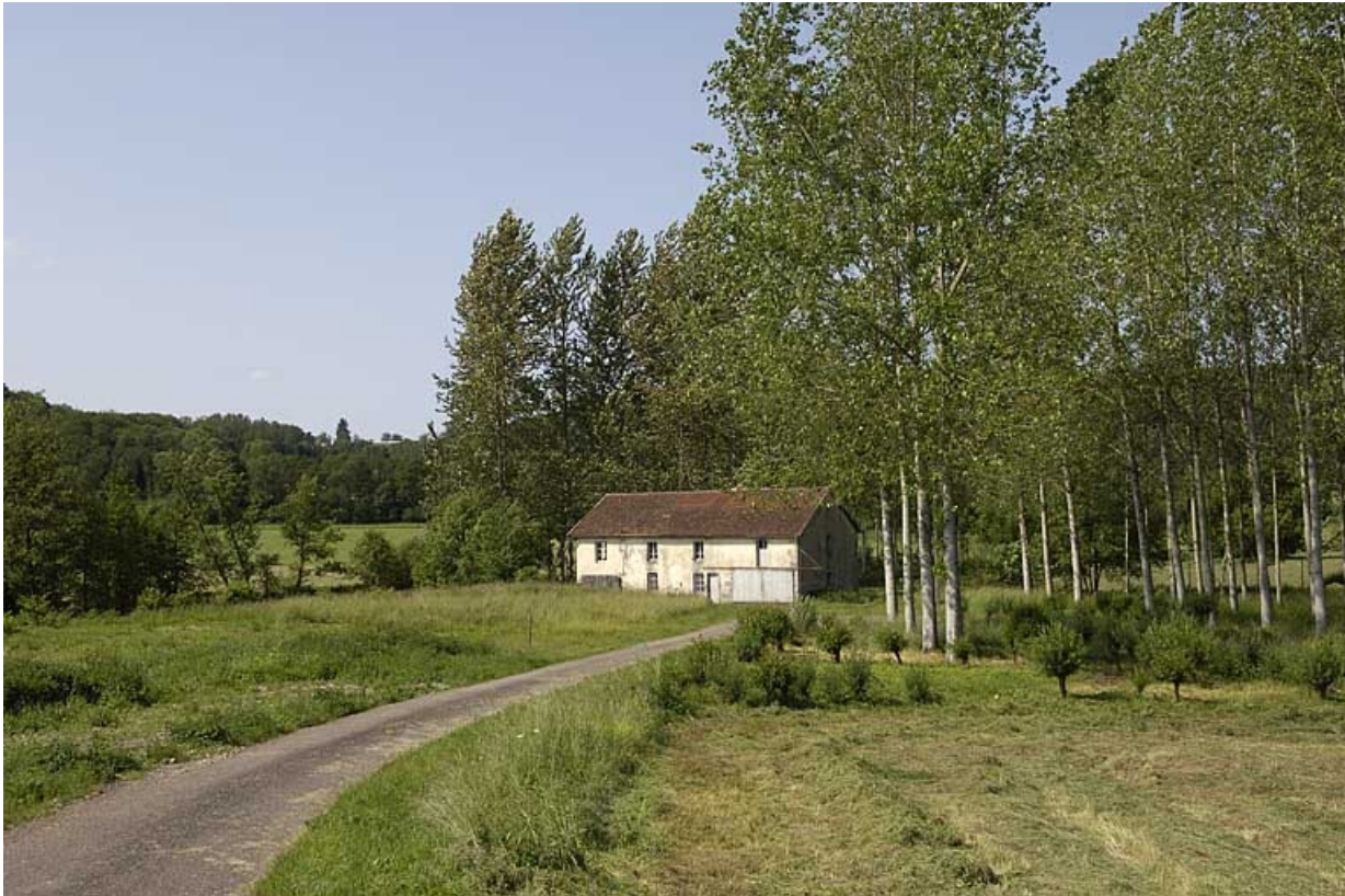
Vue d'ensemble depuis le nord-est.