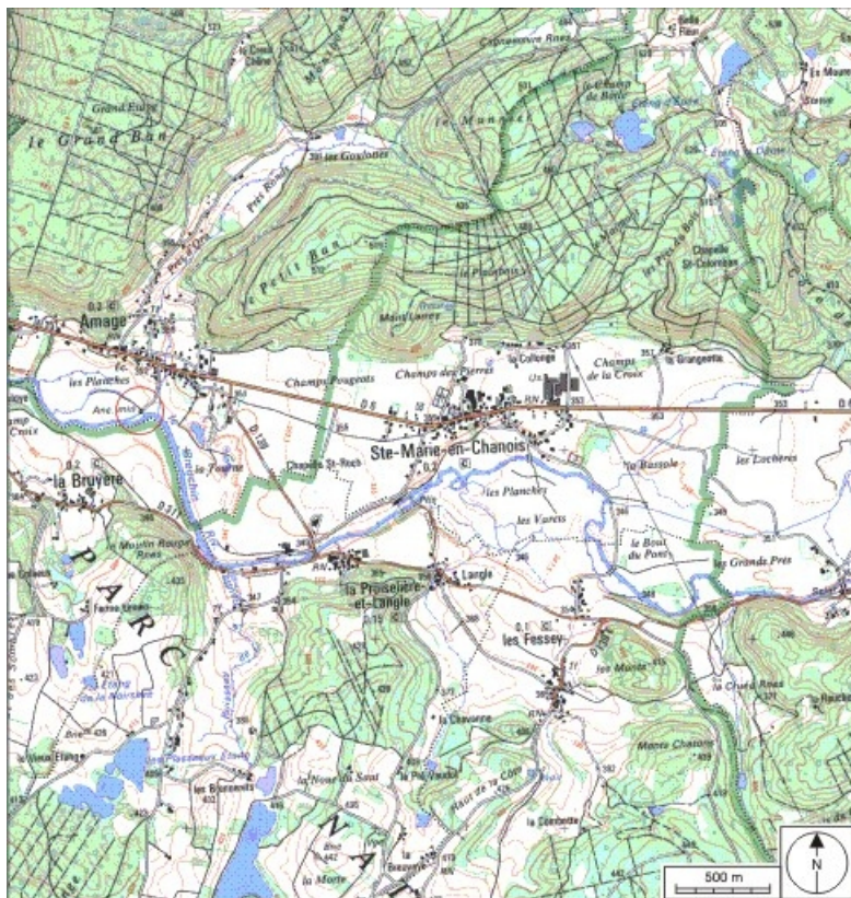
Carte de localisation. Carte topographique au 1:25000, I.G.N., Mélisey, 3520 O. SCAN 25, Licence n°2008CISE29-68. 70, Amage, lieudit : sur le Breuchin