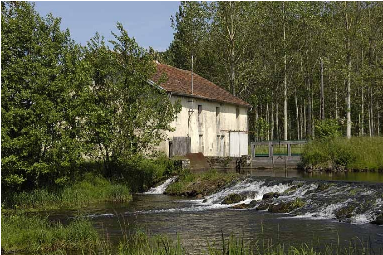
Vue de trois quarts depuis la rive gauche du Breuchin.