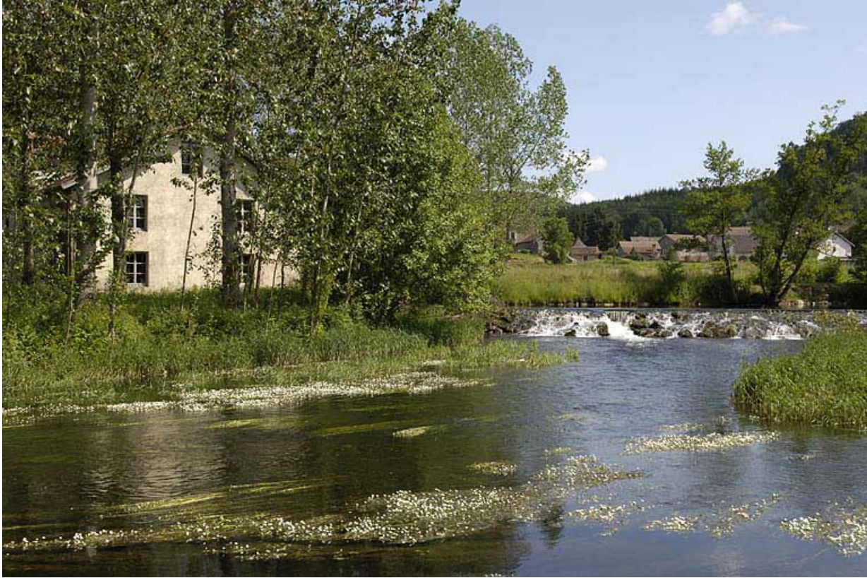
Le moulin et son barrage depuis le sud.