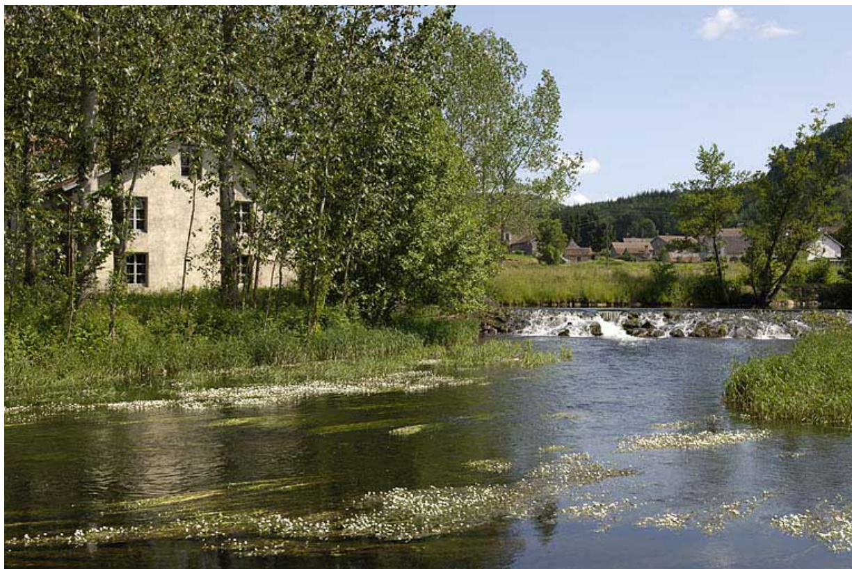
Le moulin et son barrage depuis le sud.