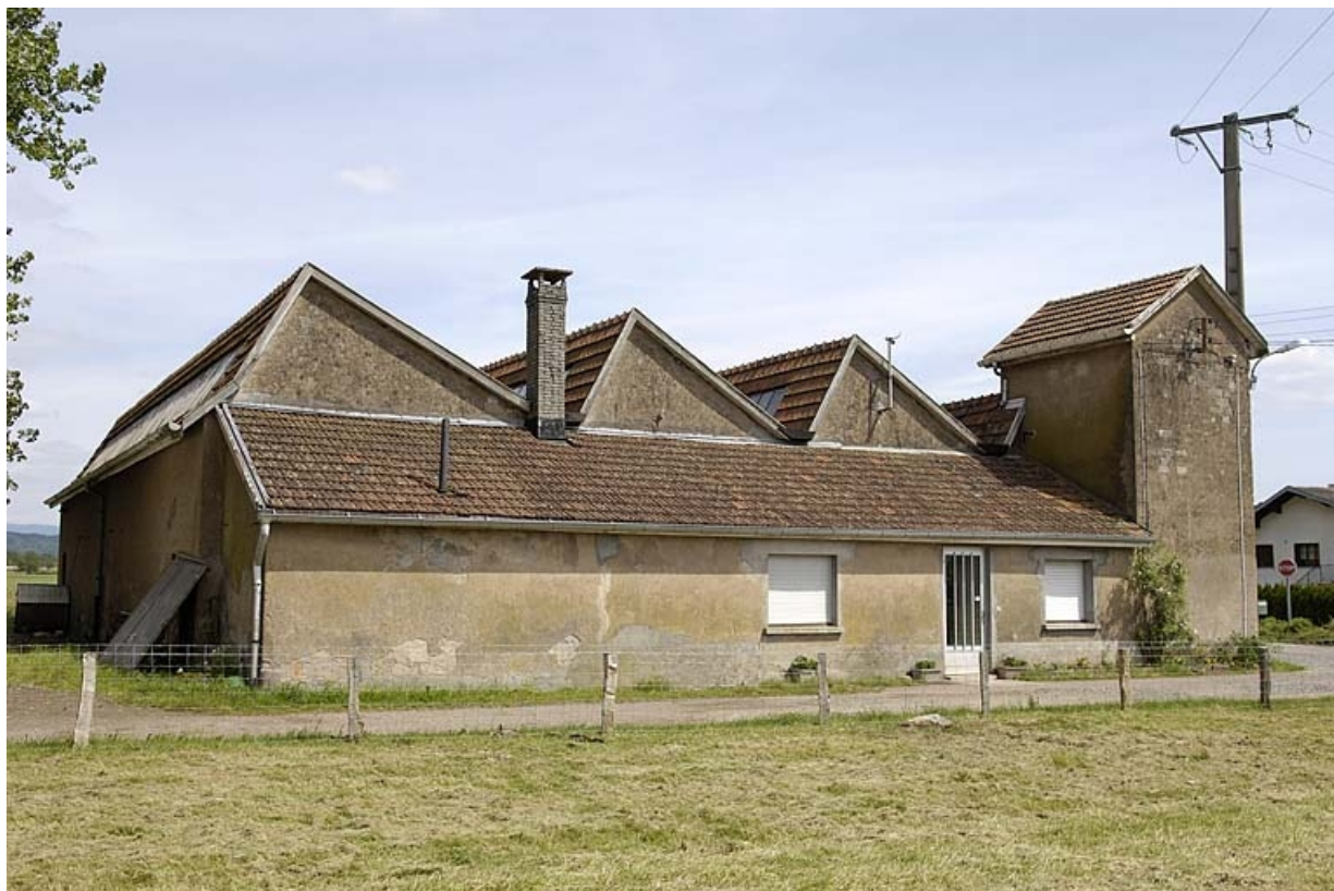
Salle de tissage et transformateur depuis le nord-ouest. 70, Amage R.D. 6