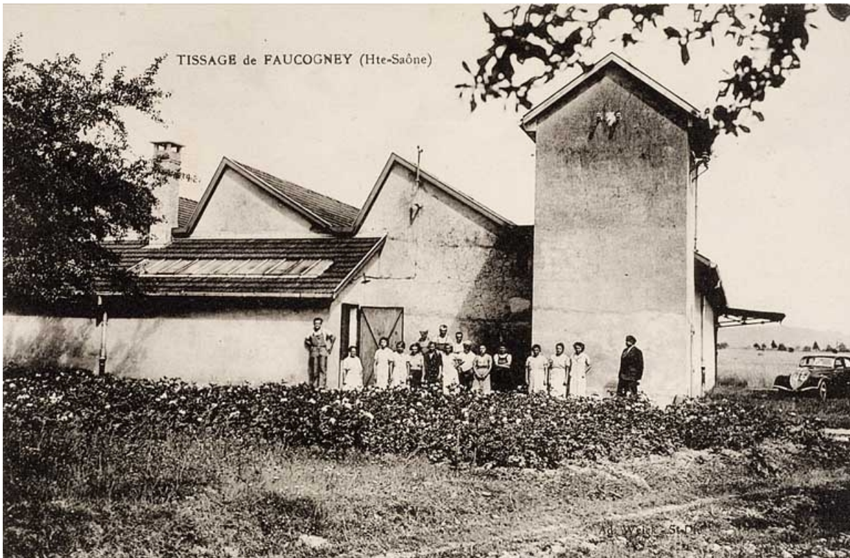
Tissage d'Amage [improprement légendé : Tissage de Faucogney] : vue depuis l'ouest. 70, Amage R.D. 6