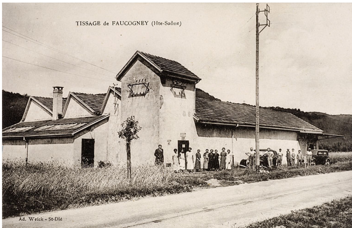
Tissage d'Amage [improprement légendé : Tissage de Fauconney] : vue d'ensemble depuis le sud-ouest. 70, Amage R.D. 6