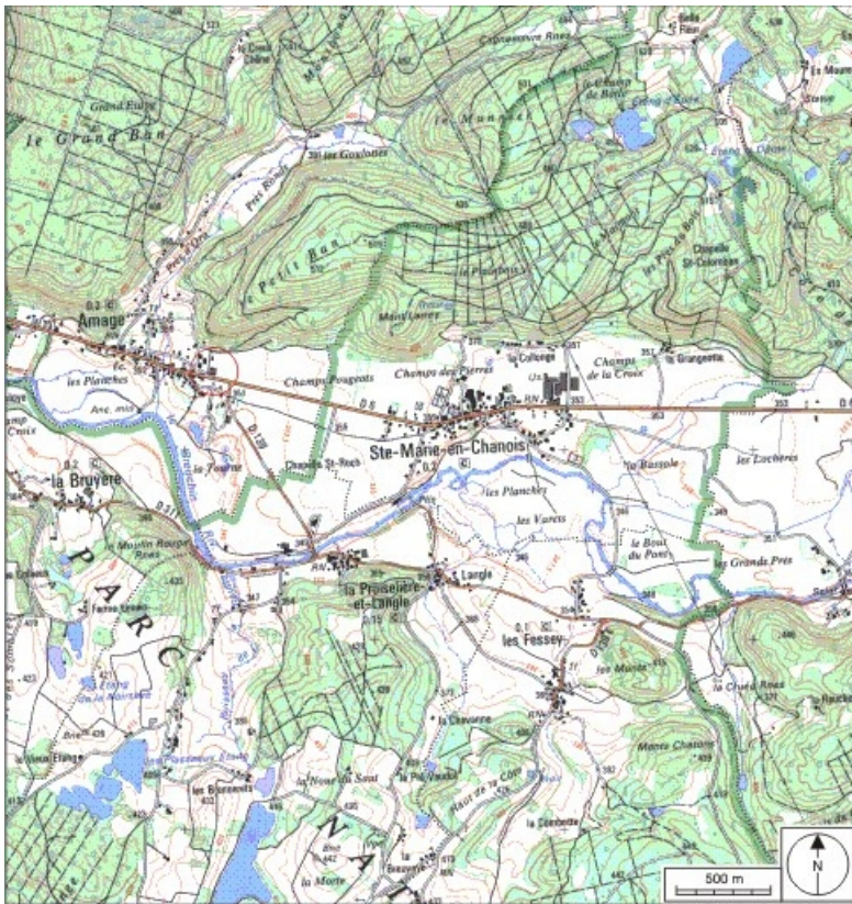
Carte de localisation. Carte topographique au 1:25000, I.G.N., Mélisey, 3520 O. 70, Amage R.D. 6