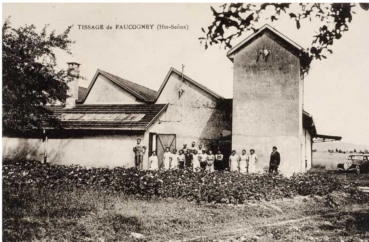
Tissage d'Amage [improprement légendé : Tissage de Faucogney] : vue depuis l'ouest.