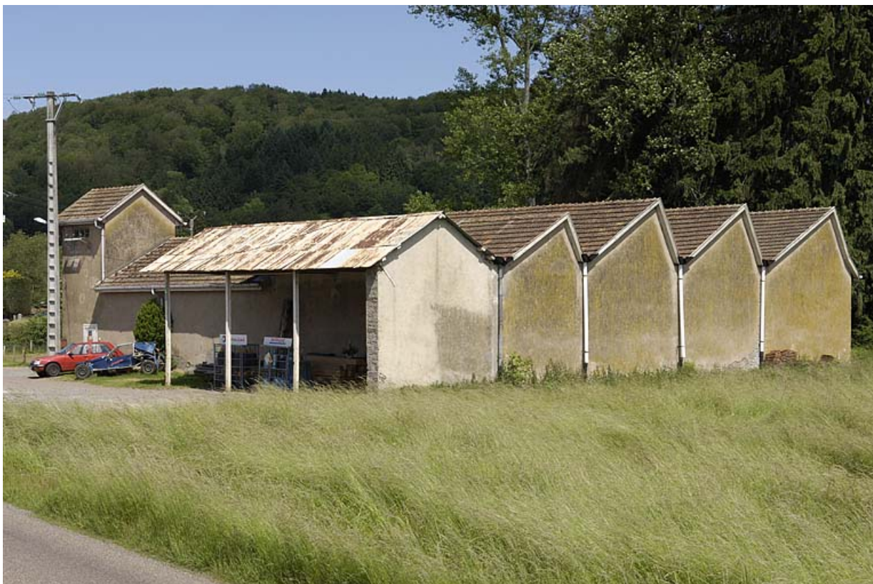
Vue d'ensemble depuis le sud-est. 70, Amage R.D. 6