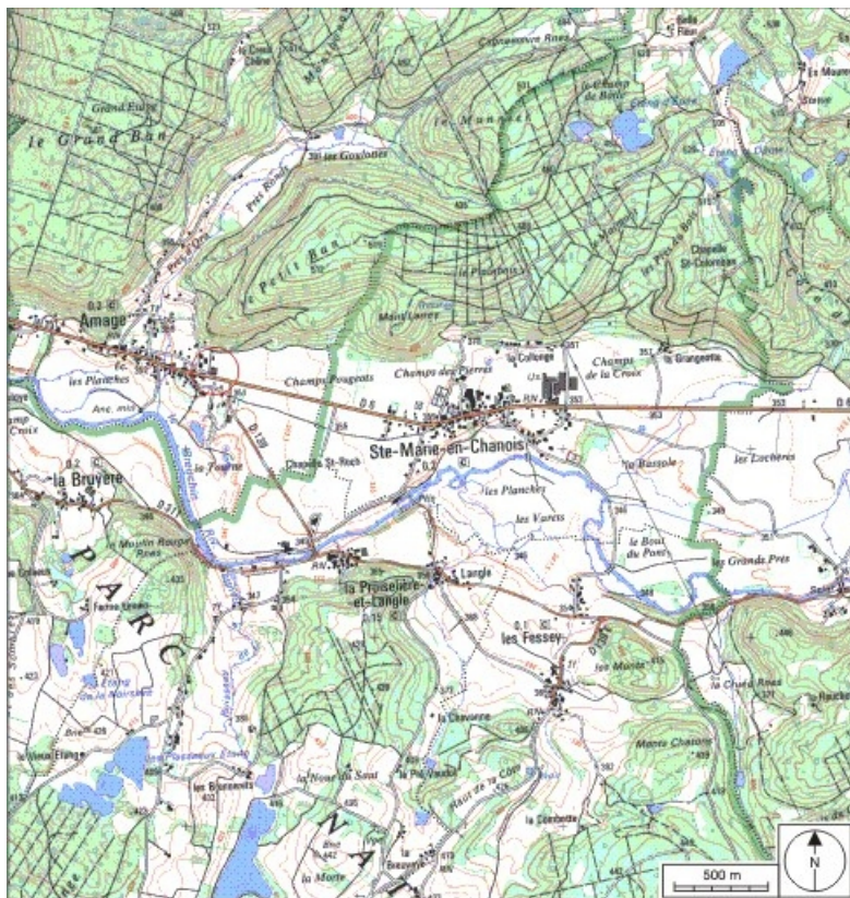
Carte de localisation. Carte topographique au 1:25000, I.G.N., Mélisey, 3520 O. SCAN 25, Licence n°2008CISE29-68. 70, Amage R.D. 6