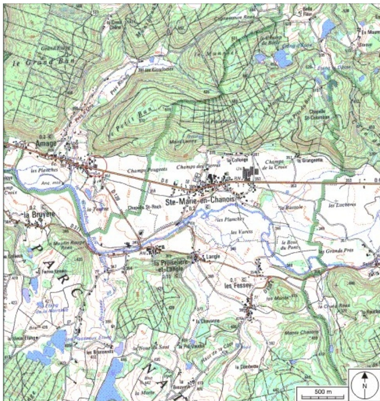
Carte de localisation. Carte topographique au 1:25000, I.G.N., Mëlisey, 3520 O. SCAN 25 70, Amage R.D. 6