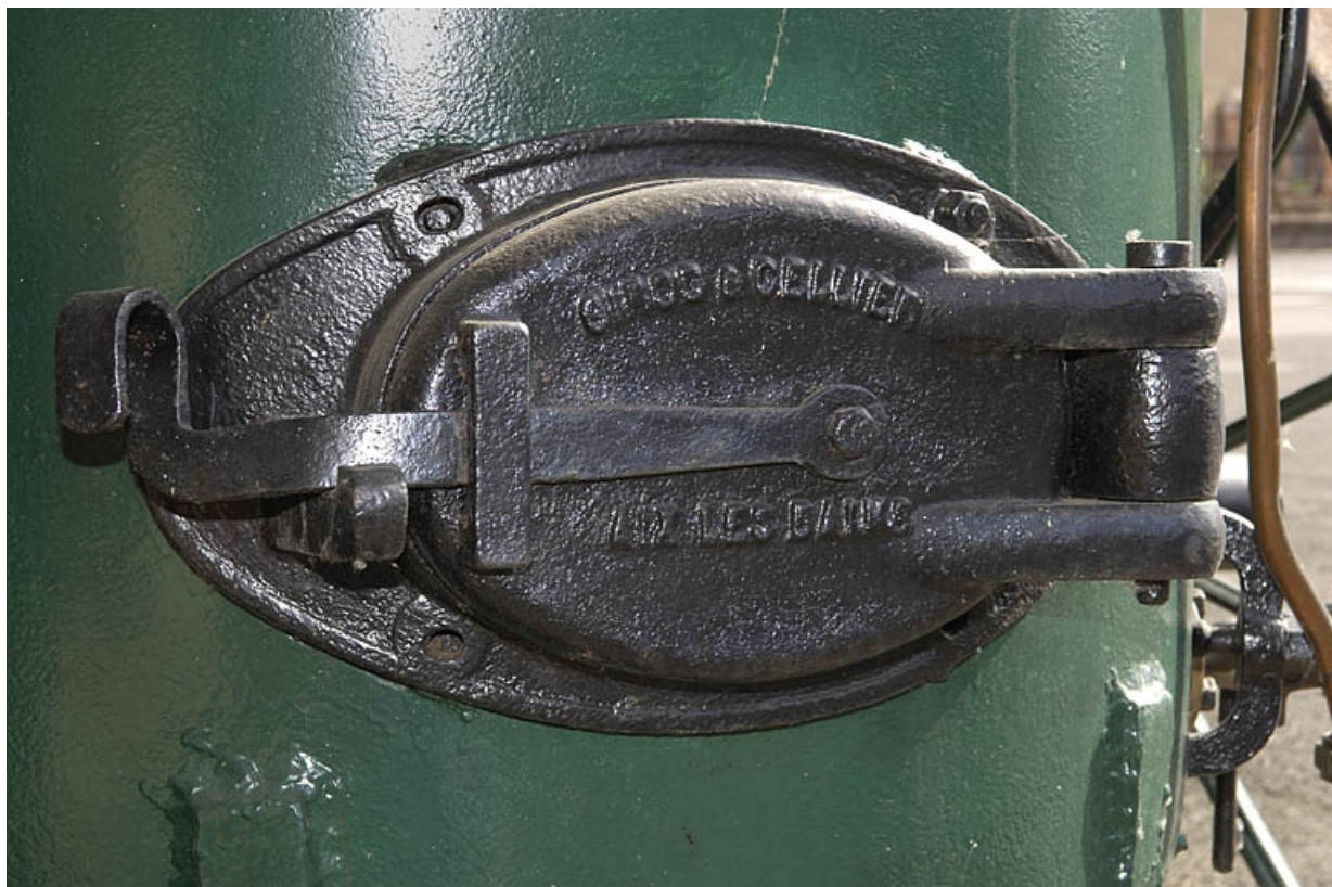
Alambic ambulant. Détail de la porte de la chaudière.

70, Raddon-et-Chapendu, 9 avenue du Breuchin