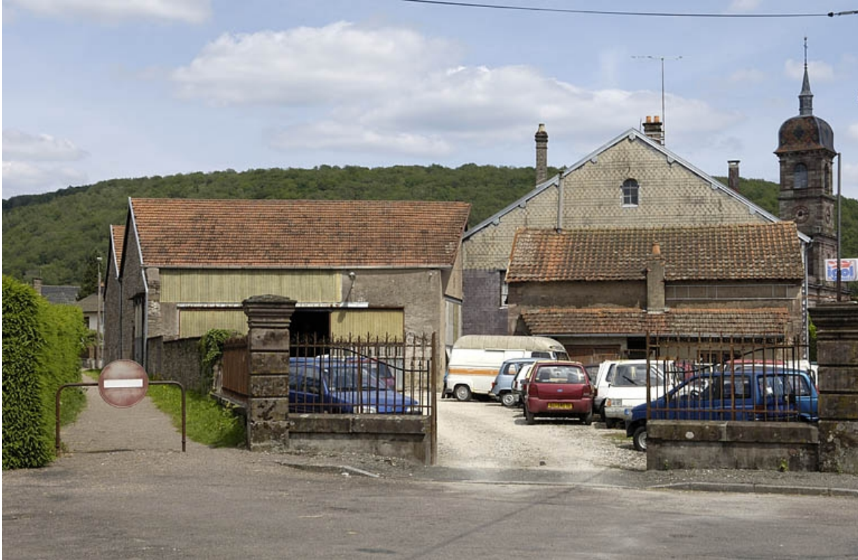
Atelier de fabrication et logement depuis l'ouest.

70, Raddon-et-Chapendu, 6 avenue du Breuchin