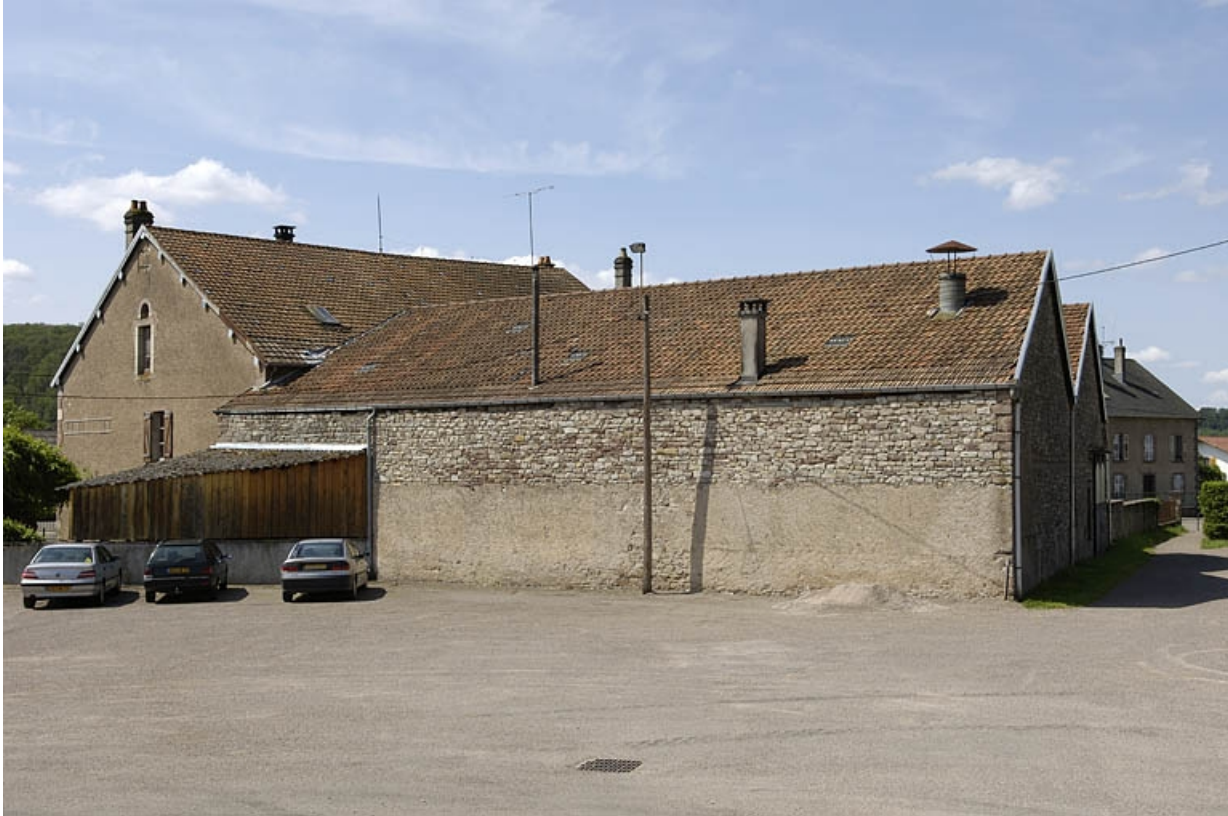
Logement et atelier de fabrication depuis le nord-est.

70, Raddon-et-Chapendu, 6 avenue du Breuchin