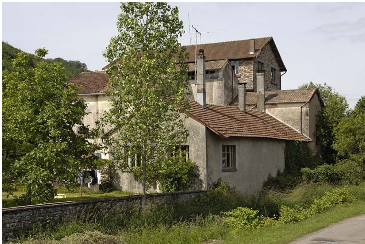
Vue depuis l'aval, sur la rive gauche du Raddon.