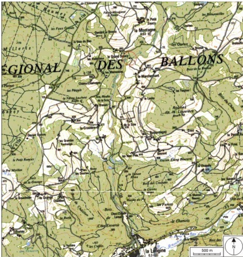
Carte de localisation. Carte topographique au 1:25000, I.G.N., Remiremont, 3519 OT. SCAN 25 © IGN - 2008, Licence n°2008CISE29-68.

70, La Montagne, lieu-dit : le Marchessant