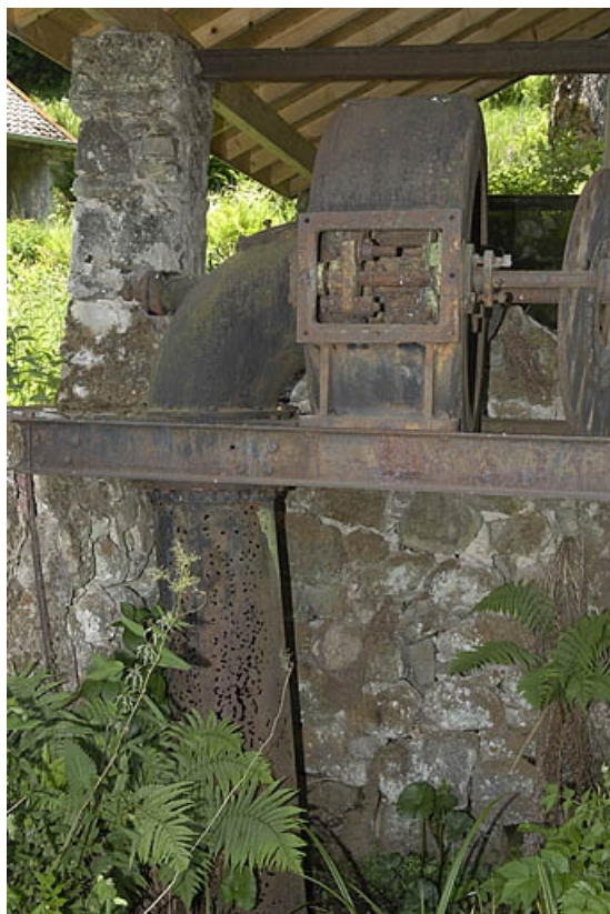
Turbine horizontale et sa conduite d'évacuation.

70, La Montagne, lieudit : le Marchessant