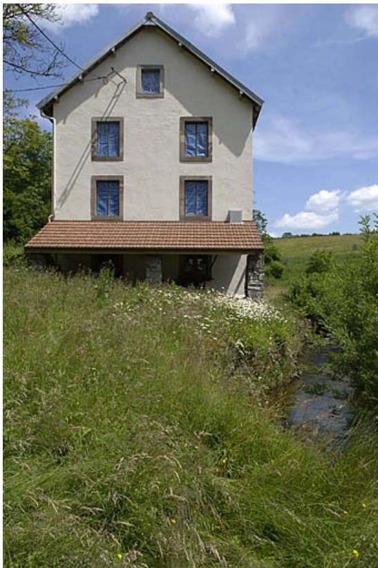
Façade nord-ouest et appentis abritant la turbine.

70, La Montagne, lieudit : le Marchessant