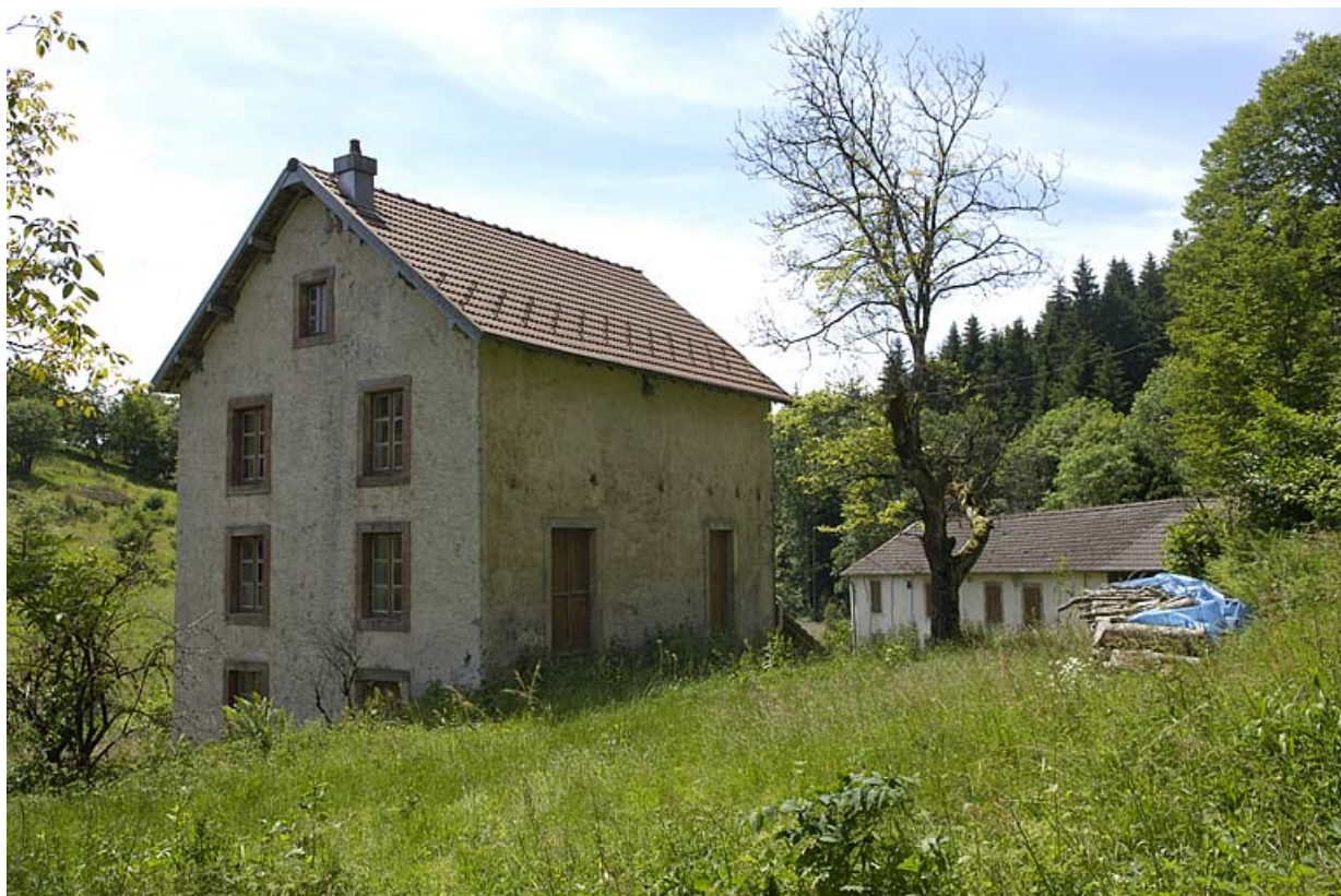
Vu du moulin depuis l'est.

70, La Montagne, lieudit : le Marchessant