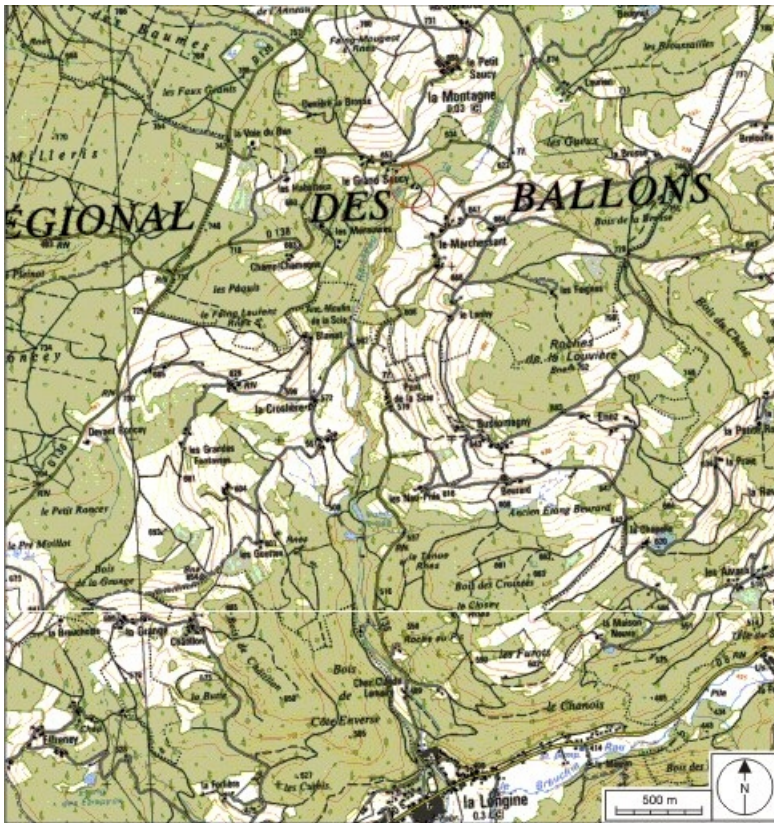
Carte de localisation. Carte topographique au 1:25000, I.G.N., Remiremont, 3519 OT. SCAN 25 © IGN - 2008, Licence n°2008CISE29-68.

70, La Montagne, lieudit : le Marchessant