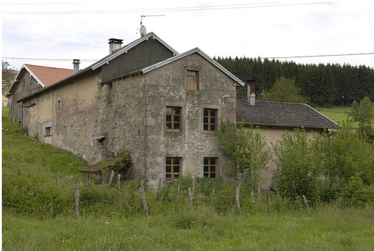
Atelier de fabrication du moulin vu depuis l'ouest.

70, Saint-Bresson, lieudit : les Prés Benons