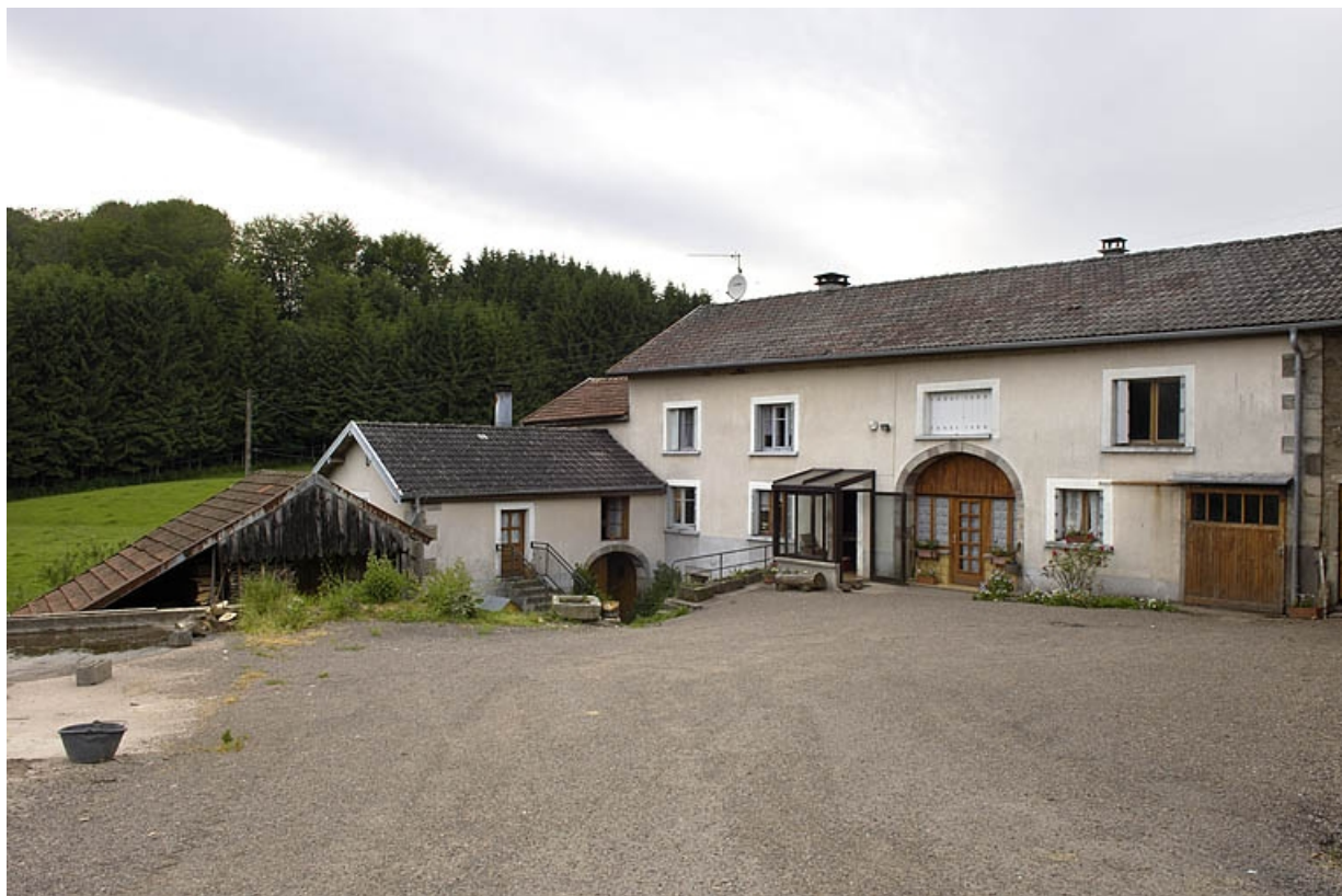
Le moulin et la ferme depuis l'entrée.

70, Saint-Bresson, lieudit : les Prés Benons