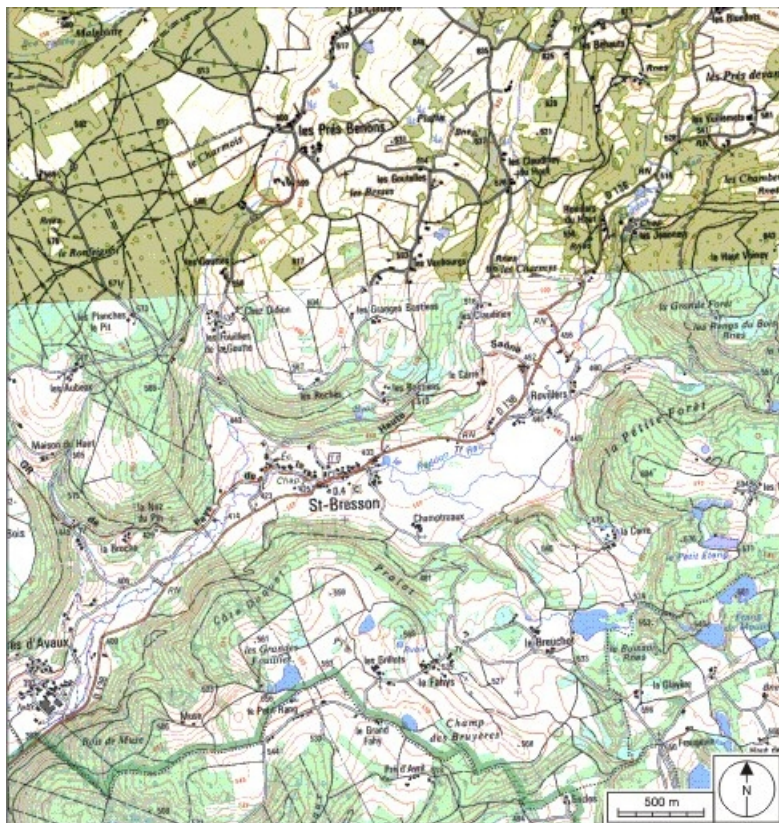
Carte de localisation. Carte topographique au 1:25000, I.G.N., Remiremont, 3519 OT. SCAN 25 © IGN - 2008, Licence n°2008CISE29-68.

70, Saint-Bresson, lieu-dit : les Prés Benons