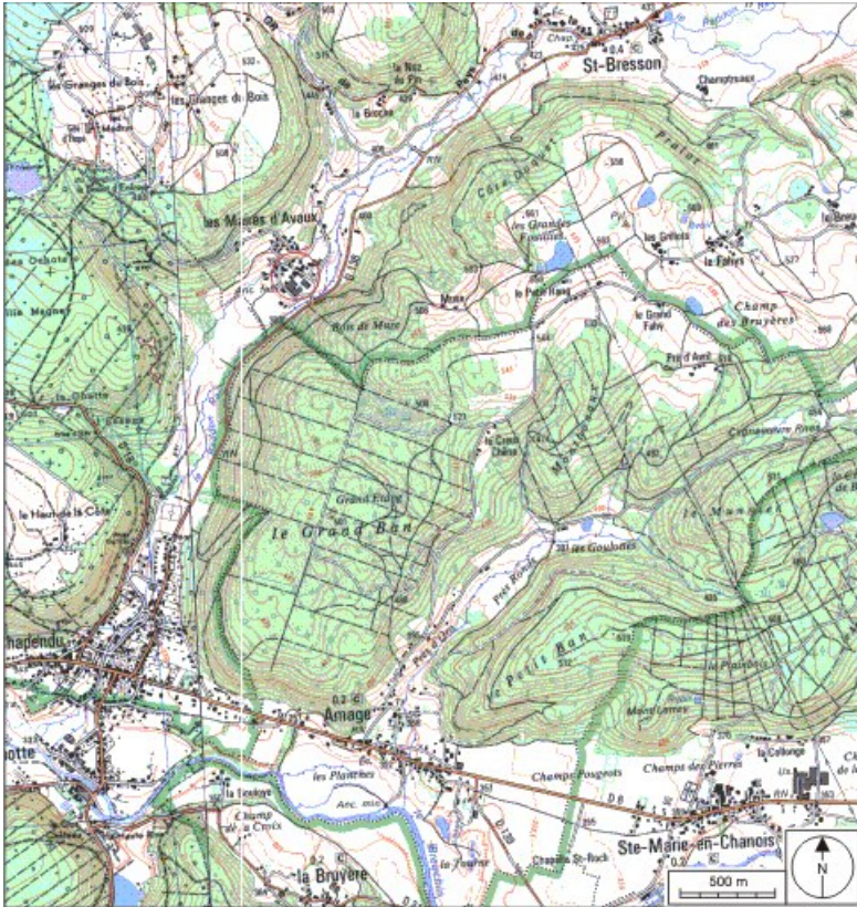
Carte de localisation. Carte topographique au 1:25000, I.G.N., Mélisey, 3520 O. SCAN 25, Licence n°2008CISE29-68. 70, Saint-Bresson, lieudit : les Maires d'Avaux