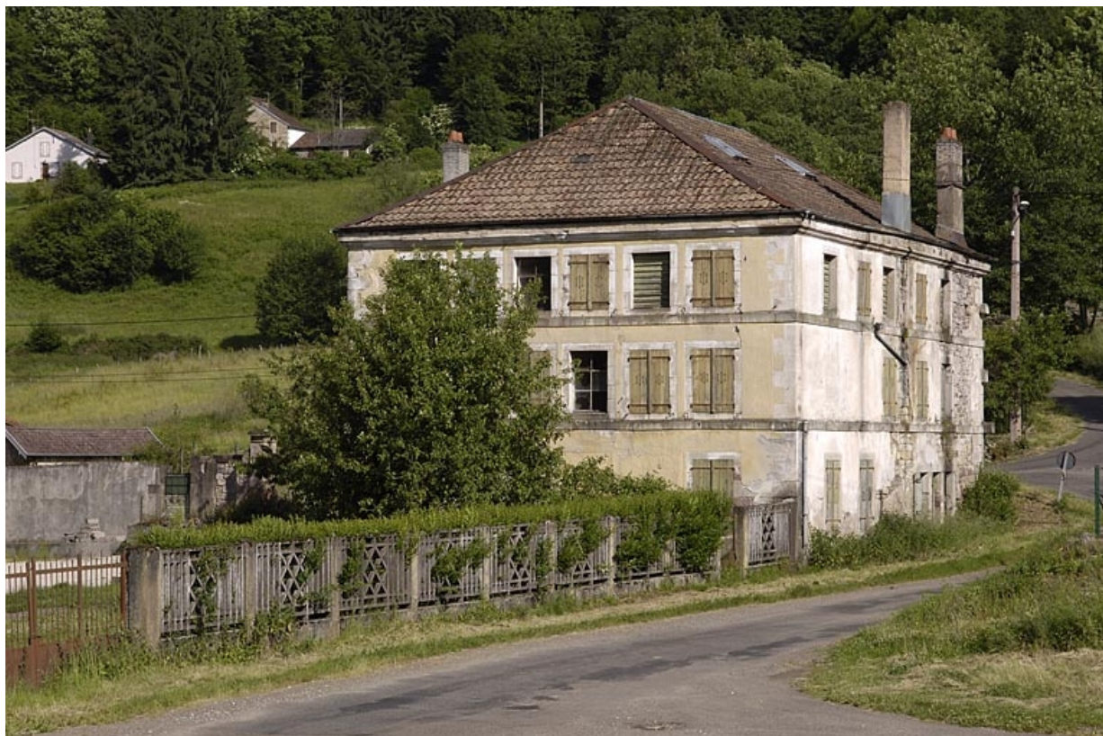
Ancien logement ouvrier vu depuis le sud-est.

70, Saint-Bresson, lieudit : les Maires d'Avaux