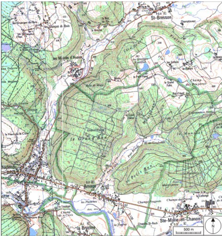
Carte de localisation. Carte topographique au 1:25000, I.G.N., Mélisey, 3520 O. 70, Saint-Bresson, lieudit : les Maires d'Avaux