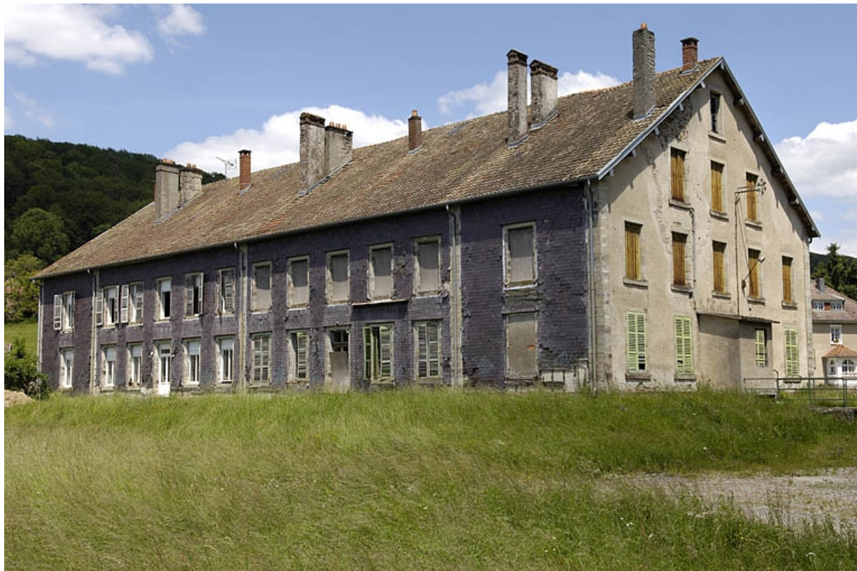
Façade ouest de l'ancien logement patronal, devenu logement ouvrier. 70, Saint-Bresson, lieudit : les Maires d'Avaux