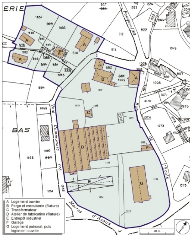
Plan-masse et de situation. Extrait du plan cadastral numérisé, 2005, section A, 1:1250. 70, Saint-Bresson, lieu-dit : les Maires d'Avaux