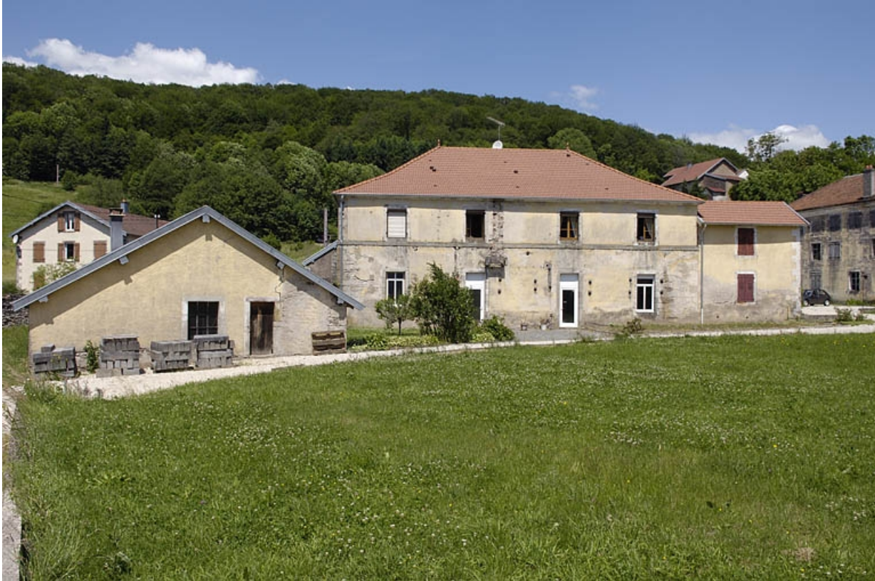
Ancienne menuiserie et forge de la filature.

70, Saint-Bresson, lieudit : les Maires d'Avaux