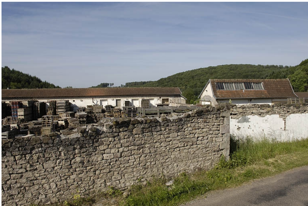
Vue des ateliers de filature depuis le nord. 70, Saint-Bresson, lieudit : les Maires d'Avaux