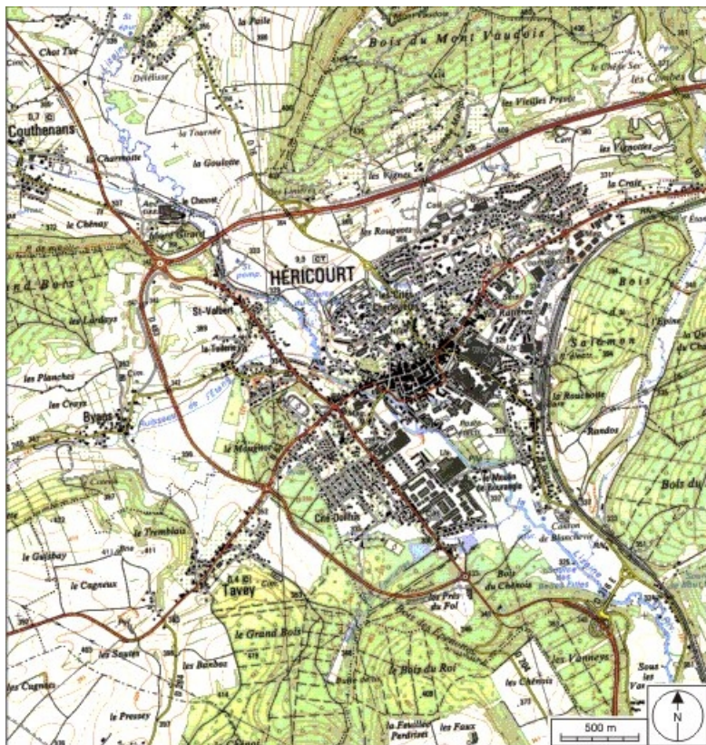
Carte de localisation. Carte topographique au 1:25000, I.G.N., Belfort, 3621 OT. 70, Héricourt, 42 avenue Léon Jouhaux