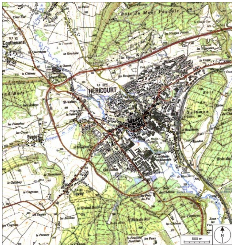
Carte de localisation. Carte topographique au 1:25000, I.G.N., Belfort, 3621 OT. 70, Héricourt, 42 avenue Léon Jouhaux