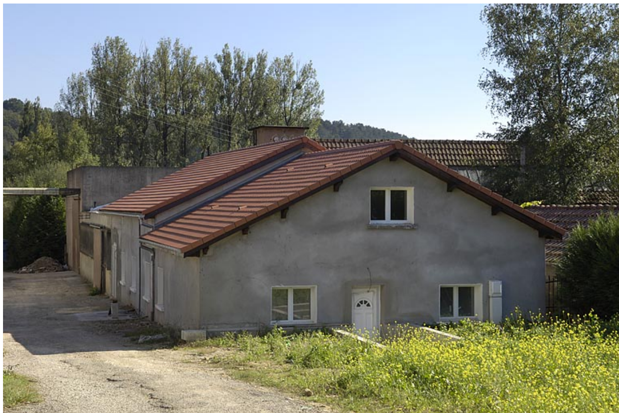
Vue d'ensemble depuis l'entrée.