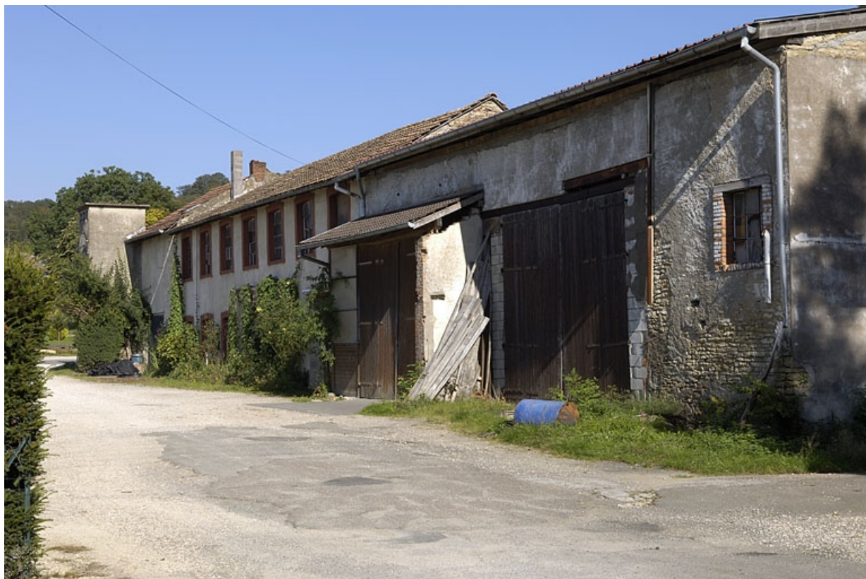
Atelier de boissellerie vu depuis la rue.