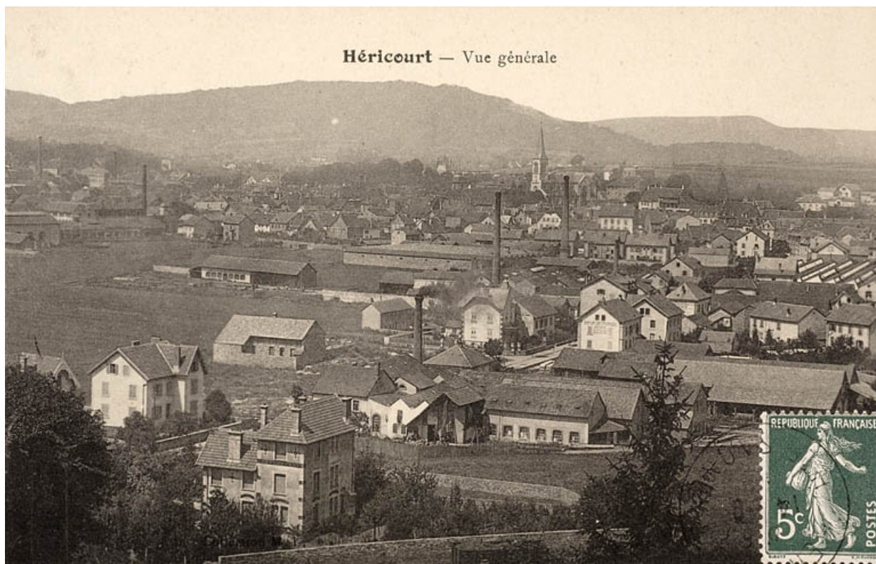
Héricourt - Vue générale.