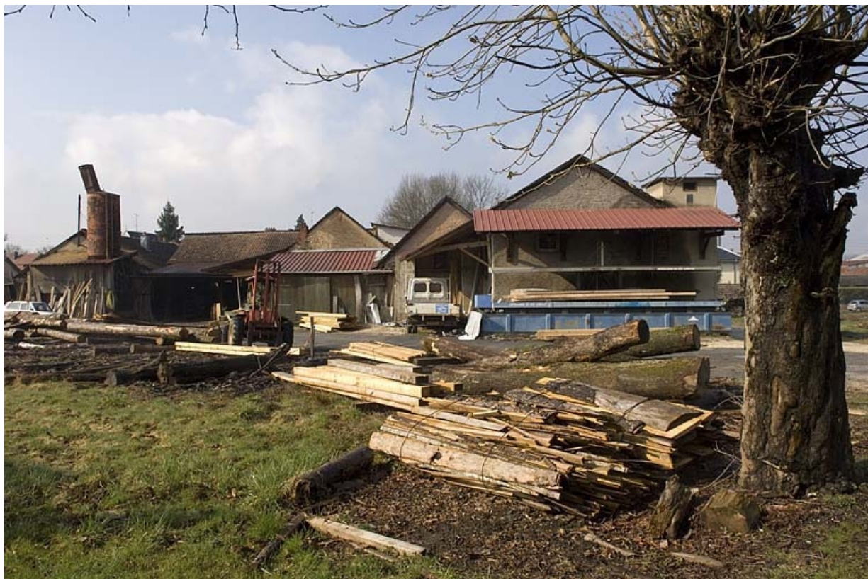
Vue d'ensemble depuis le nord.