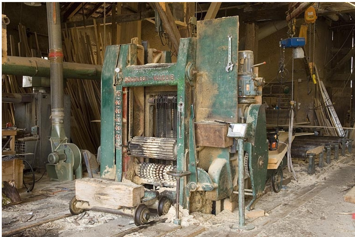
Scie à châssis multilames verticales dite déligneuse Socolest.