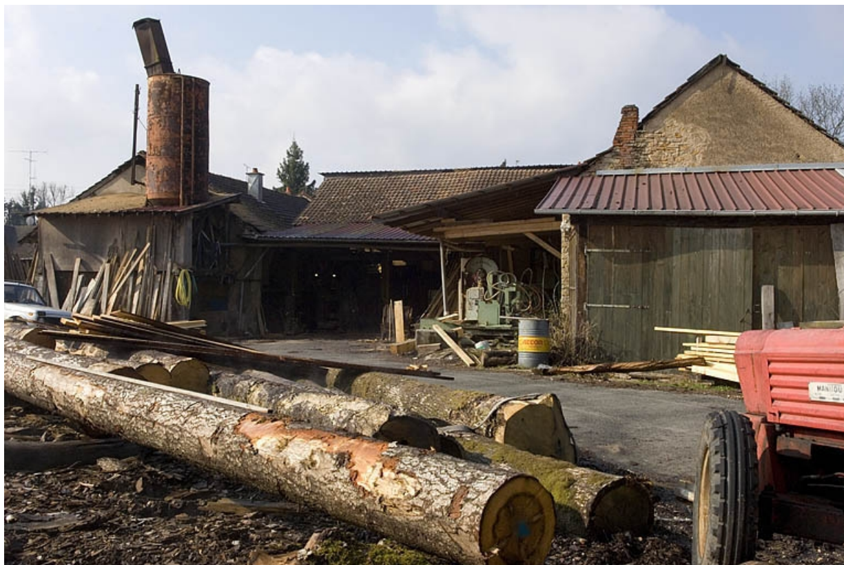
Façade postérieure de l'atelier de scierie. 70, Héricourt, 49 à 53 rue Jean Jaurès