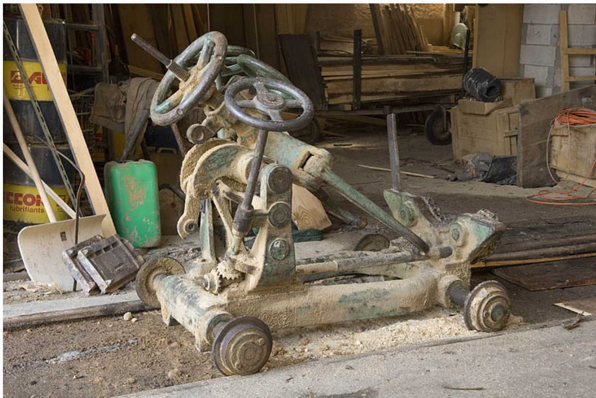
Chariot porte-grumes de la scie déligneuse Socolest.