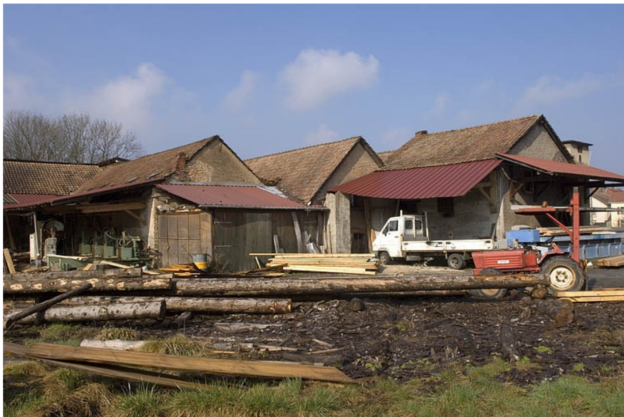
Ateliers de scierie et de boissellerie depuis le parc à grumes.