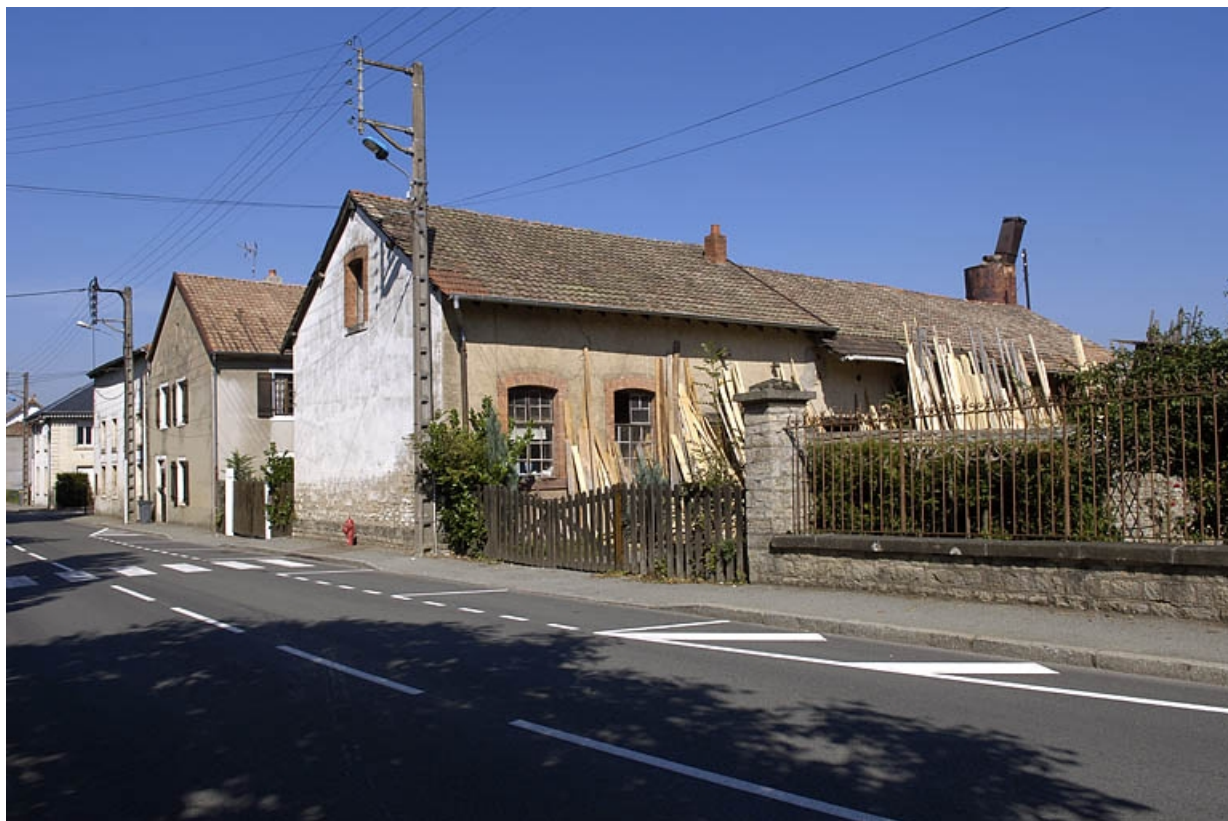
Vue d'ensemble depuis le sud-est.