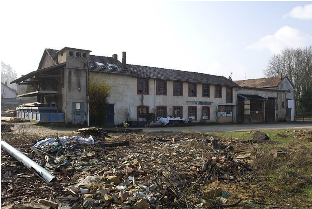
Vue d'ensemble depuis le nord-est.