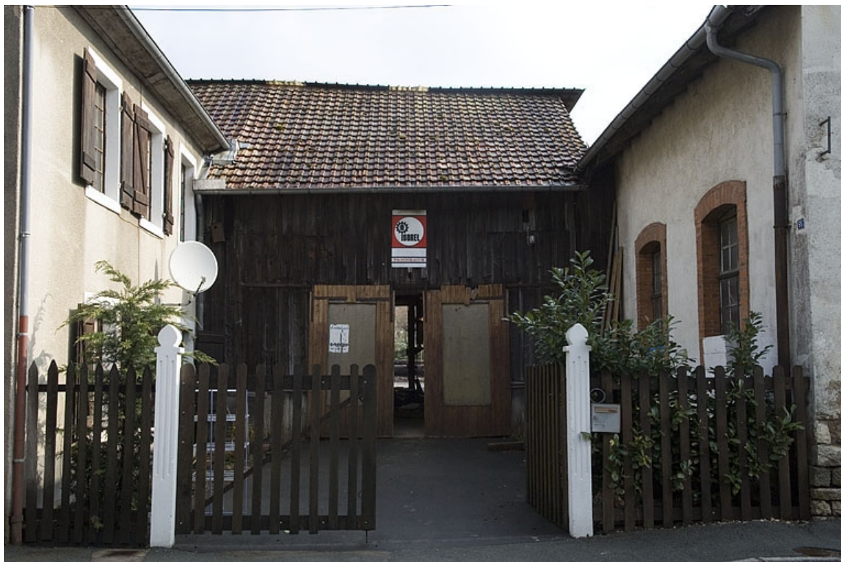
Façade antérieure de l'atelier de scierie.