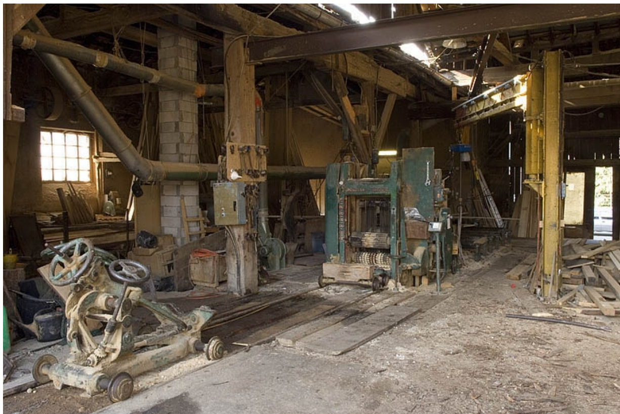
Vue intérieure de l'atelier de scierie.