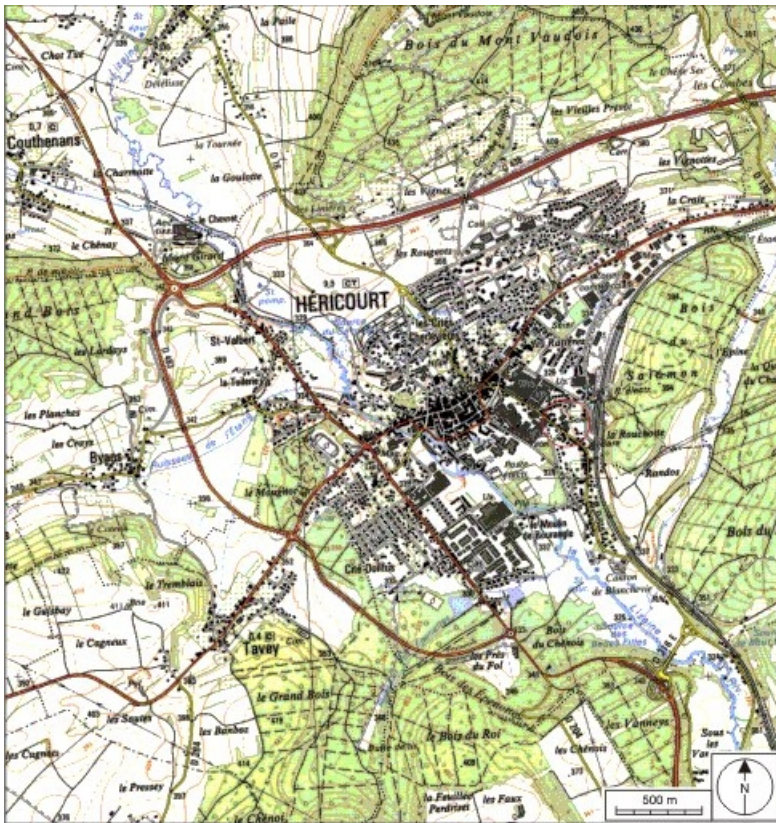
Carte de localisation. Carte topographique au 1:25000, I.G.N., Belfort, 3621 OT. 70, Héricourt, 49 à 53 rue Jean Jaurès