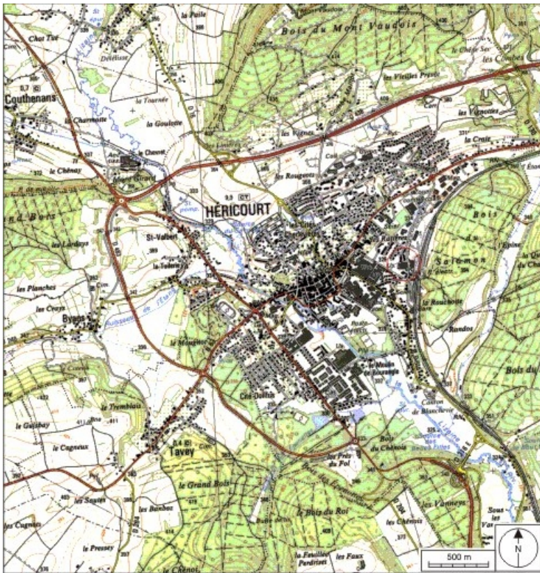
Carte de localisation. Carte topographique au 1:25000, I.G.N., Belfort, 3621 OT. 70, Héricourt, 19 rue Marcel Paul