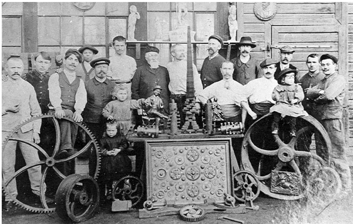
Personnel de la société Cuvier (?). 70, Héricourt, 19 rue Marcel Paul