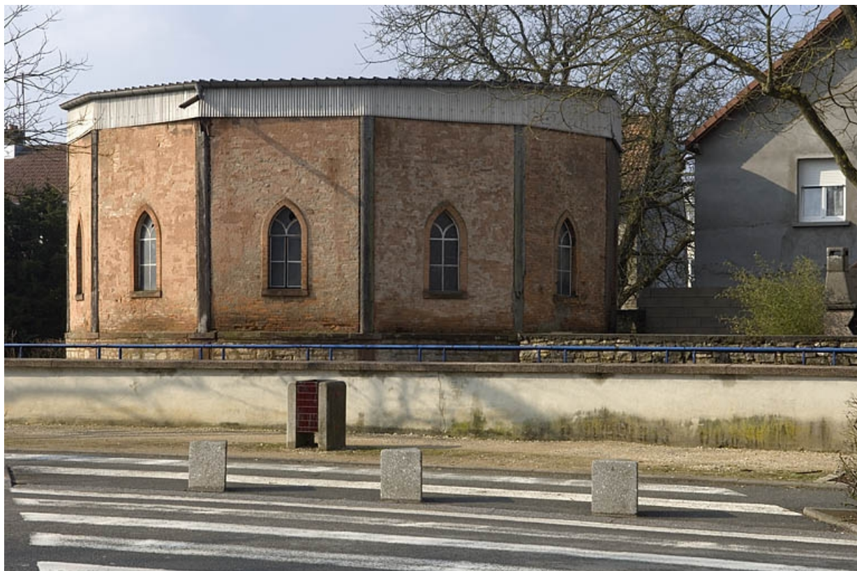
Vue rapprochée depuis le nord-est.