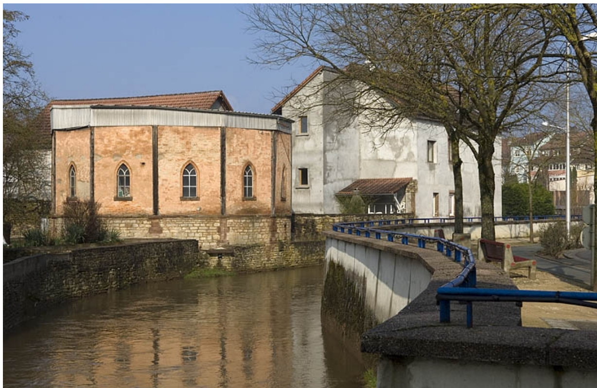
Vue d'ensemble en aval de la Lizaine.