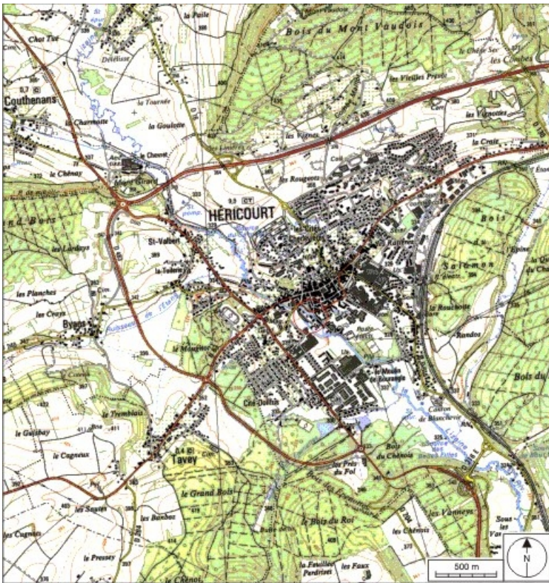
Carte de localisation. Carte topographique au 1:25000, I.G.N., Belfort, 3621 OT. 70, Héricourt, 3 impasse du Breuil