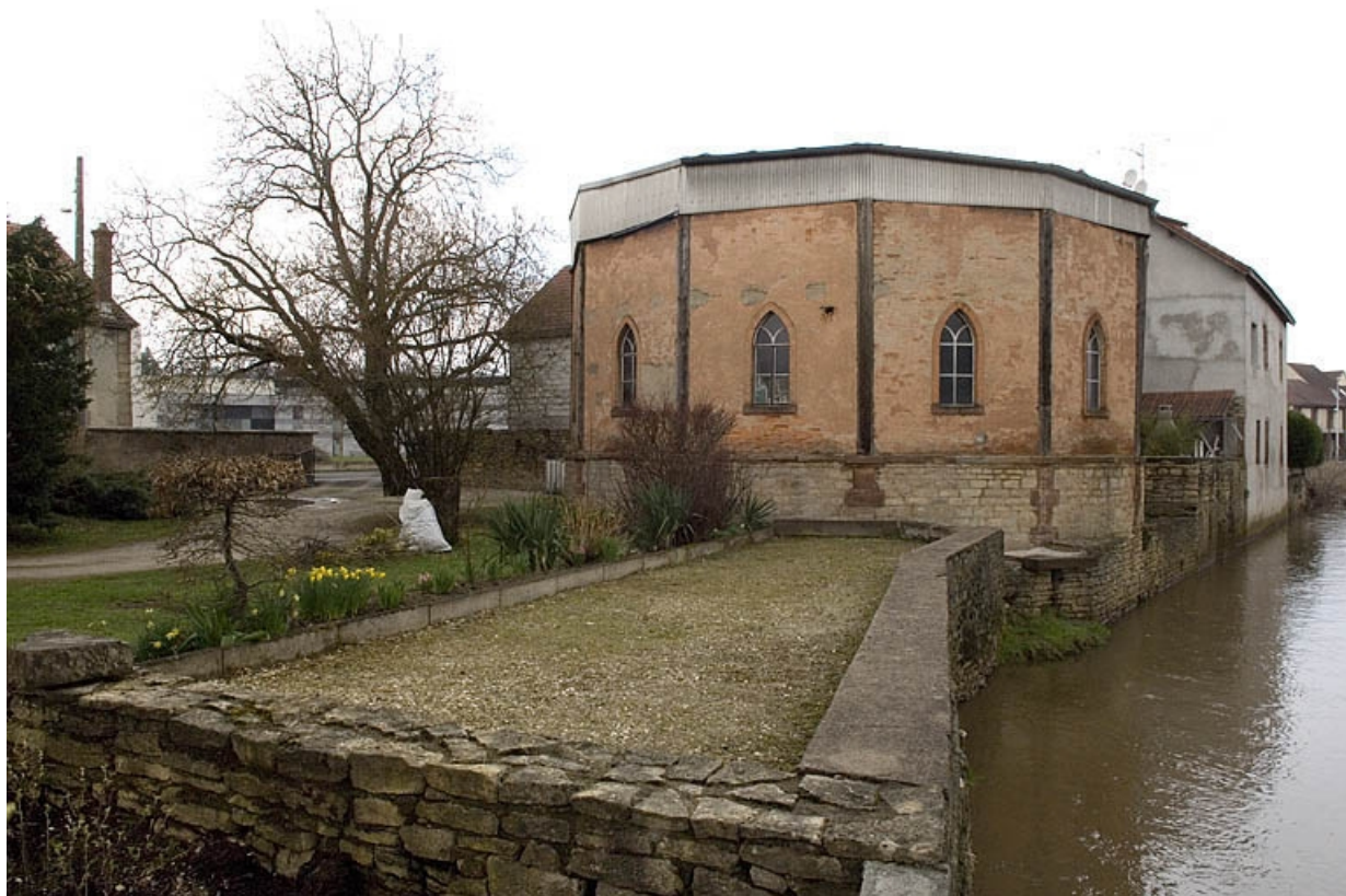
Vue depuis l'est.