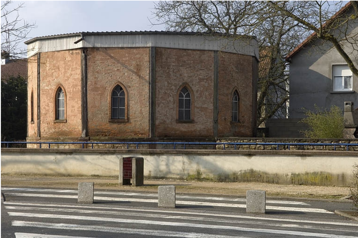
Vue rapprochée depuis le nord-est.