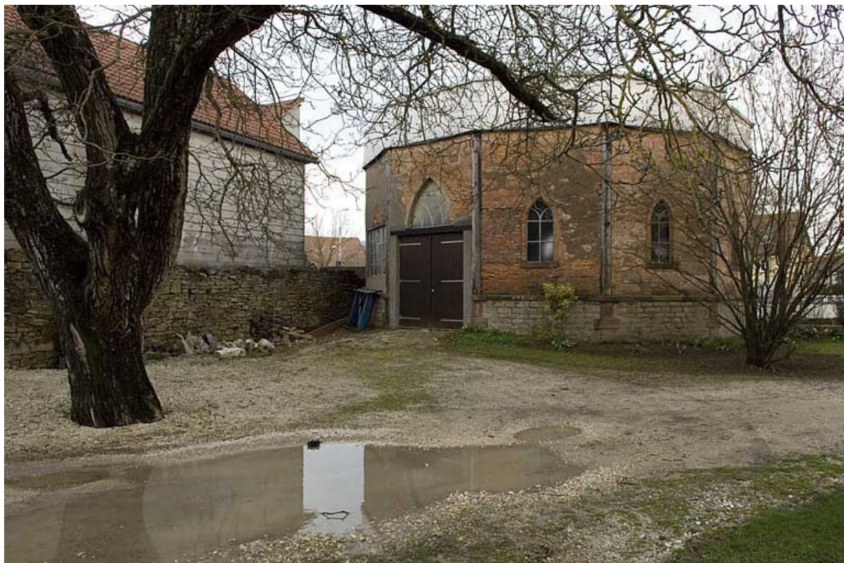
Vue depuis l'entrée.