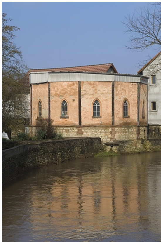
Vue depuis le sud-est.