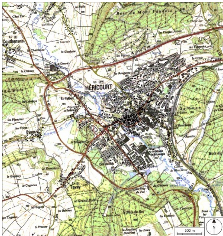
Carte de localisation. Carte topographique au 1:25000, I.G.N., Belfort, 3621 OT. 70, Héricourt, 2 faubourg de Besançon