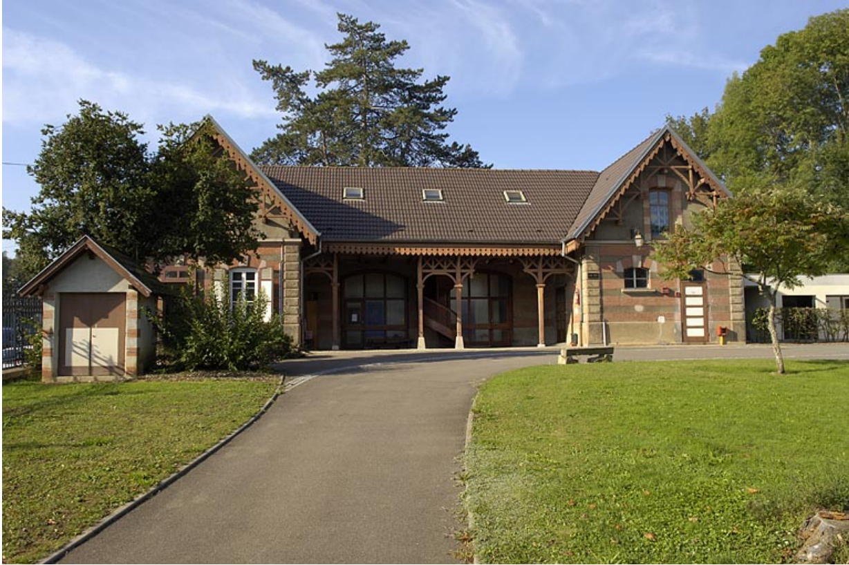
Façade nord de l'ancienne écurie (?).