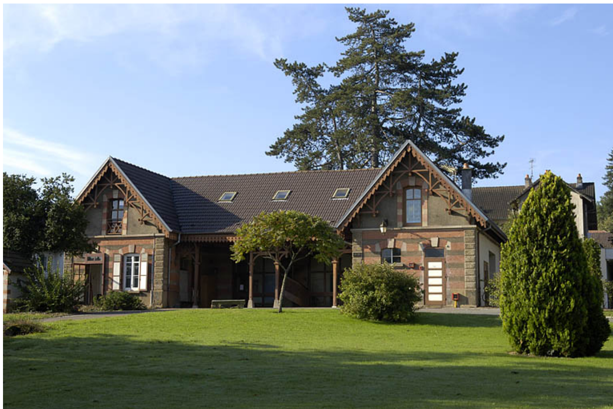
Vue d'ensemble de l'ancienne écurie (?). 70, Héricourt, 2 faubourg de Besançon