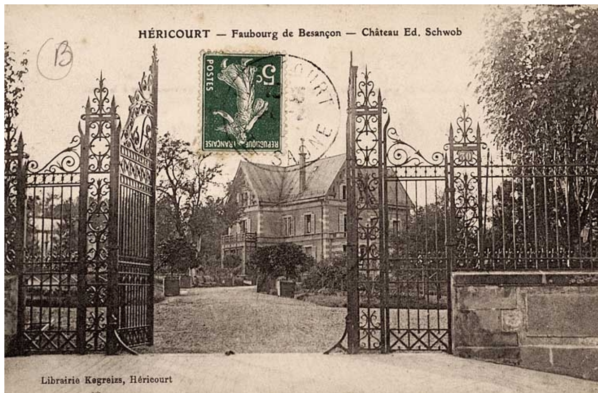
Héricourt - Faubourg de Besançon, château Ed. Schwob. 70, Héricourt, 2 faubourg de Besançon