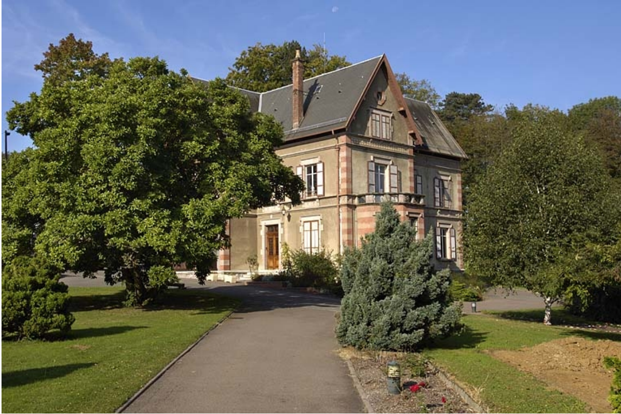
Vue de trois quarts depuis l'allée d'entrée.