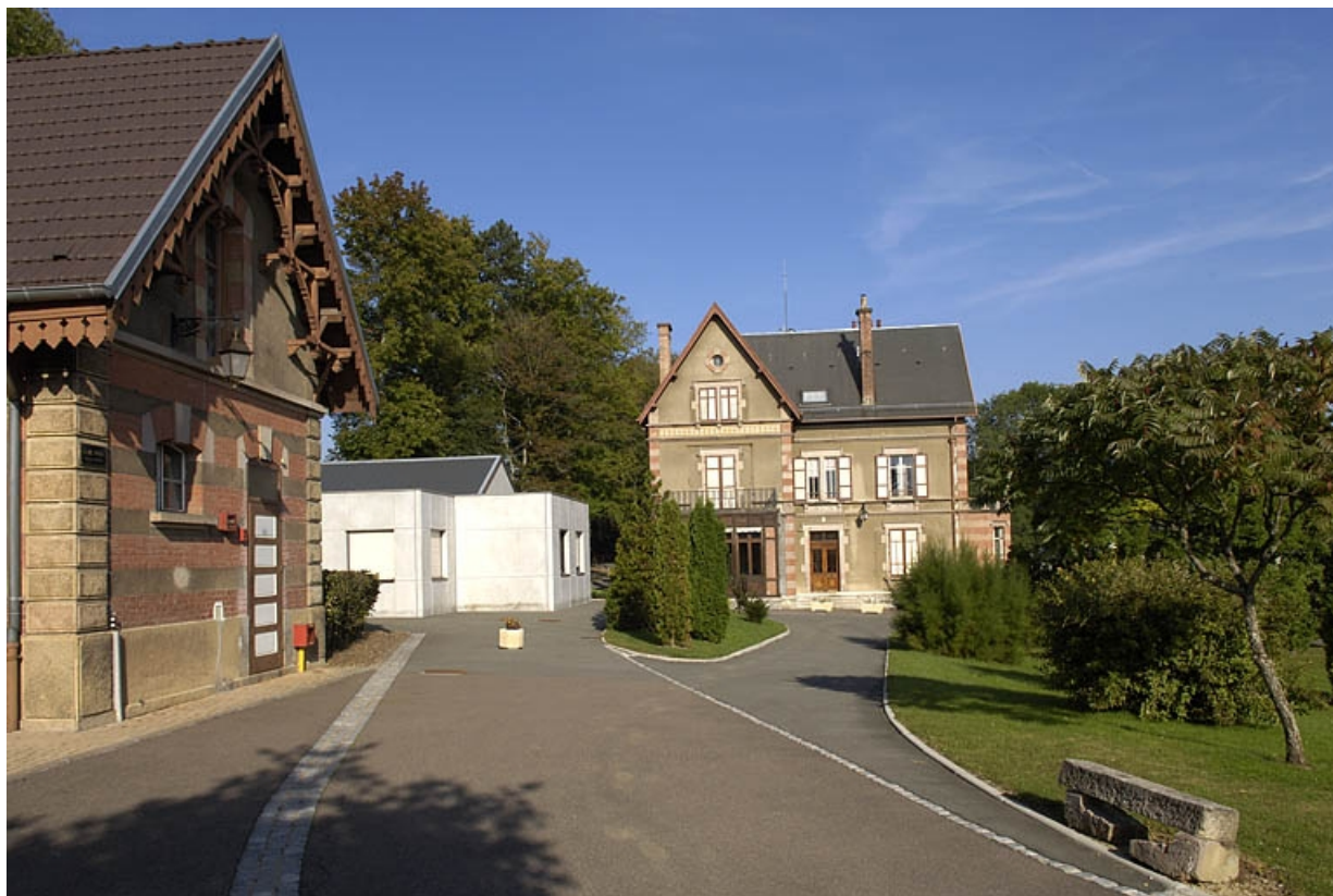
Vue d'ensemble depuis le nord-est. 70, Héricourt, 2 faubourg de Besançon