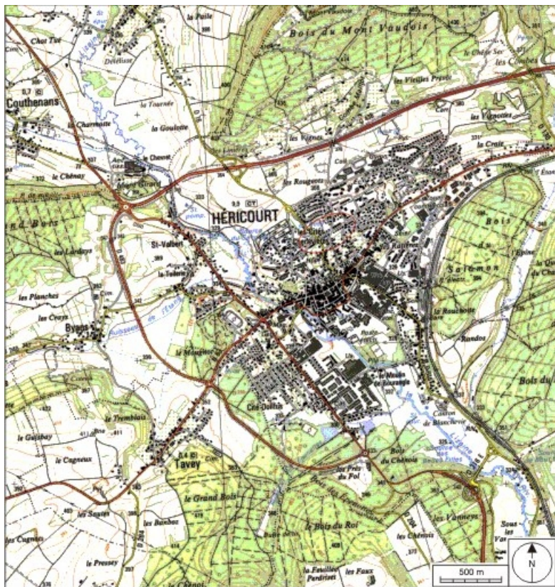
Carte de localisation. Carte topographique au 1:25000, I.G.N., Belfort, 3621 OT. 70, Héricourt rue Bel Air