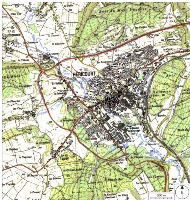
Carte de localisation. Carte topographique au 1:25000, I.G.N., Belfort, 3621 OT. 70, Héricourt rue Bel Air