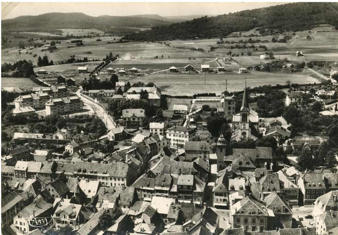
La cité ouvrière en construction (au second plan). 70, Héricourt rue Bel Air