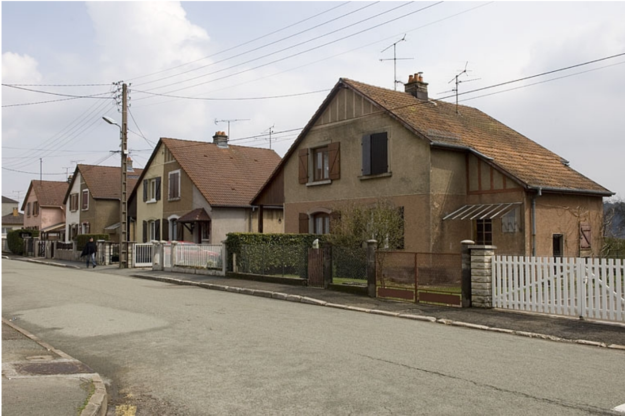
Alignement de quatre maisons (côté pair). 70, Héricourt rue Bel Air