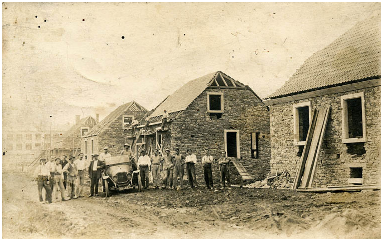
La cité ouvrière des Polones en construction.