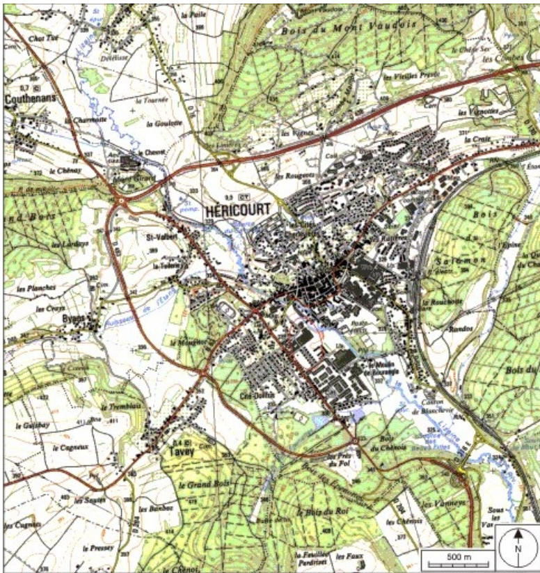
Carte de localisation. Carte topographique au 1:25000, I.G.N., Belfort, 3621 OT. 70, Héricourt rue de la 1 à 13 Tuilerie