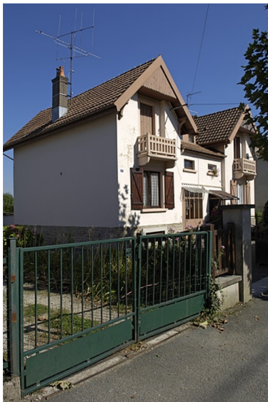
Logement ouvrier double faubourg de Montbéliard. 70, Héricourt rue de la 1 à 13 Tuilerie