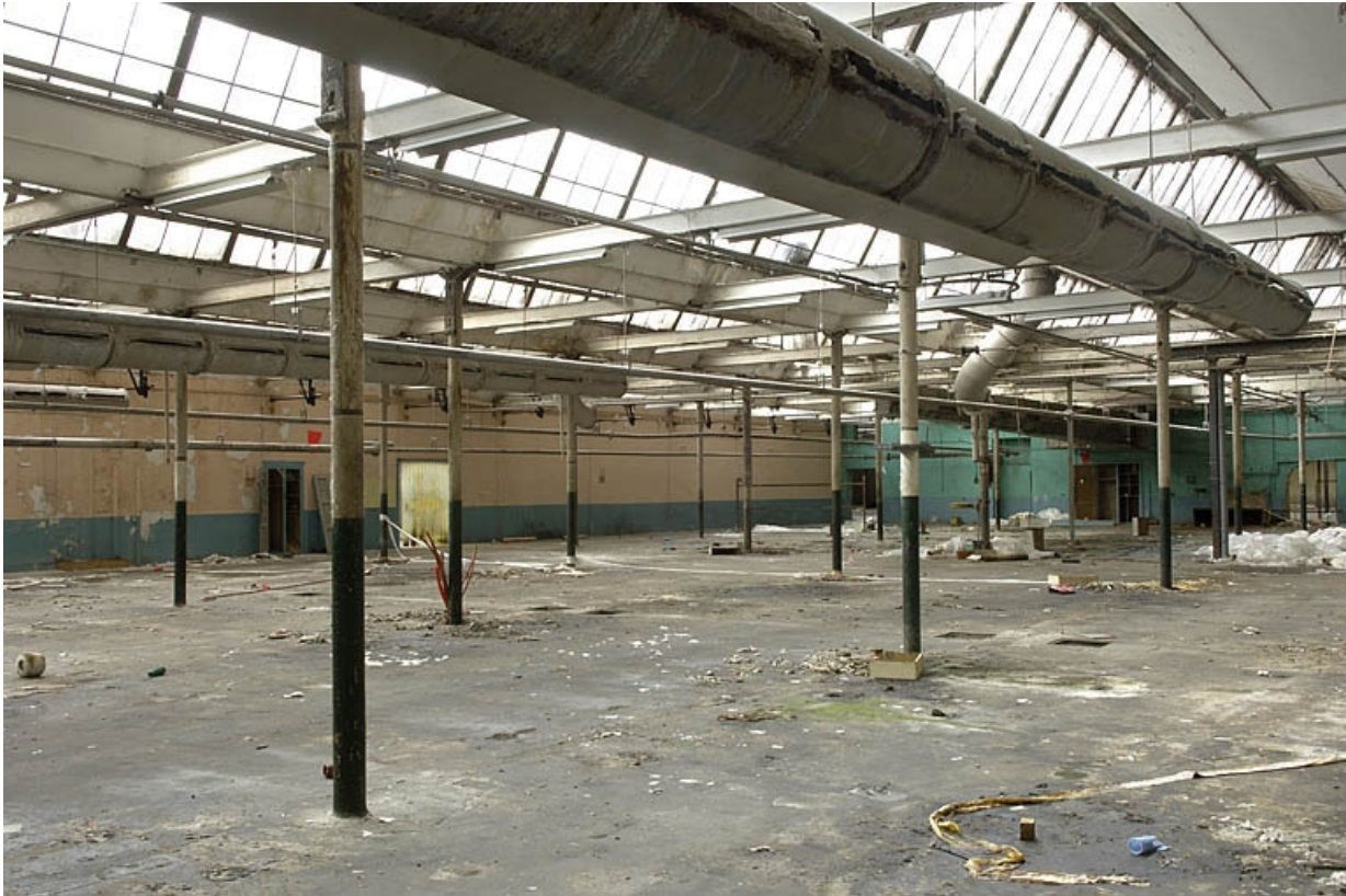
Extension est de la salle de tissage. Détail des structures.