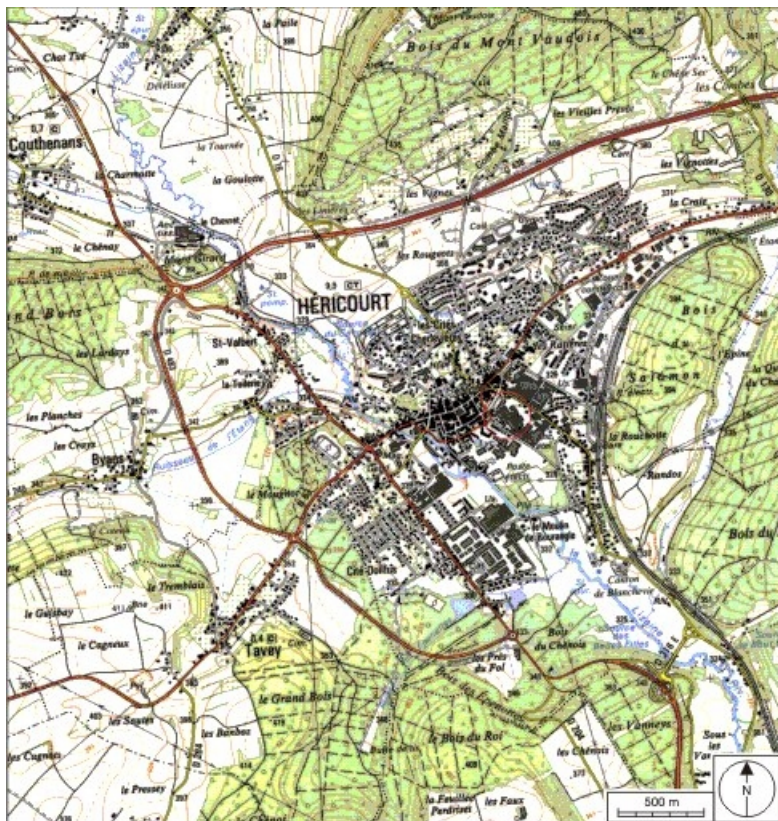
Carte de localisation. Carte topographique au 1:25000, I.G.N., Belfort, 3621 OT. 70, Héricourt, 5, 7 rue du 11 novembre