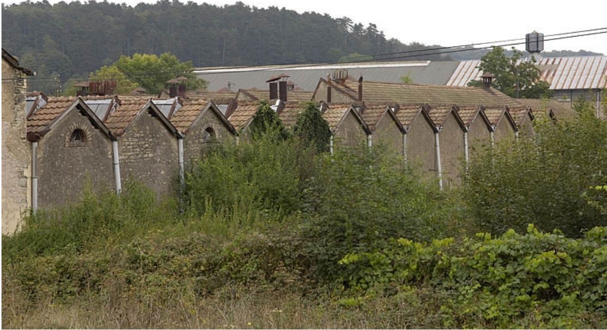
Murs-pignons sud de la salle de tissage.