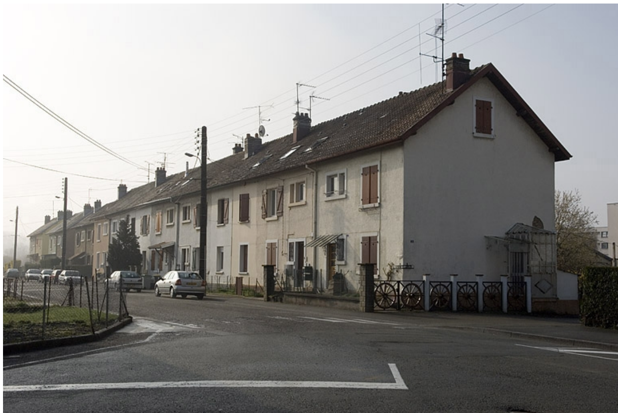
Logements ouvriers rue Paul Vinot.