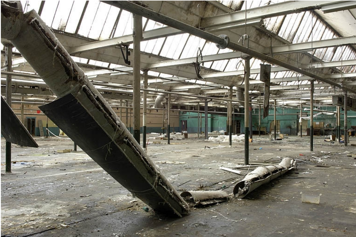
Extension est de la salle de tissage. Charpente métallique et sheds. 70, Héricourt, 5, 7 rue du 11 novembre