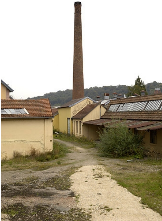
Atelier et cheminée depuis l'entrée.