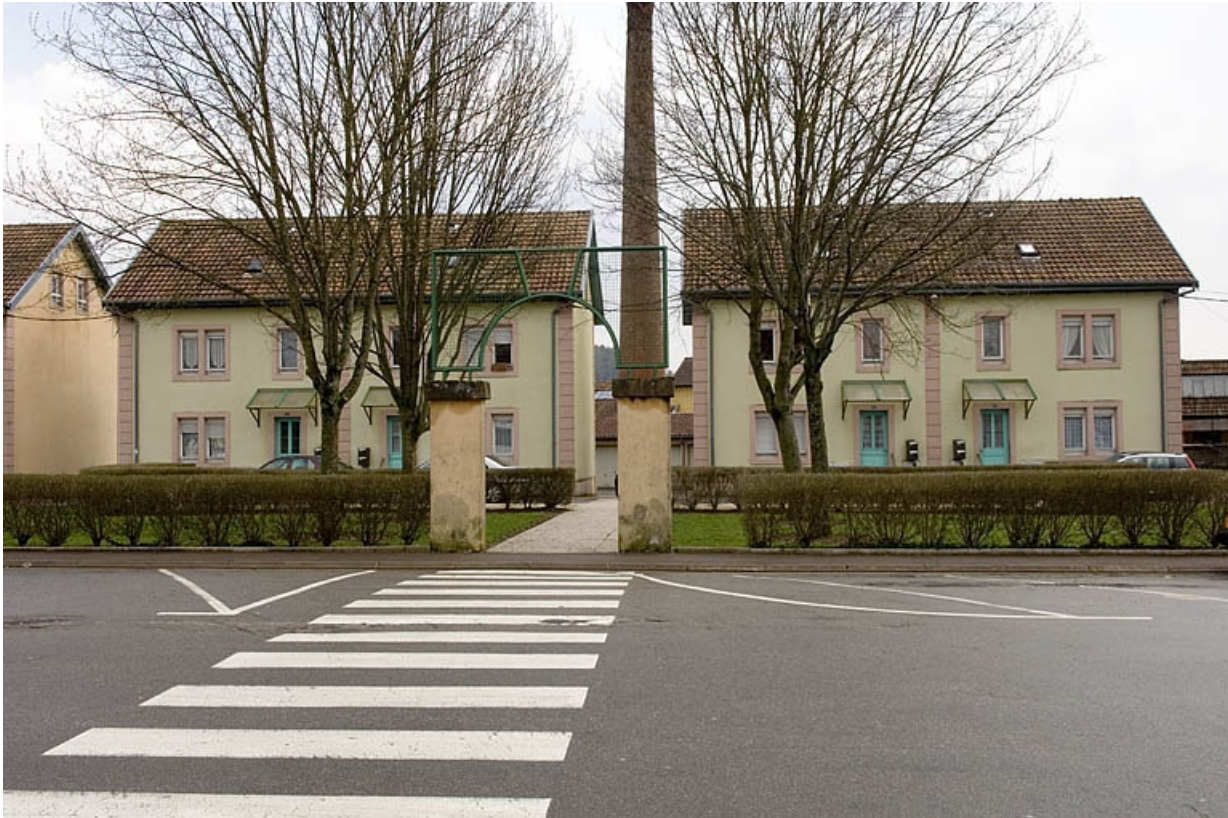
Deux maisons ouvrières de la cité Tournesac.