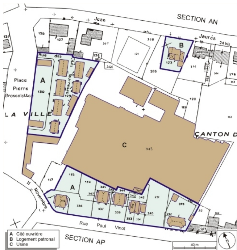
Plan de situation. Extrait du plan cadastral numérisé, 2005, section AO, 1:1000 réduit à 1:1250. 70, Héricourt, 5, 7 rue du 11 novembre