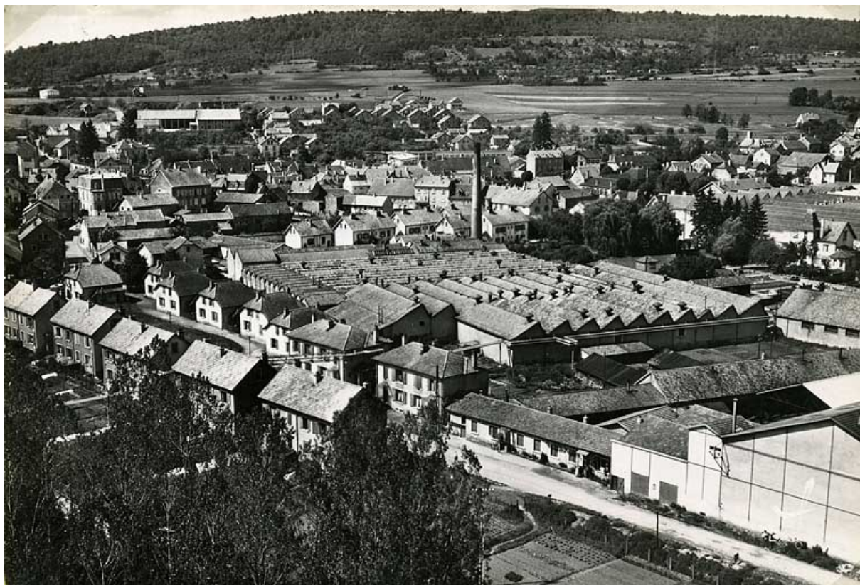
Vue aérienne depuis le sud-ouest.