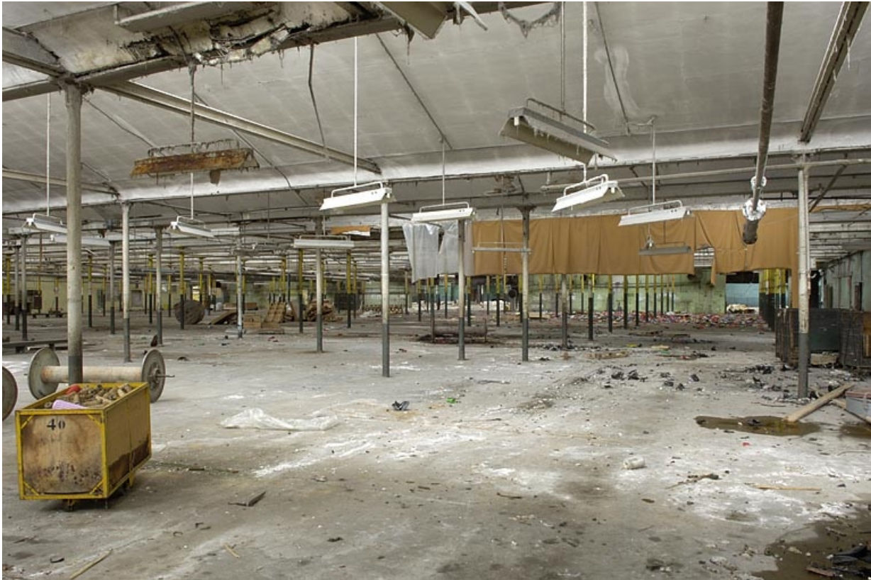
Salle de tissage. Vue d'ensemble depuis l'entrée.