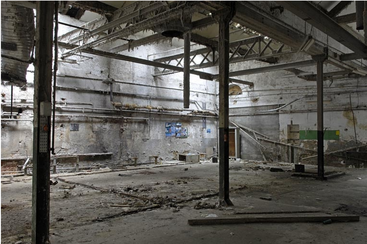
Ancienne salle des machines (?).