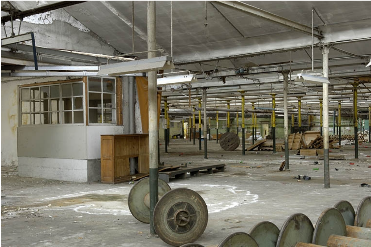
Cabine située à l'entrée de la salle de tissage.