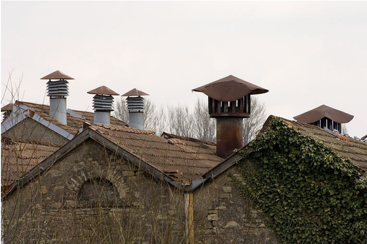
Cheminées métalliques de la salle de tissage.