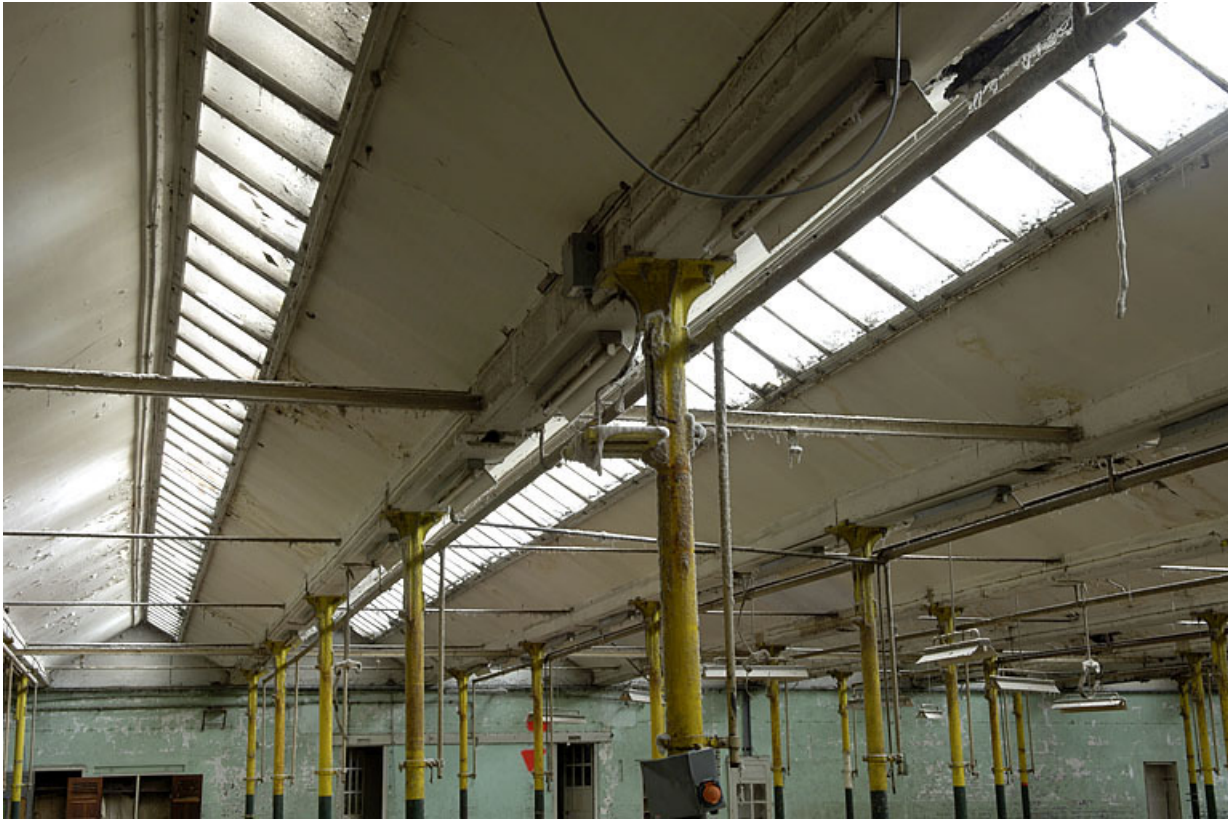
Salle de tissage. Détail des sheds.