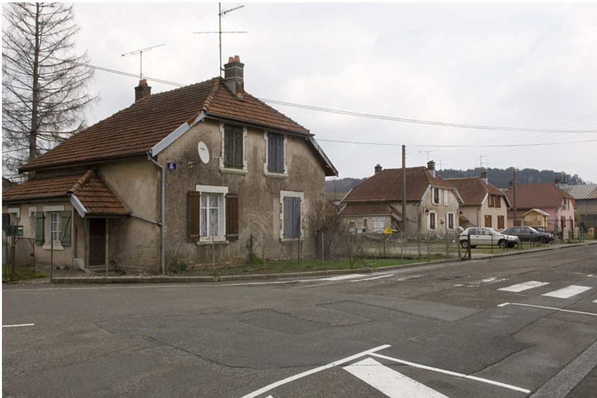
Logements ouvriers doubles rue Paul Vinot.