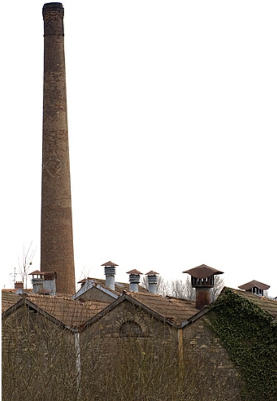
Cheminée et toitures de la salle de tissage.