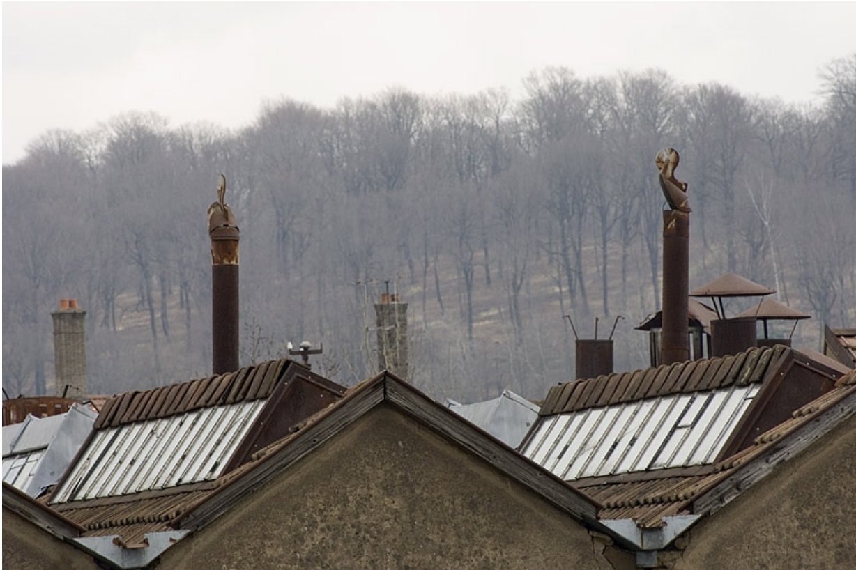
Détail des toitures et des cheminées métalliques.