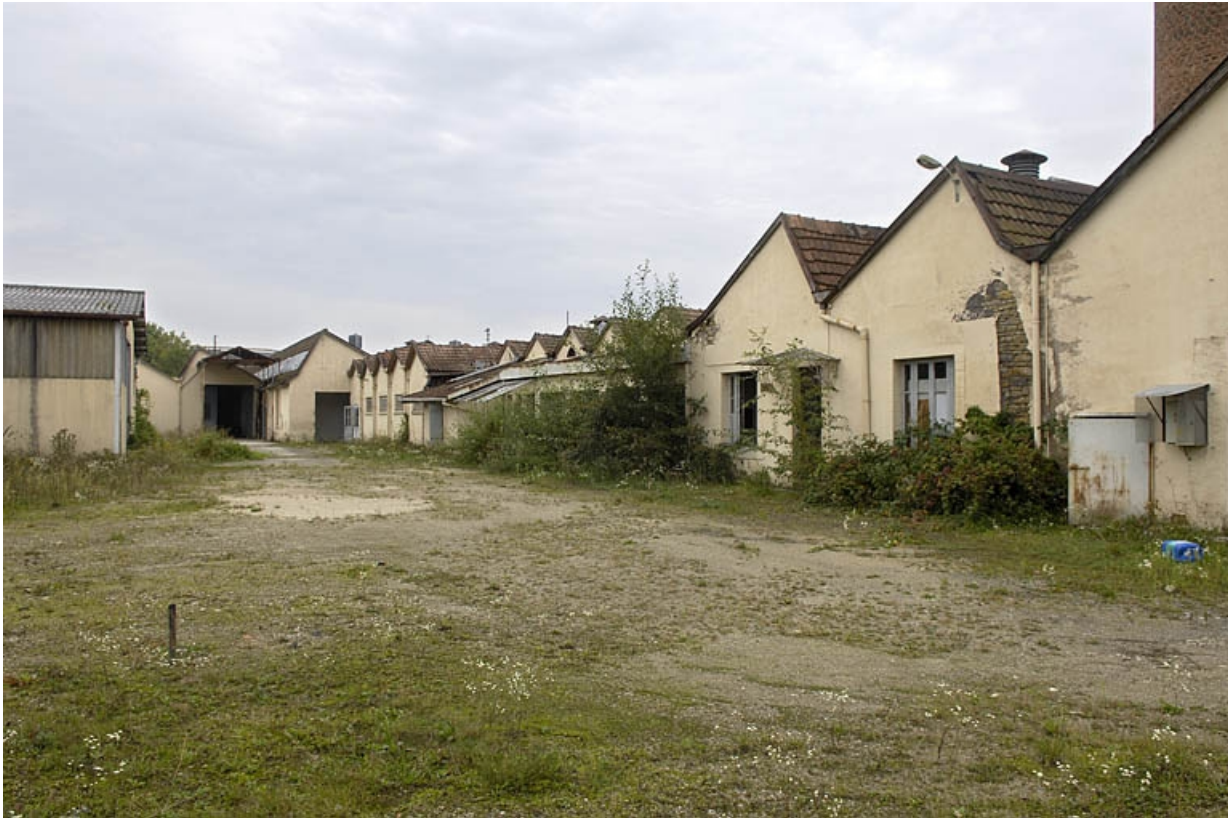
Murs-pignons nord de la salle de tissage.