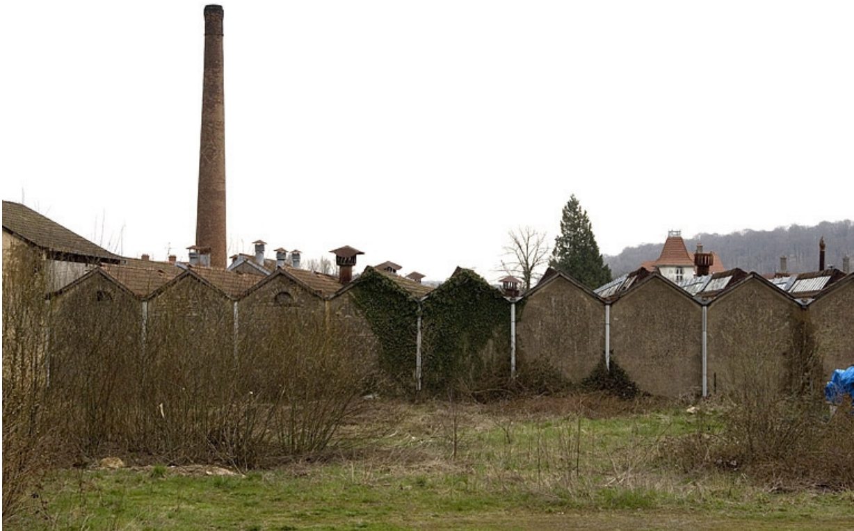
Cheminée et murs-pignons de la salle de tissage.