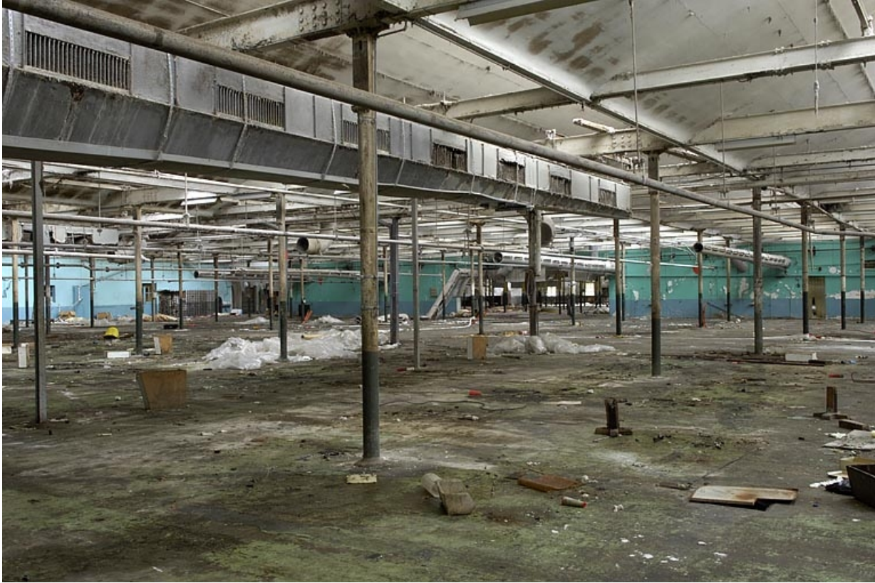
Extension est de la salle de tissage. Vue depuis l'est.