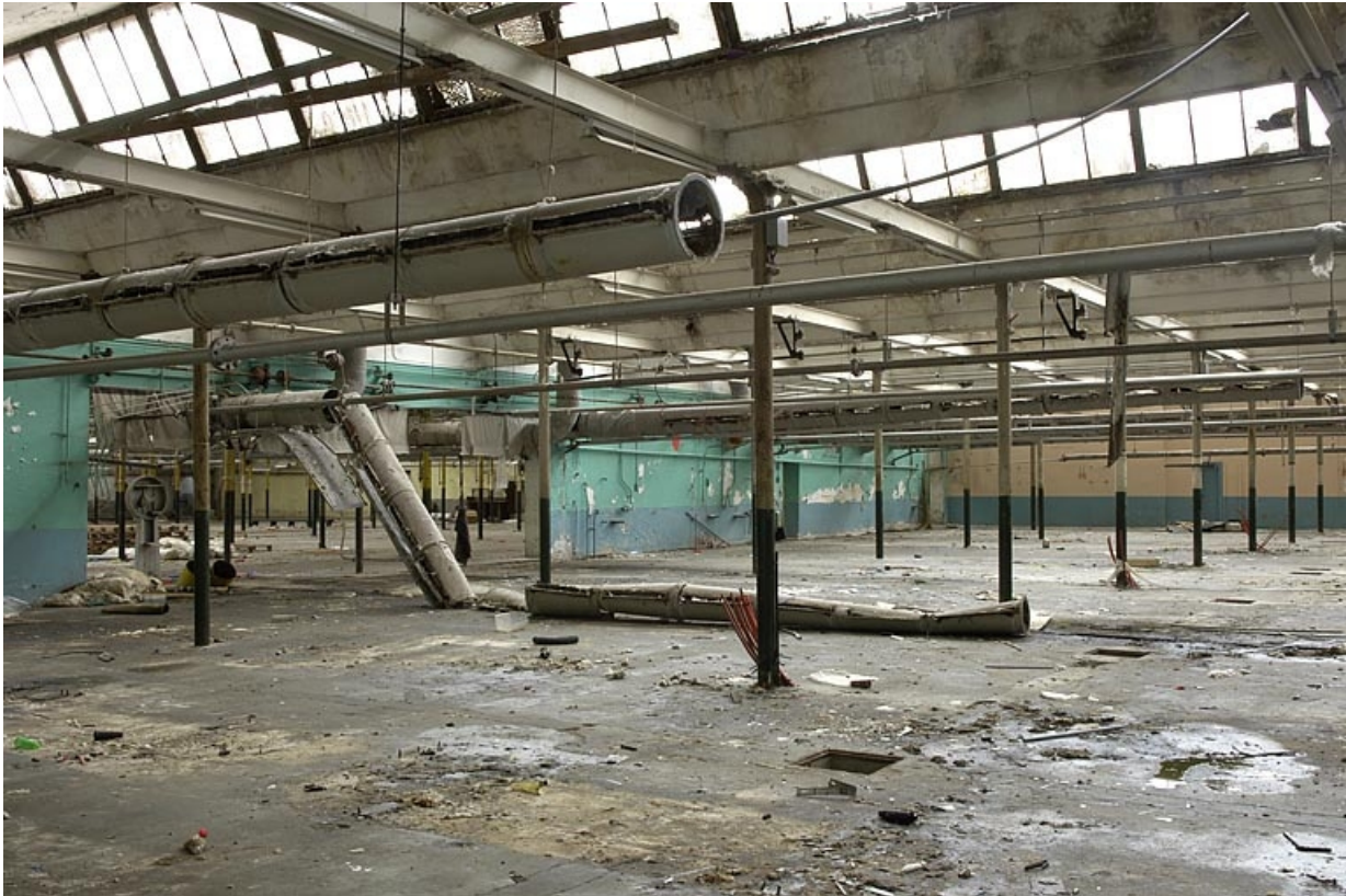
Extension est de la salle de tissage. Vue depuis le sud.