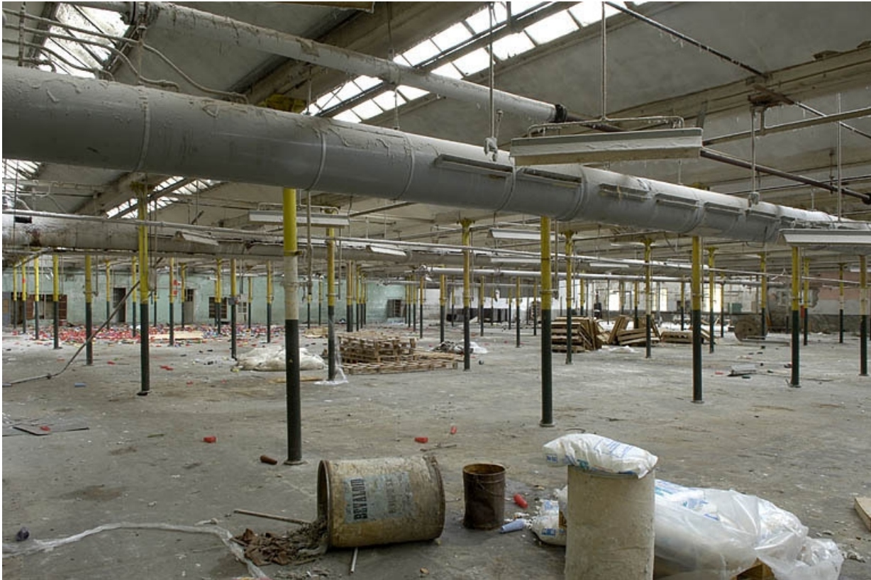
Salle de tissage. Vue d'ensemble depuis le nord-est.