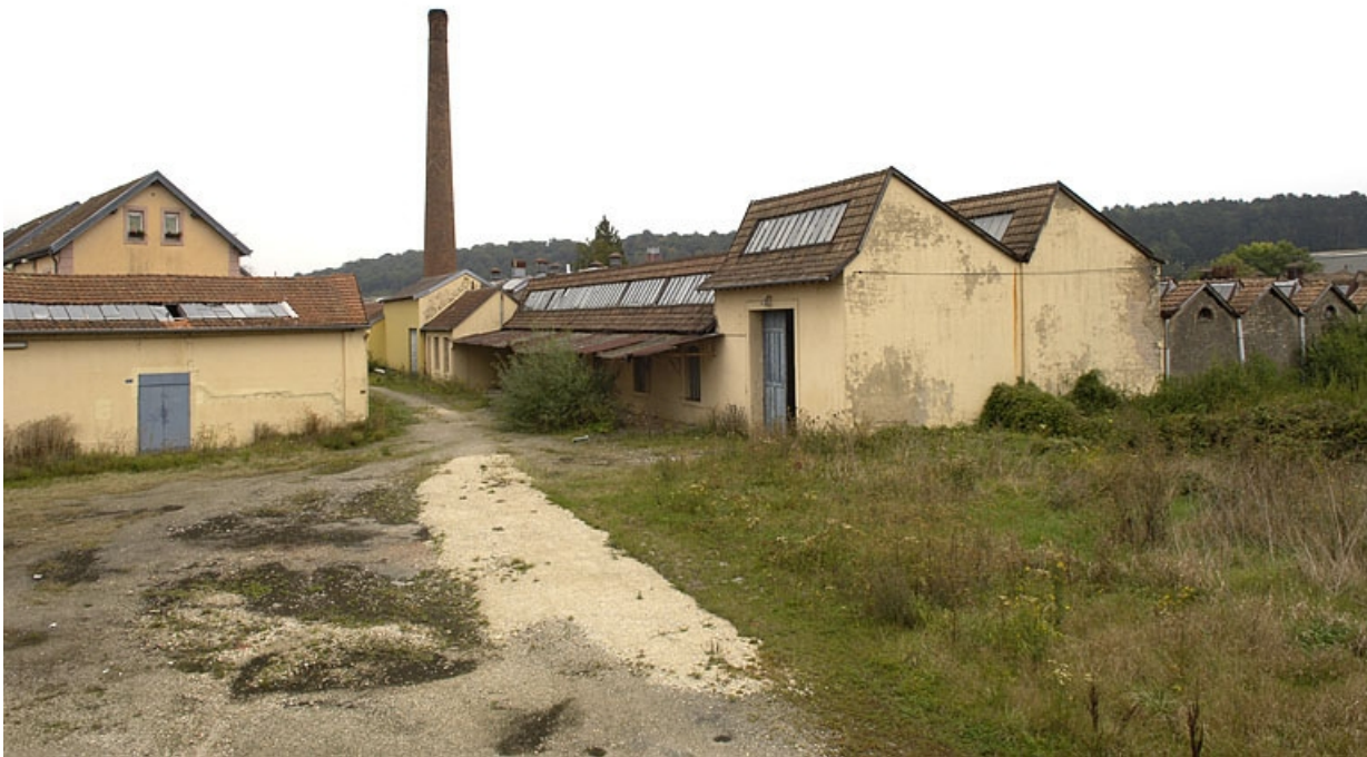
Vue d'ensemble depuis l'entrée.