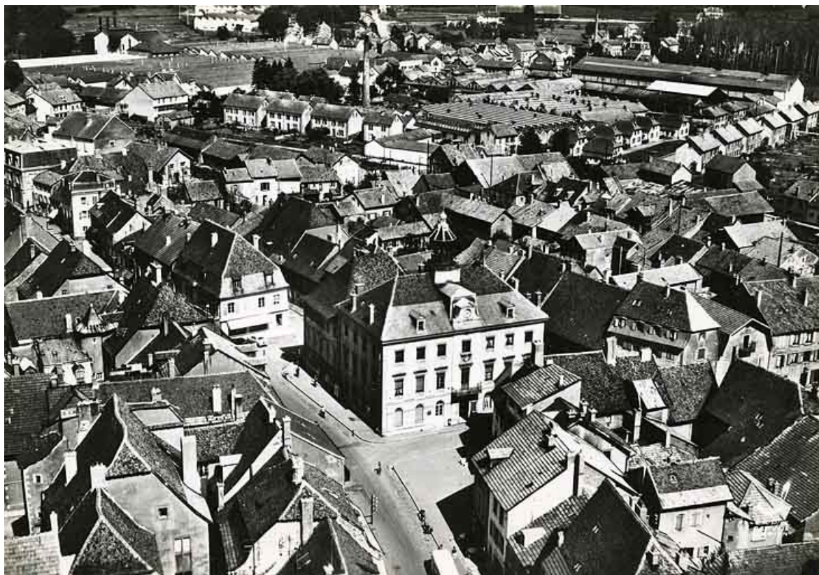
Vue aérienne depuis le nord-ouest.