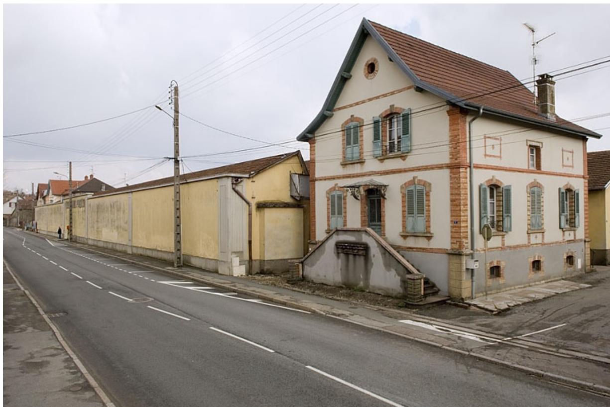
Alignement sur l'avenue Jean Jaurès de l'atelier de tissage et du logement d'entrée. 70, Héricourt rue Marcel Bardot