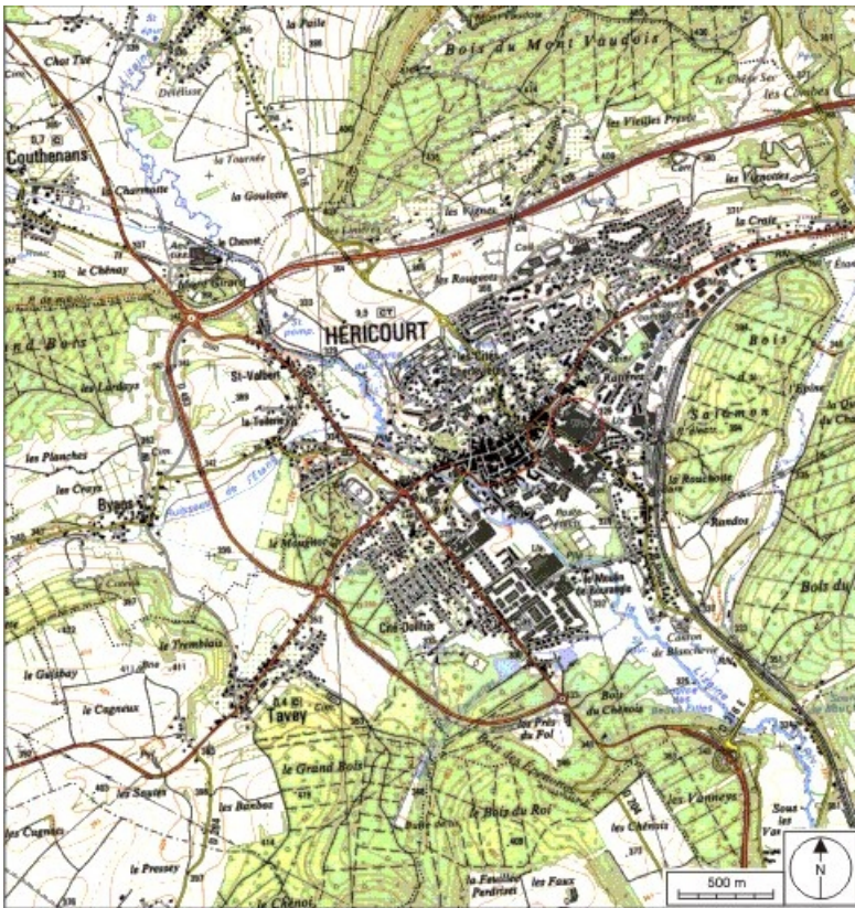
Carte de localisation. Carte topographique au 1:25000, I.G.N., Belfort, 3621 OT. SCAN 25, Licence n°2008CISE29-68. 70, Héricourt rue Marcel Bardot