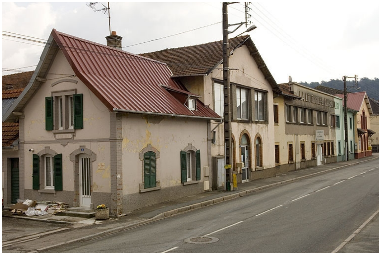
Façades sur l'avenue Jean Jaurès.