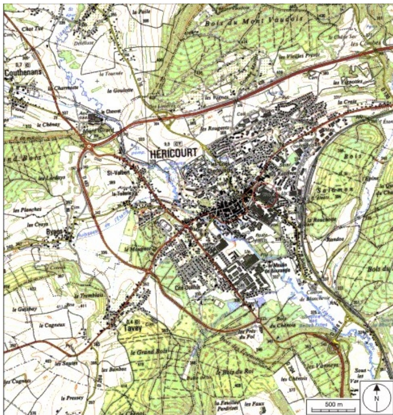
Carte de localisation. Carte topographique au 1:25000, I.G.N., Belfort, 3621 OT. 70, Héricourt rue Marcel Bardot