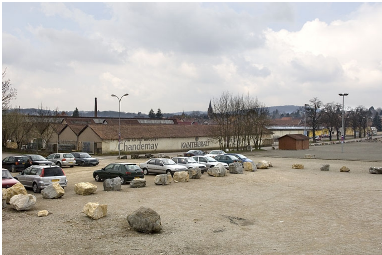
Vue d'ensemble depuis l'est. 70, Héricourt rue Marcel Bardot