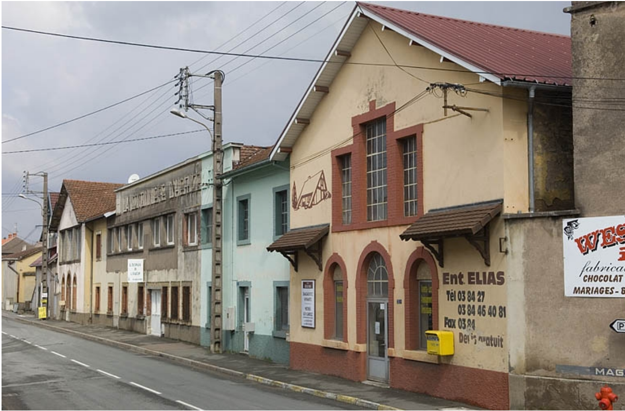
Façades sur l'avenue Jean Jaurès depuis le sud.