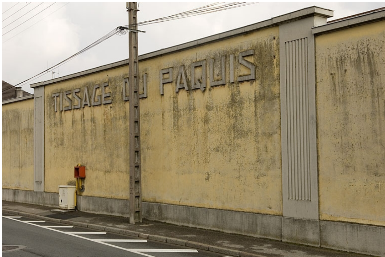
Frontispice Tissage du Paquis. 70, Héricourt rue Marcel Bardot