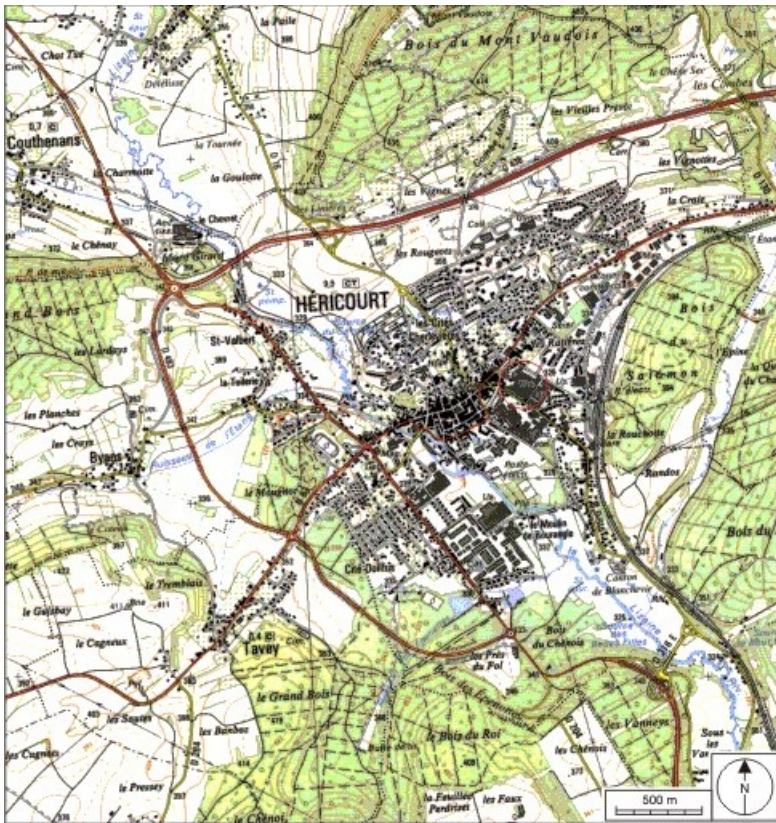
Carte de localisation. Carte topographique au 1:25000, I.G.N., Belfort, 3621 OT. 70, Héricourt rue Marcel Bardot