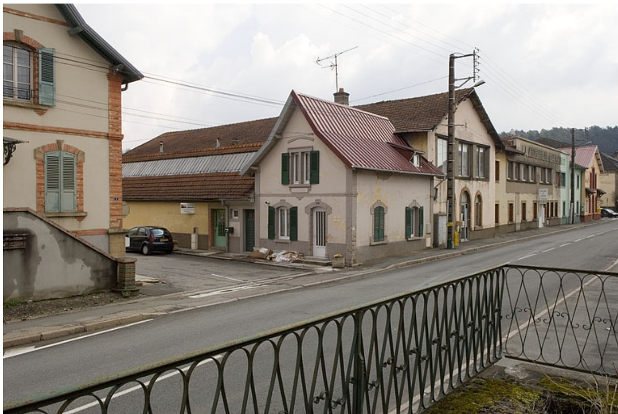
Alignements sur l'avenue Jean Jaurès des bâtiments est. 70, Héricourt rue Marcel Bardot