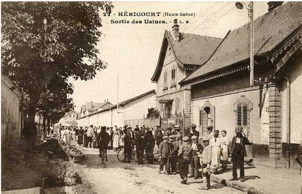
Héricourt (Haute-Saône) - Sortie des Usines.