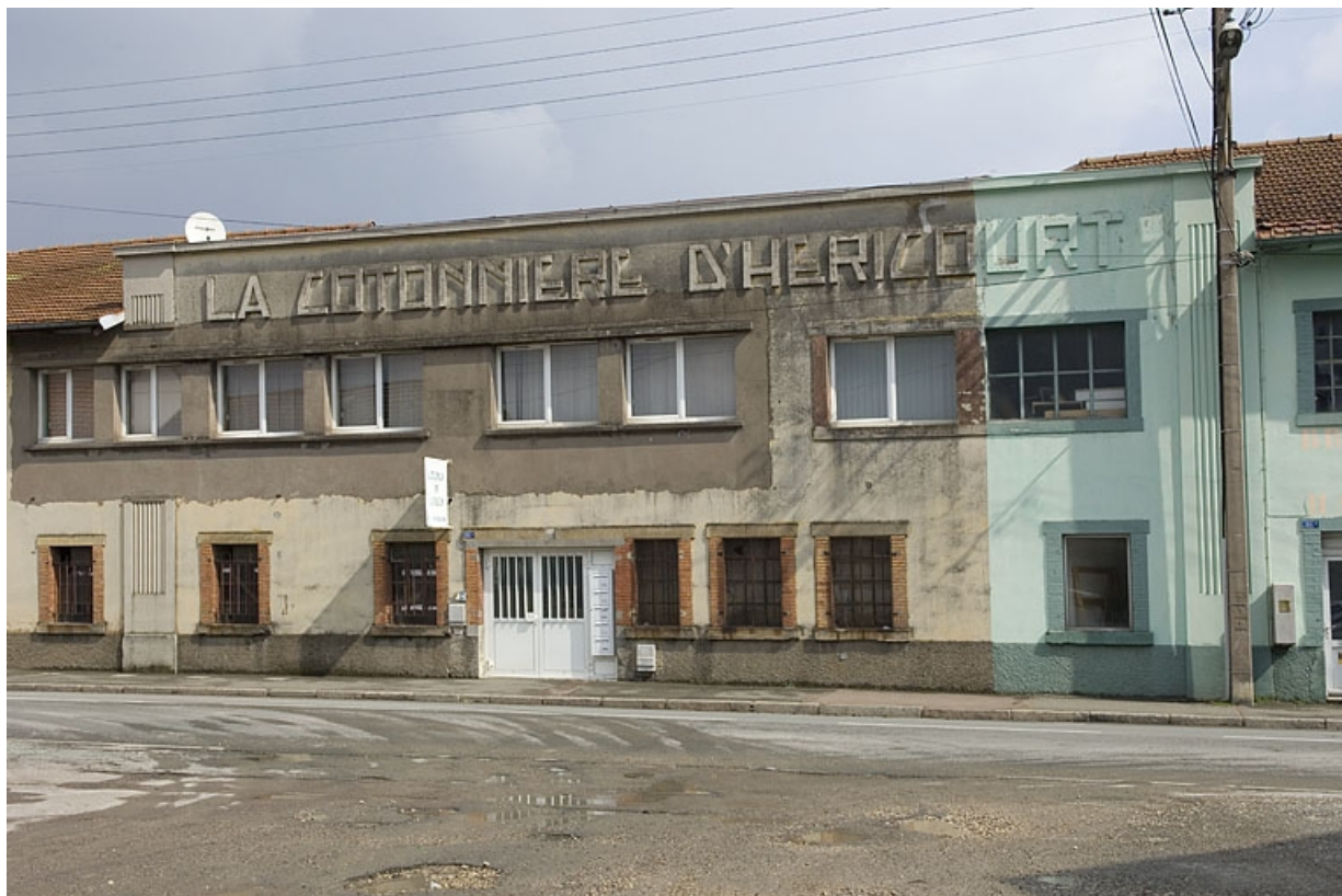
Frontispice La Cotonnière d'Héricourt.