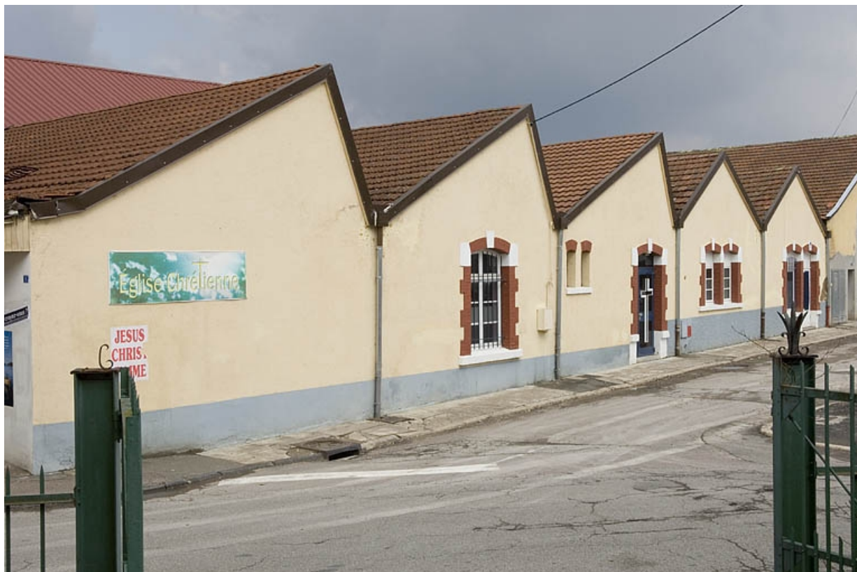
Murs-pignons est de l'usine. 70, Héricourt rue Marcel Bardot