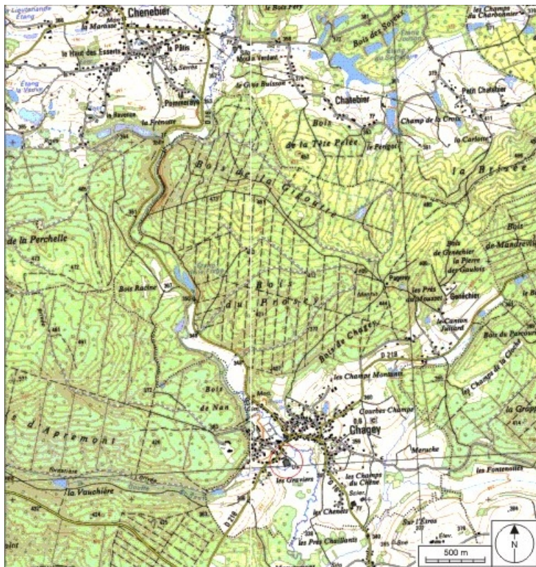
Carte de localisation. Carte topographique au 1:25000, I.G.N., Belfort, 3621 OT. 70, Chagey R.D. 218