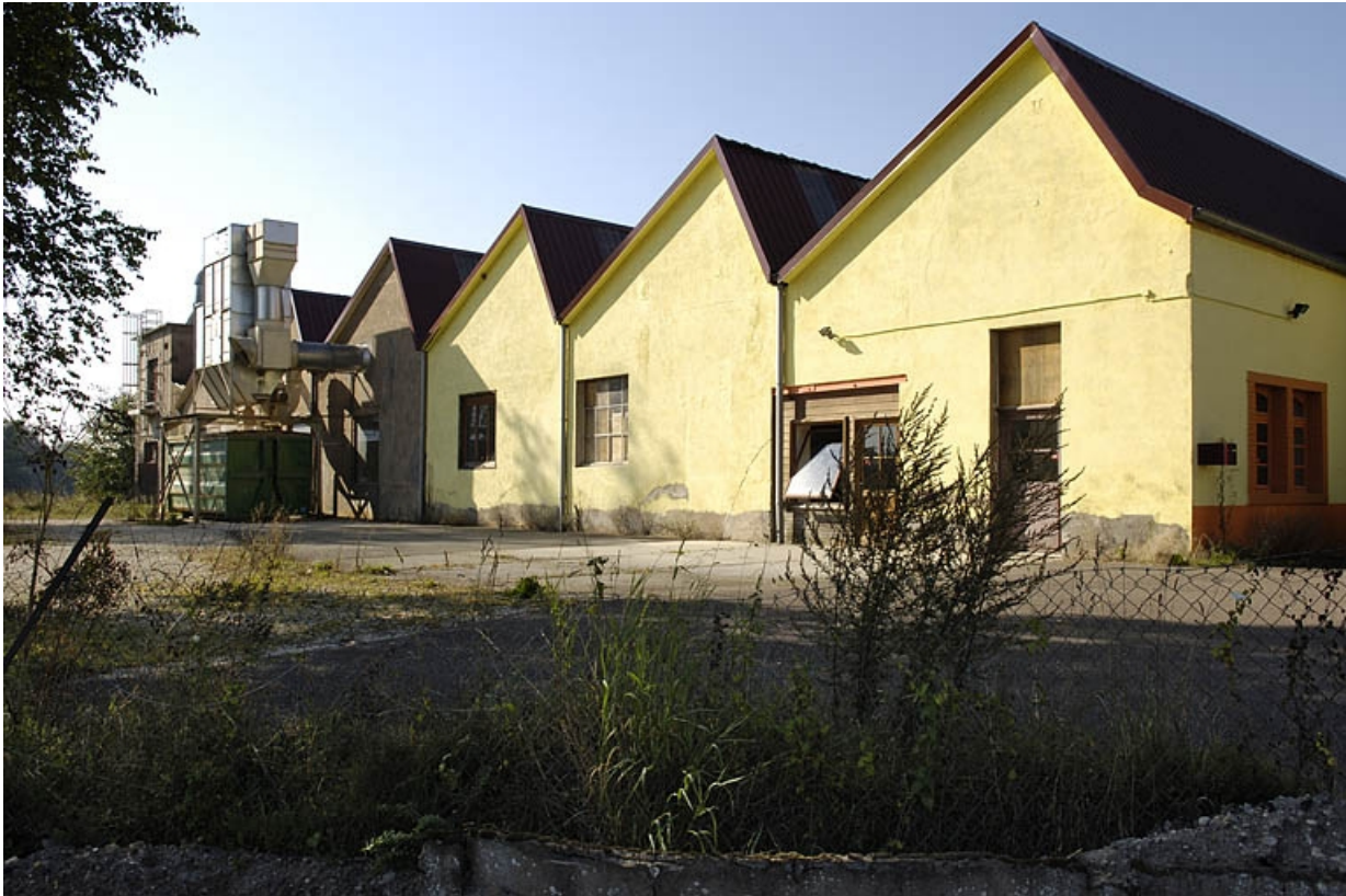
Pignons des sheds depuis l'est.