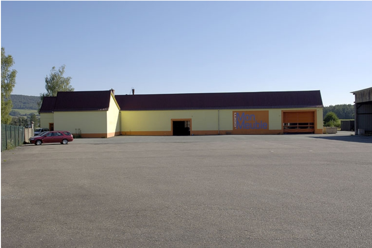
Vue d'ensemble depuis l'entrée.