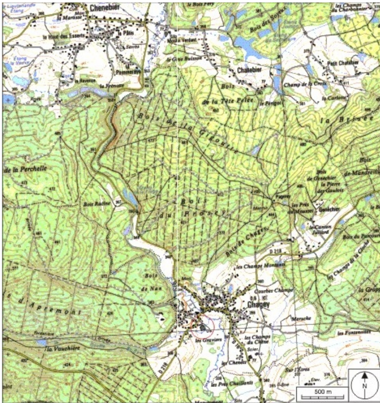
Carte de localisation. Carte topographique au 1:25000, I.G.N., Belfort, 3621 OT. SCAN 25, Licence n°2008CISE29-68. 70, Chagey R.D. 218