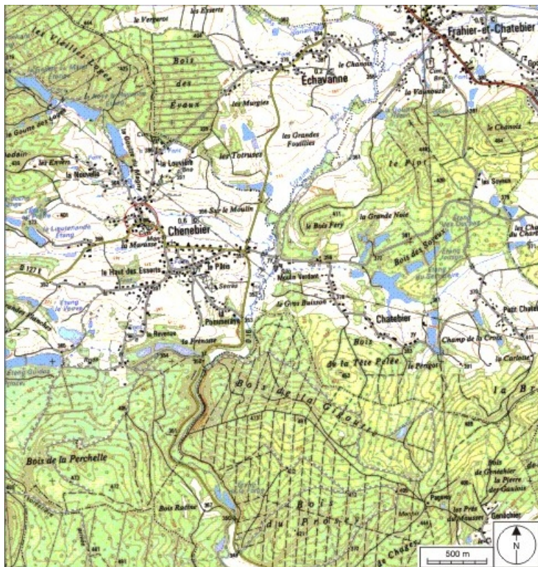
Carte de localisation. Carte topographique au 1:25000, I.G.N., Belfort, 3621 OT. 70, Chenebier, 2 rue des Combes