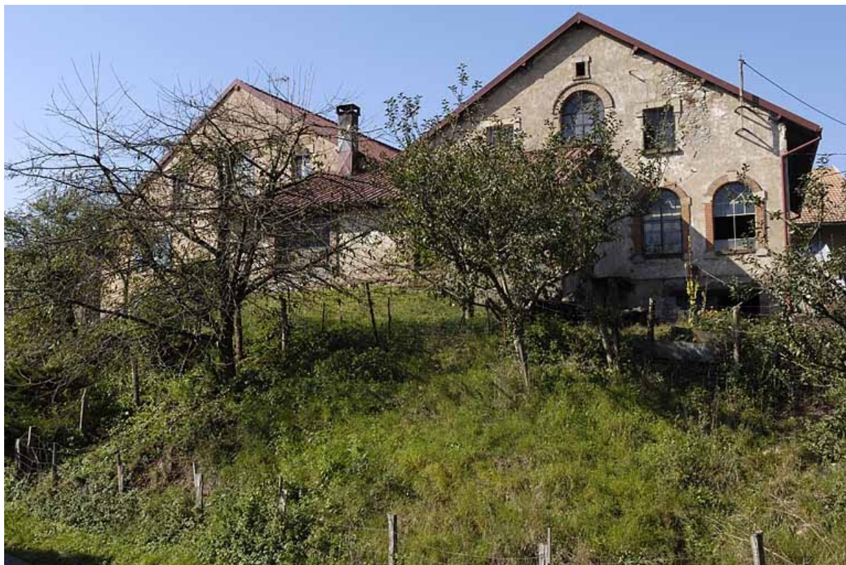
Pignons est de l'atelier de fabrication.