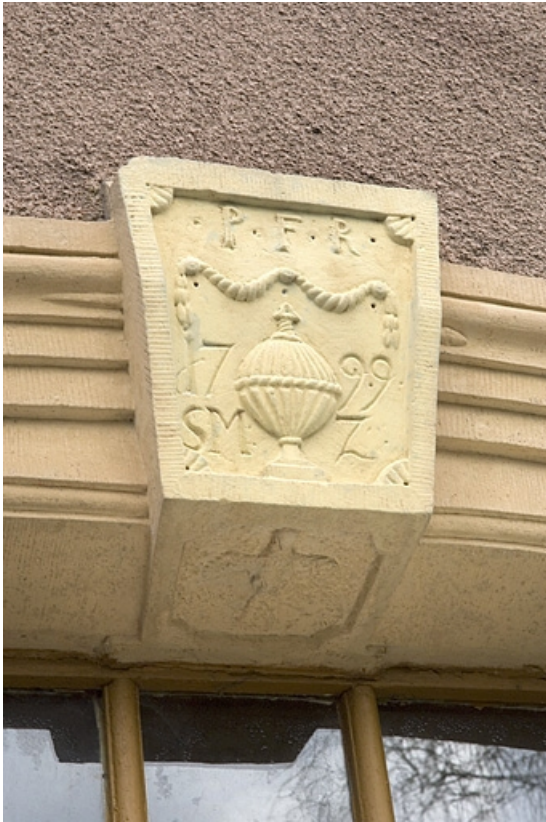
Linteau de la porte du logement. Détail de l'élément central ornementé. 70, Couthenans, lieudit : au Moulin