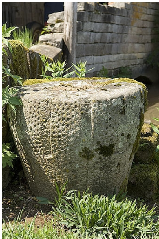
Meule déposée de la ribe (appelée poire).

70, Villers-la-Ville, lieudit : le Moulin de Grand-Pierre