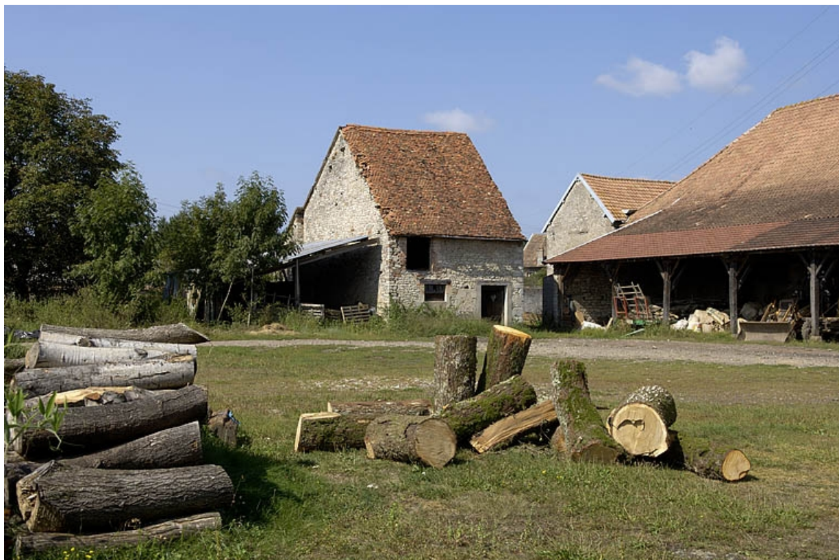
Bâtiments situés à l'ouest de la cour.