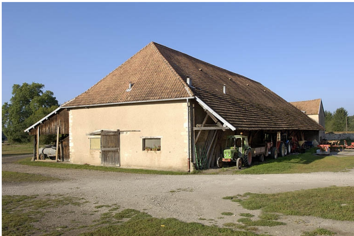
Halle à charbon vue de trois quarts.