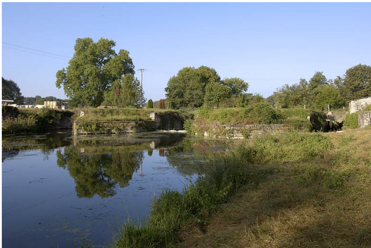
Massifs de maçonnerie, sur le bief d'amenée, où se trouvaient la forge et la fenderie. 70, Villersexel, lieudit : la Forge