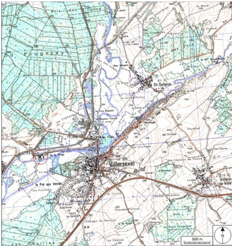
Carte de localisation. Carte topographique au 1:25000, I.G.N., Villersexel, 3421 E. 70, Villersexel, lieudit : la Forge