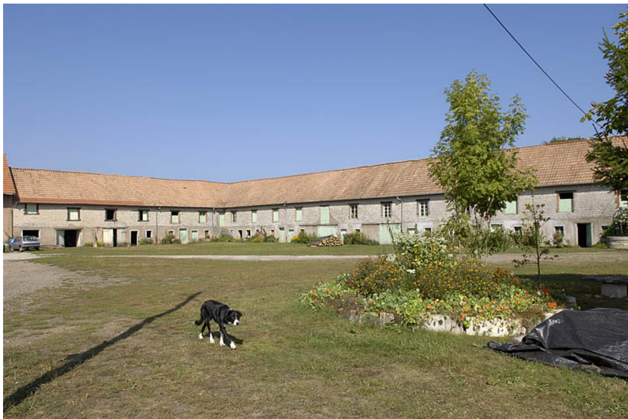
Logements ouvriers vus depuis le sud de la cour.