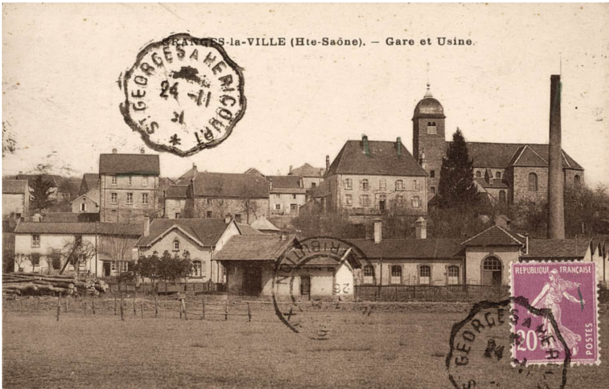
Granges-la-ville (Haute-Saône) - Gare et usine. 70, Granges-le-Bourg rue de Rougin