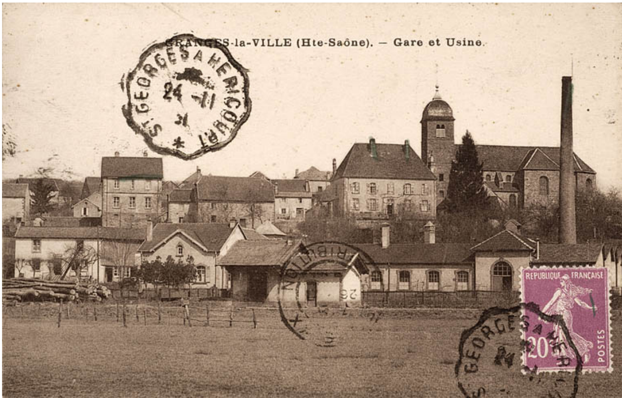
Granges-la-ville (Haute-Saône) - Gare et usine.