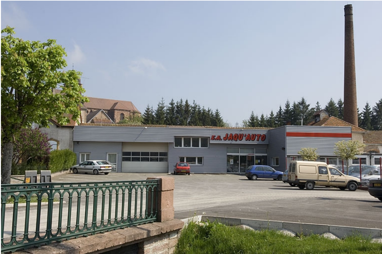
Vue depuis l'entrée.