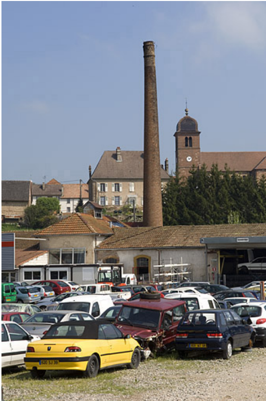
La chaufferie et la cheminée.