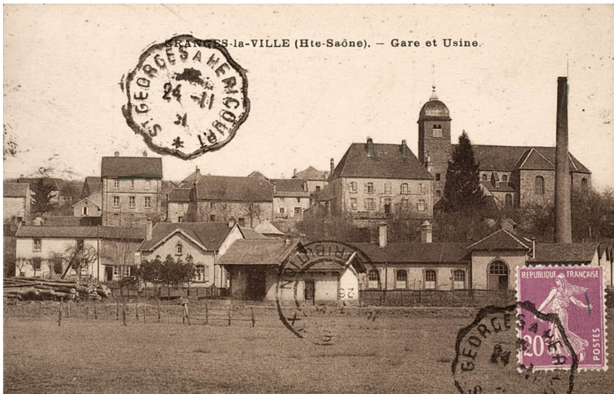
Granges-la-ville (Haute-Saône) - Gare et usine.