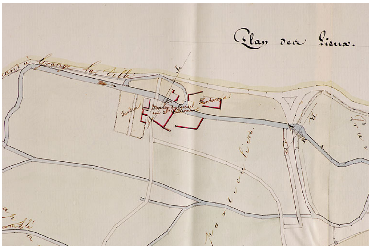
Plainte du sieur Vuilleminot, maire et meunier à Granges le Ville, contre le moulin de Veuve Viron [plan de situation]. 70, Granges-la-Ville R.D. 93

Plan, lavis, coul, échelle 1 : 1250, 1829, par Müntz (ingénieur civil). Lieu de conservation : Archives départementales de la Haute-Saône, Vesoul. Cote : 277 S 30