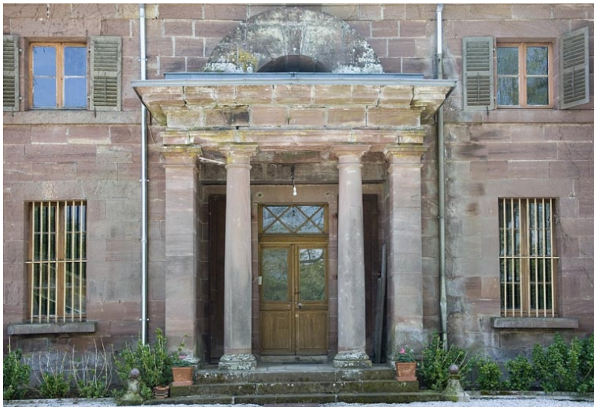
Rendez-vous de chasse. Détail de la façade postérieure.

70, Athesans-Étroitefontaine, lieudit : Saint-Georges