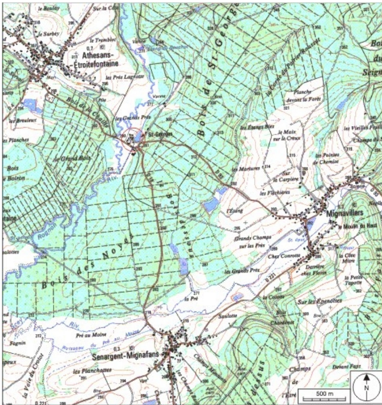
Carte de localisation. Carte topographique au 1:25000, I.G.N., Lure, 3521 O. 70, Athesans-Étroitefontaine, lieudit : Saint-Georges