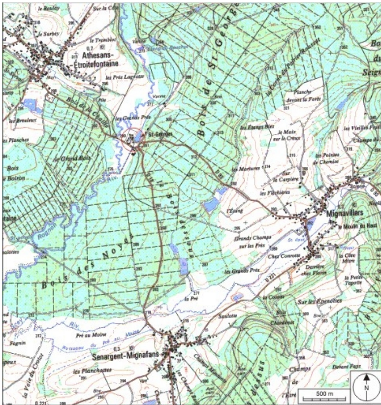
Carte de localisation. Carte topographique au 1:25000, I.G.N., Lure, 3521 O. SCAN 25, Licence n°2008CISE29-68. 70, Athesans-Étroitefontaine, lieudit : Saint-Georges