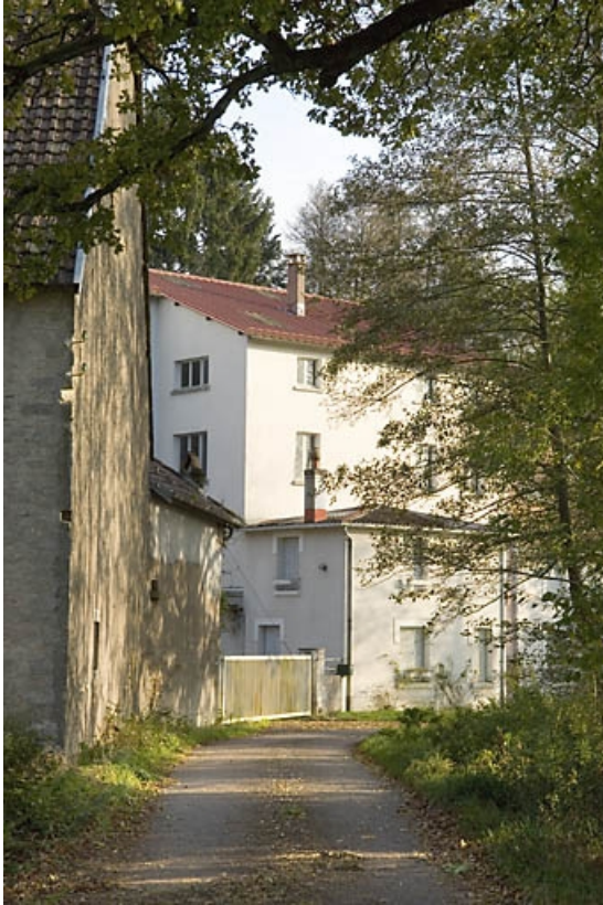
Elévation depuis le nord.