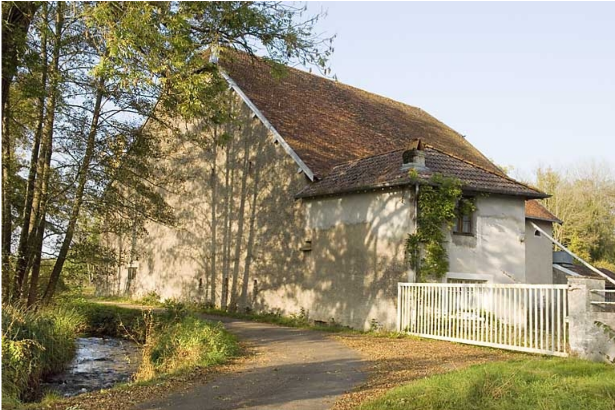
Bâtiment abritant les parties agricoles et les cellules à grain.