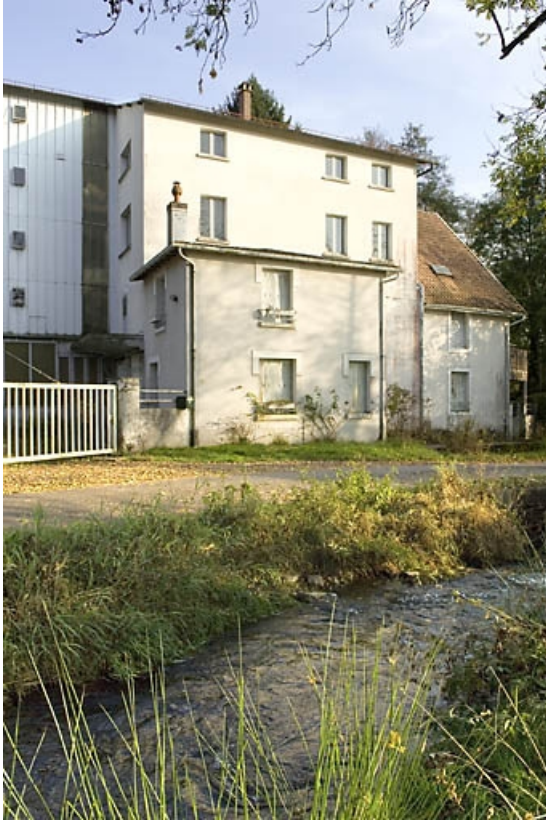
Élévation de l'atelier de fabrication.