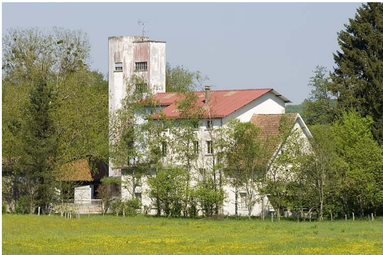
Façade occidentale vue de trois quarts.