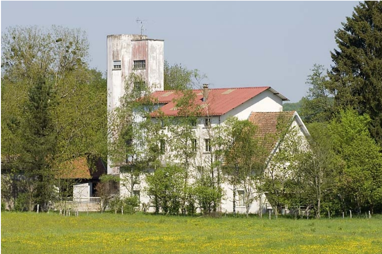
Façade occidentale vue de trois quarts.