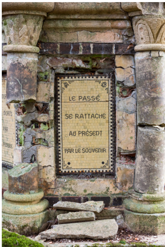
Soubassement, détail, inscription : "Le passé se rattache au présent par le souvenir."

58, Pougues-les-Eaux, 130 avenue de Paris, lieudit : La Montjaie