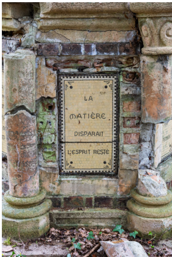
Soubassement, détail, inscription : "La matière disparaît l'esprit reste."

58, Pougues-les-Eaux, 130 avenue de Paris, lieudit : La Montjaie