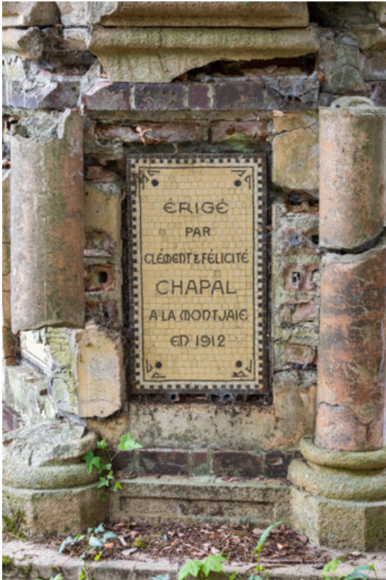
Soubassement, détail, inscription : "Erigé par Clément et Félicité Chapal à la Montjaie en 1913". 58, Pougues-les-Eaux, 130 avenue de Paris, lieudit : La Montjaie