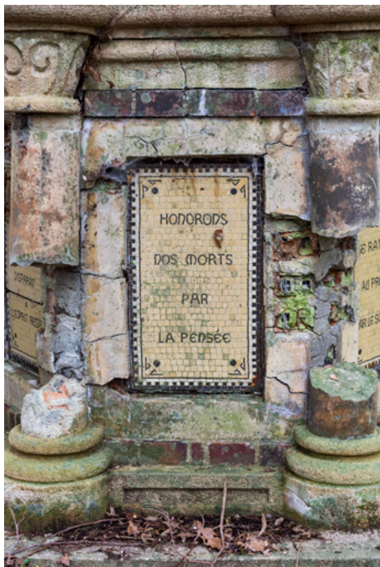
Soubassement, détail, inscription : "Honorons nos morts par la pensée."

58, Pougues-les-Eaux, 130 avenue de Paris, lieudit : La Montjaie