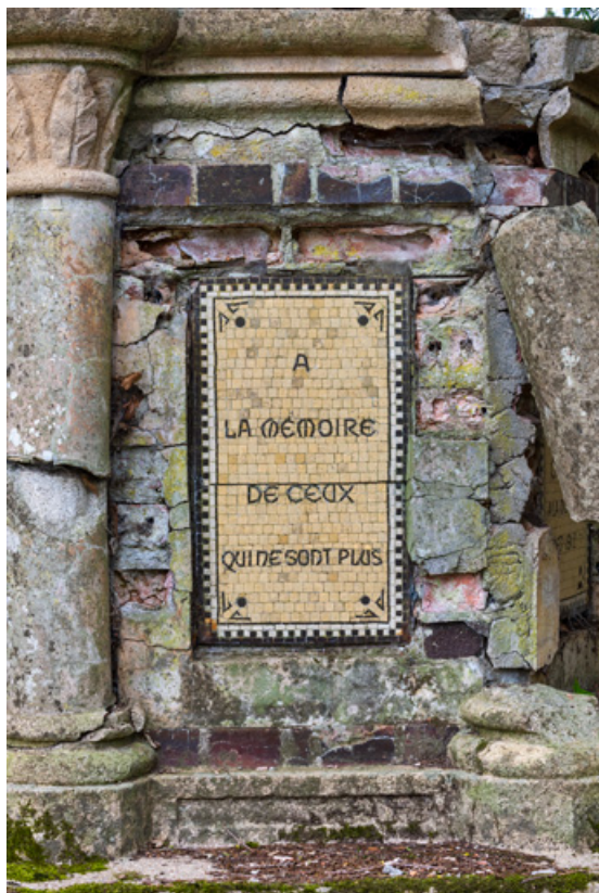
Soubassement, détail, inscription : "À la mémoire de ceux qui ne sont plus."

58, Pougues-les-Eaux, 130 avenue de Paris, lieudit : La Montjaie