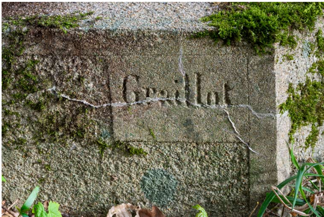
Base, détail, signature : Graillot.

58, Pougues-les-Eaux, 130 avenue de Paris, lieudit : La Montjaie