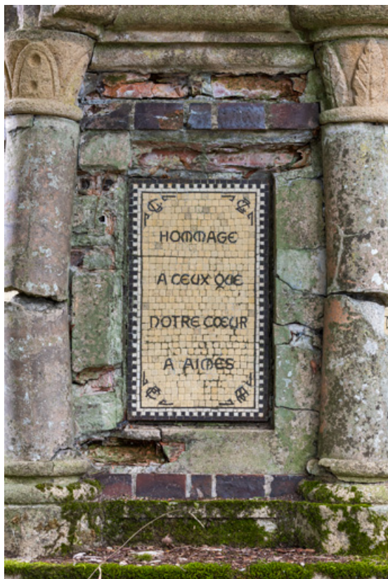
Soubassement, détail, inscription : "Hommage à ceux que notre cœur a aimés."

58, Pougues-les-Eaux, 130 avenue de Paris, lieudit : La Montjaie