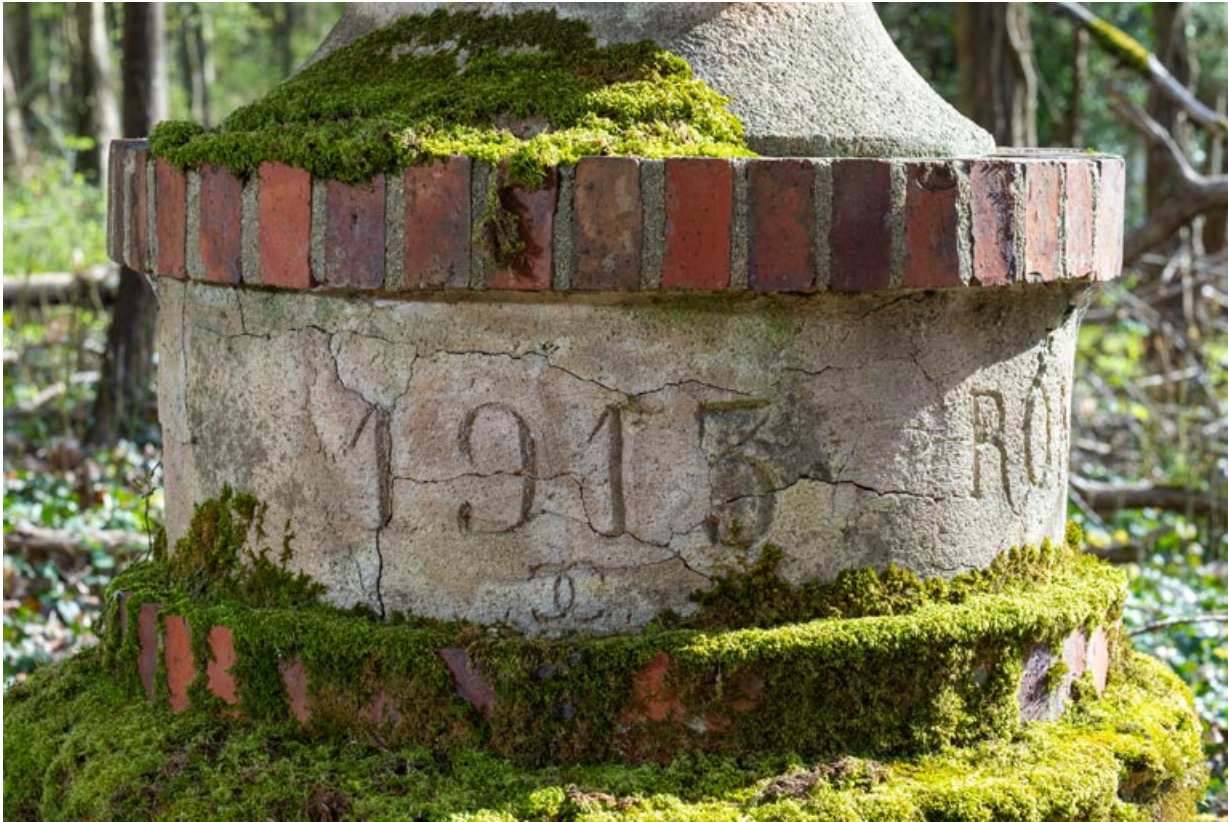
Base, détail : 1913.

58, Pougues-les-Eaux, 130 avenue de Paris, lieudit : La Montjaie