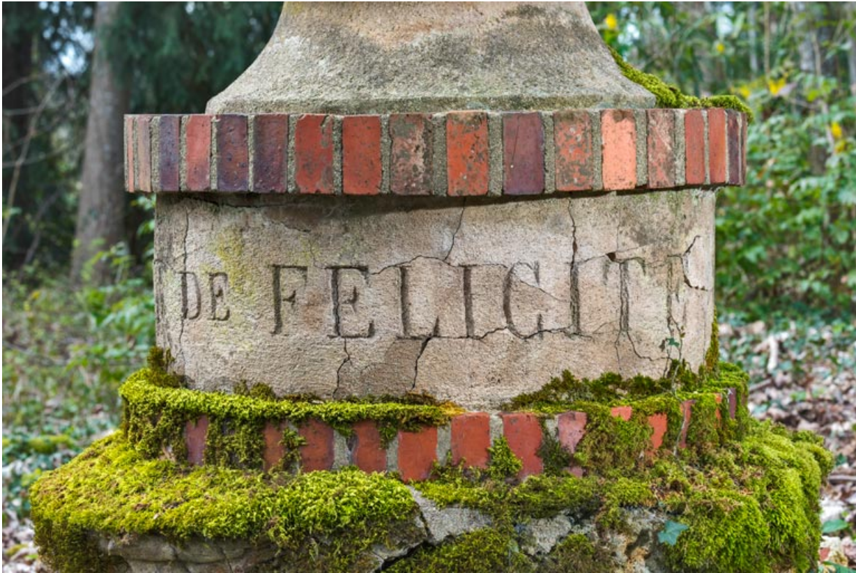
Base, détail : "DE FELICITE".

58, Pougues-les-Eaux, 130 avenue de Paris, lieudit : La Montjaie