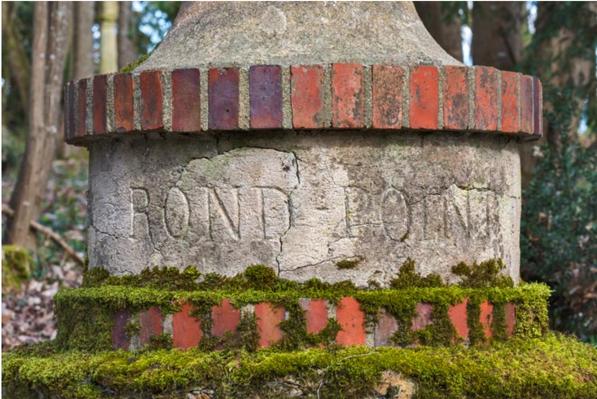
Base, détail : "ROND-POINT".

58, Pougues-les-Eaux, 130 avenue de Paris, lieudit : La Montjaie