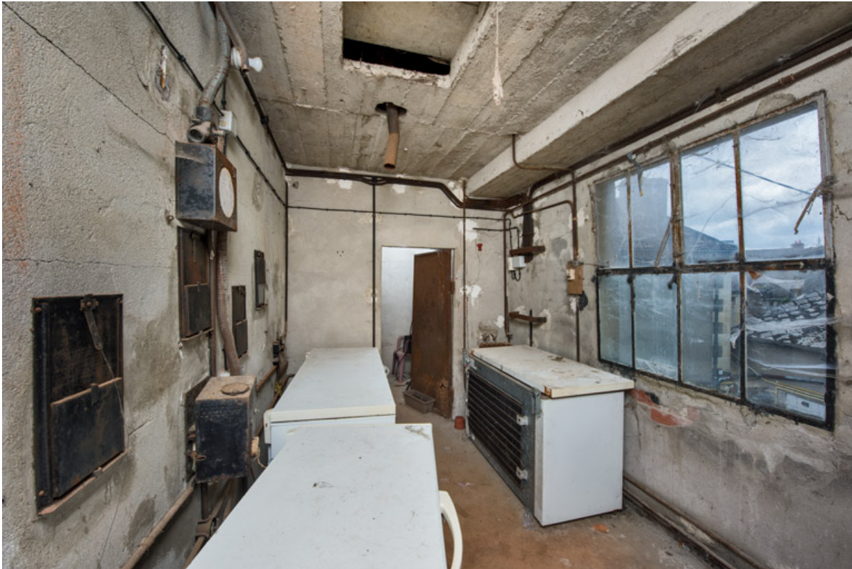
Cabine de projection.