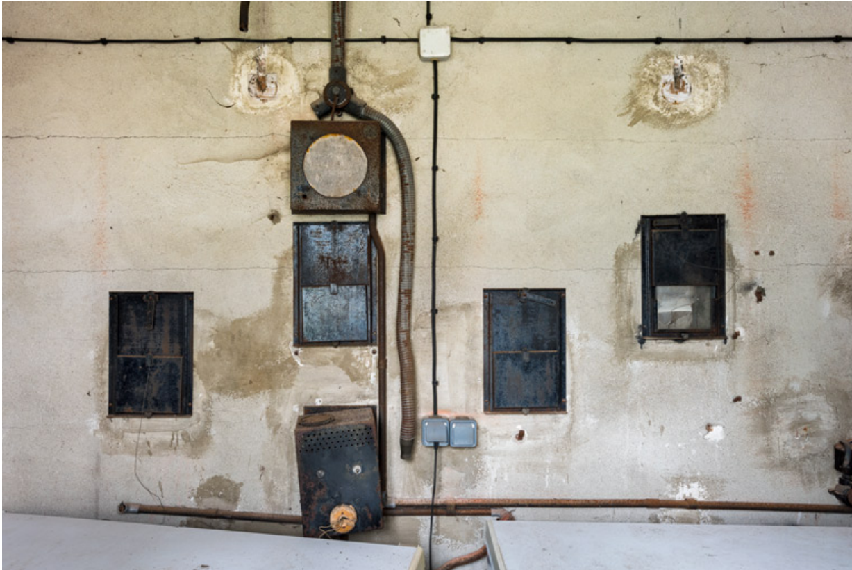
Cabine de projection : petites baies carrées donnant sur la salle.