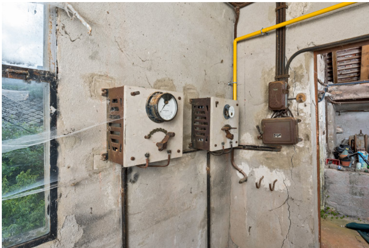
Cabine de projection : rhéostats.