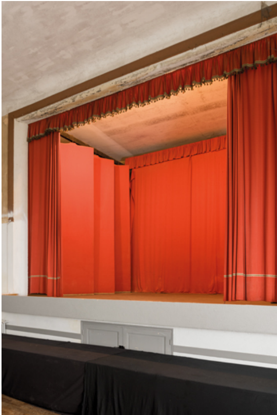
Scène, vue de trois quarts droite.