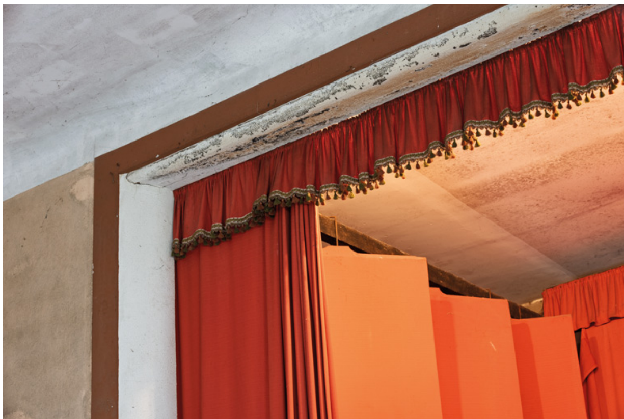
Scène : détail du cadre de scène et des rideaux dans l'angle côté jardin. 58, Donzy, 10 rue de l' Etape