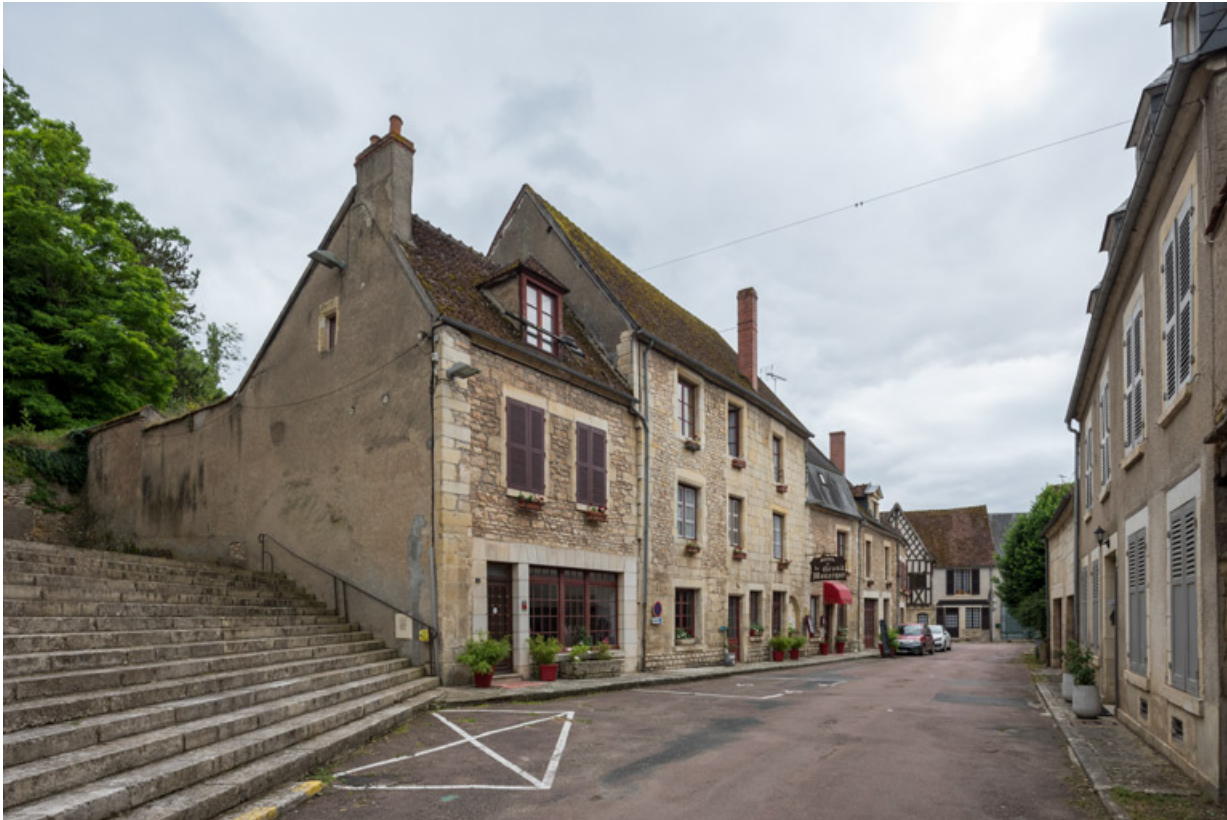
Vue d'ensemble de l'hôtel-restaurant du Grand Monarque.