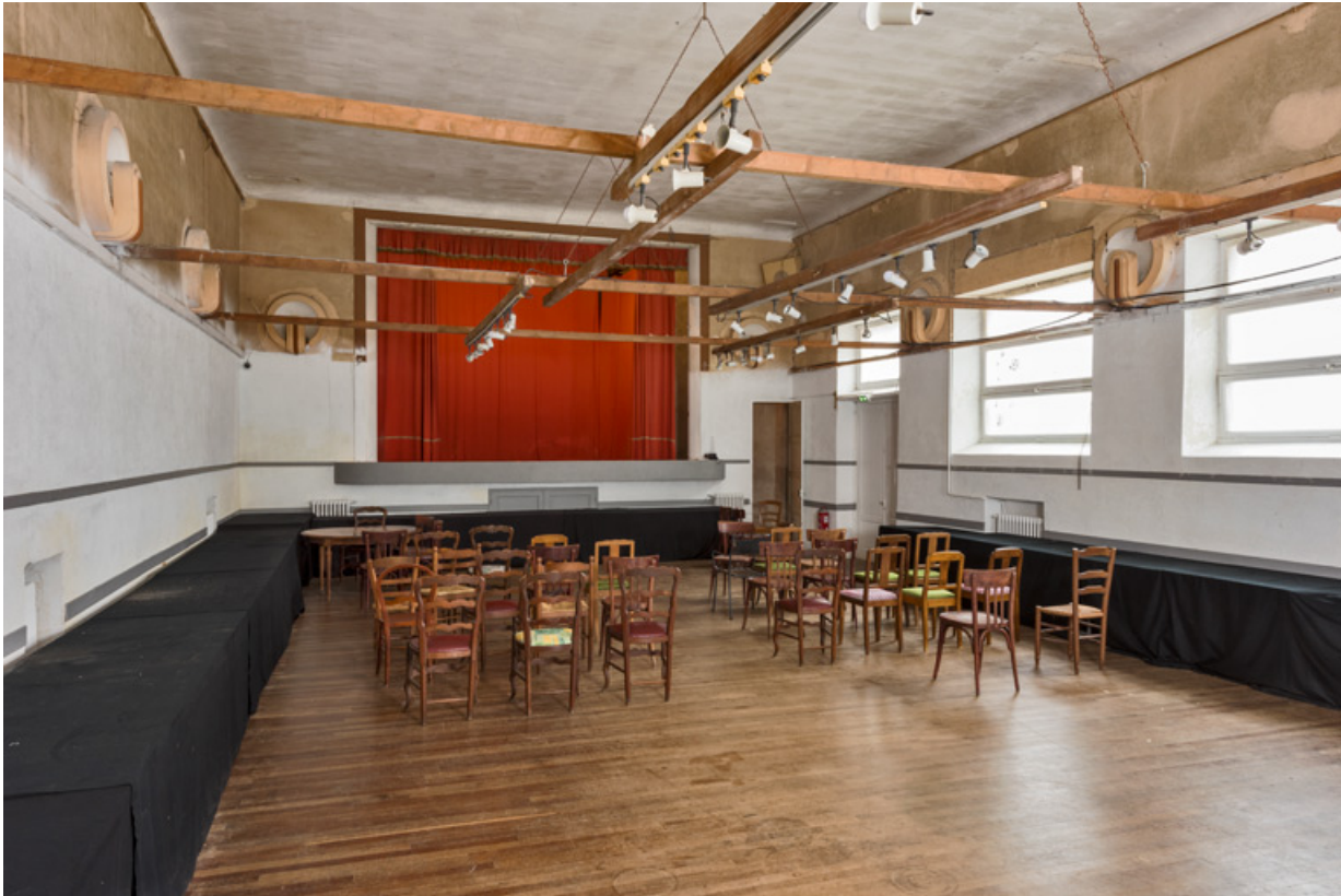
La salle, vue vers la scène.