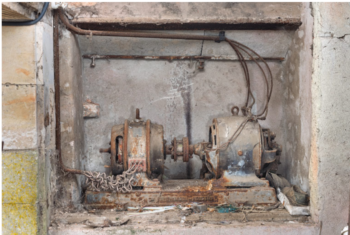
Moteur asynchrone de la Cie française Thomson-Houston (Paris), près de la cabine de projection. 58, Donzy, 10 rue de l' Etape