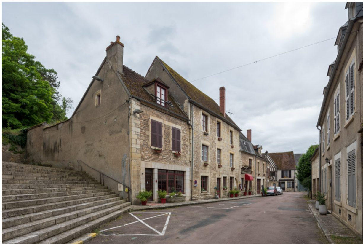
Vue d'ensemble de l'hôtel-restaurant du Grand Monarque.