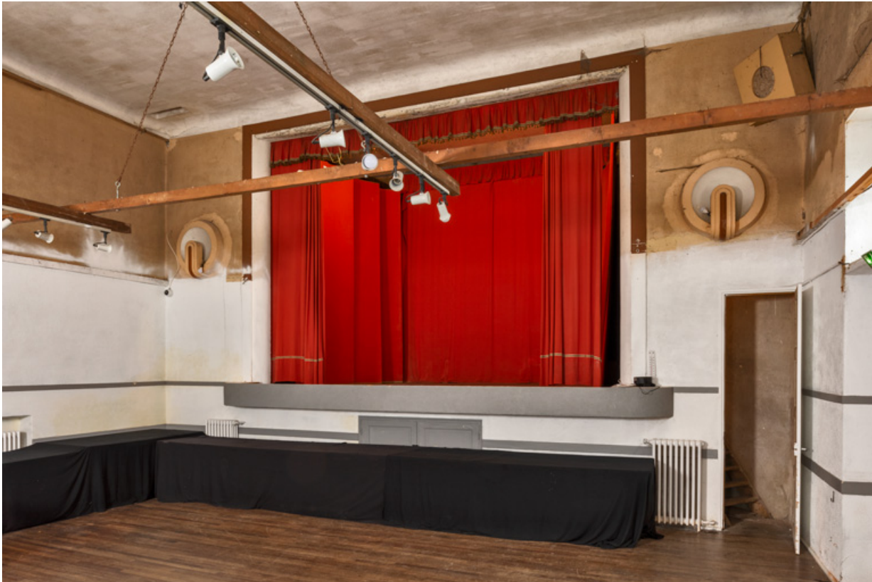
Cadre de scène et scène, vus de trois quarts droite.