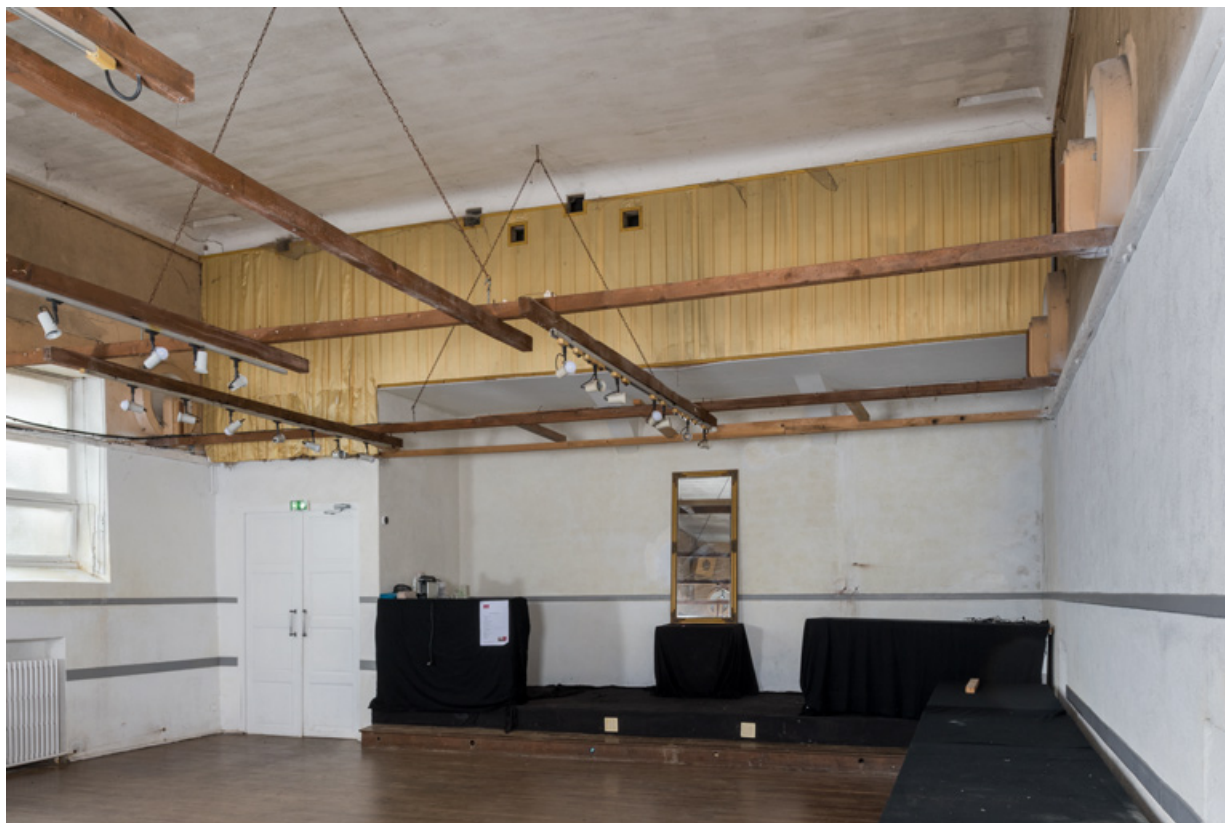
La salle, vue de la scène. L'emplacement de la cabine de projection est signalé par les quatre petites baies carrées sous le plafond. 58, Donzy, 10 rue de l' Etape