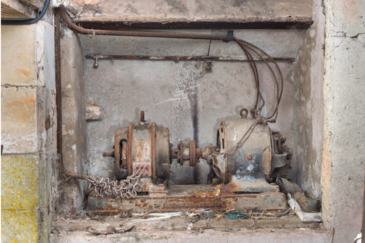
Moteur asynchrone de la Cie française Thomson-Houston (Paris), près de la cabine de projection. 58, Donzy, 10 rue de l' Etape