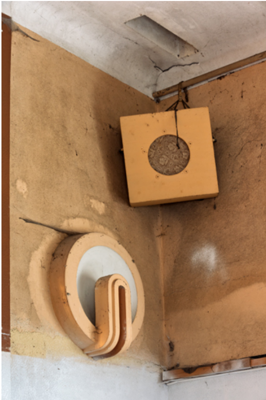
Luminaire d'applique et haut-parleur.