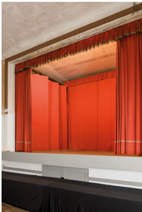
Scène, vue de trois quarts droite.