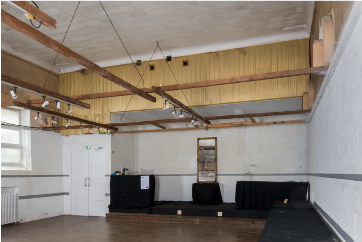
La salle, vue de la scène. L'emplacement de la cabine de projection est signalé par les quatre petites baies carrées sous le plafond. 58, Donzy, 10 rue de l' Etape