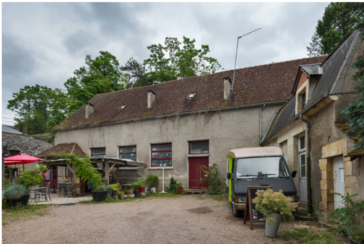
Donzy : le Monarque (10 rue de l'Etape). 58, Donzy, 10 rue de l' Etape