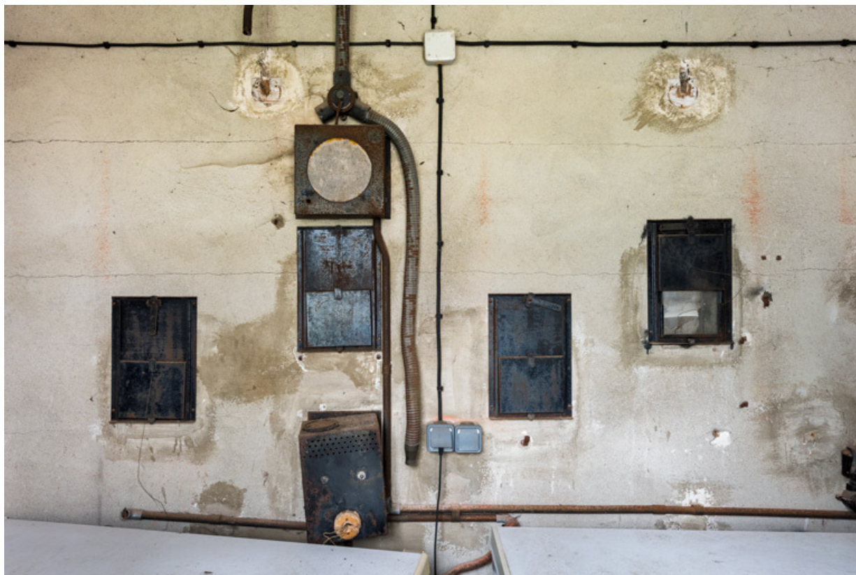
Cabine de projection : petites baies carrées donnant sur la salle.