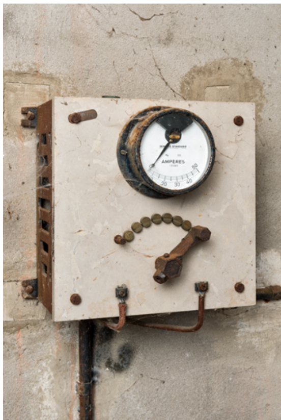
Cabine de projection : un rhéostat.