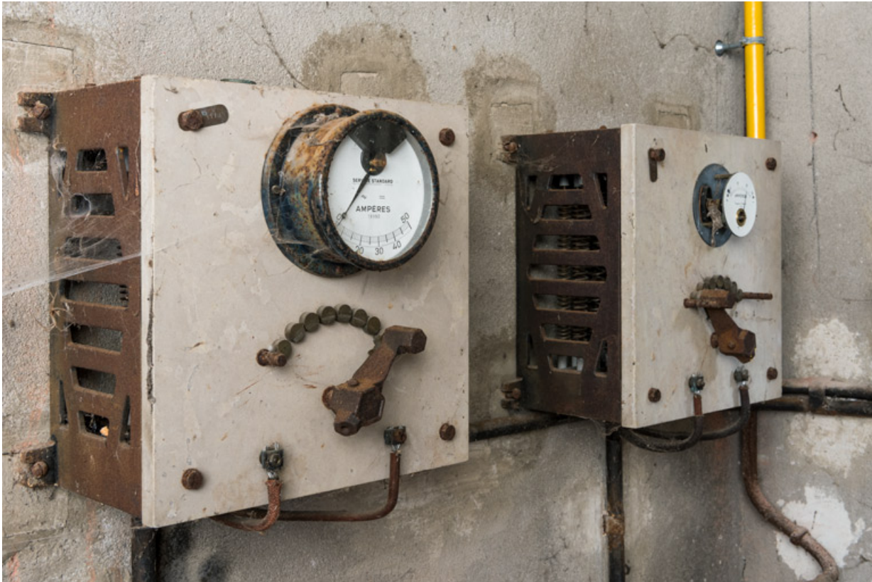
Cabine de projection : rhéostats.