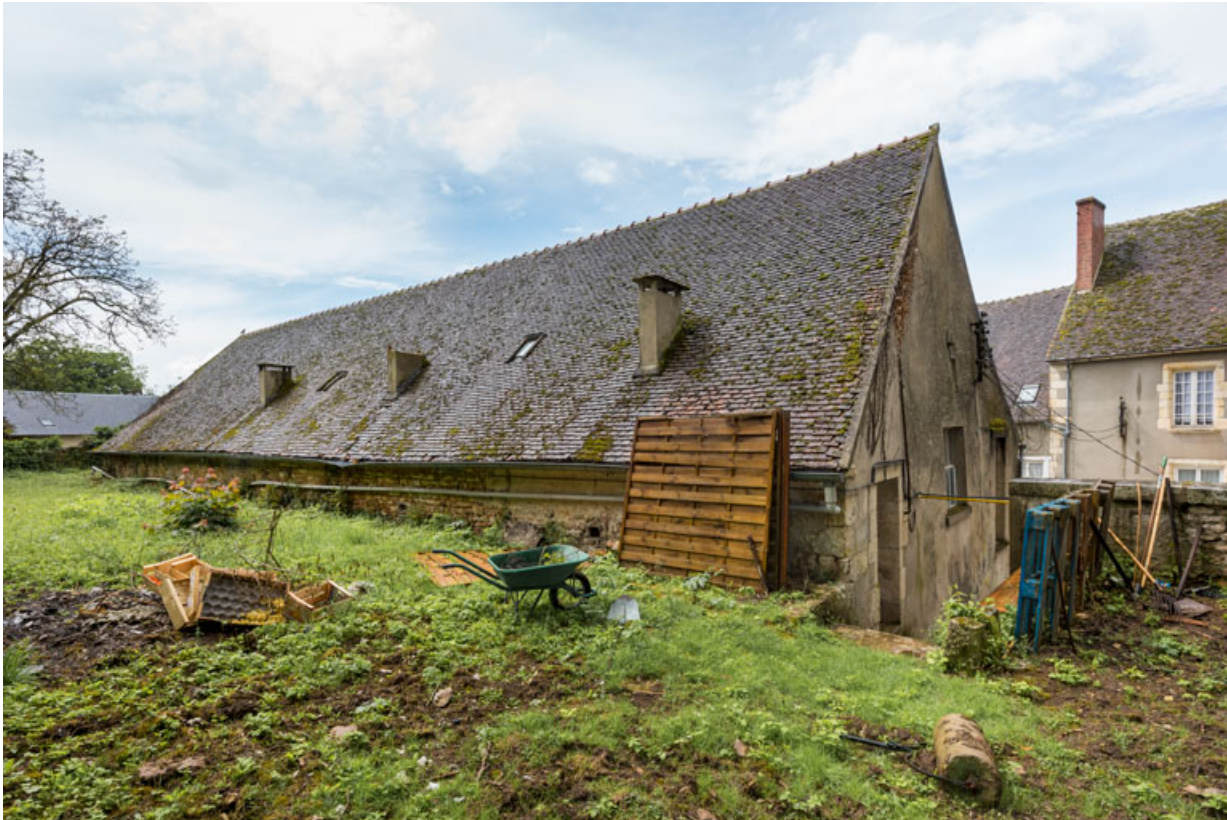
Façades postérieure et latérale gauche.