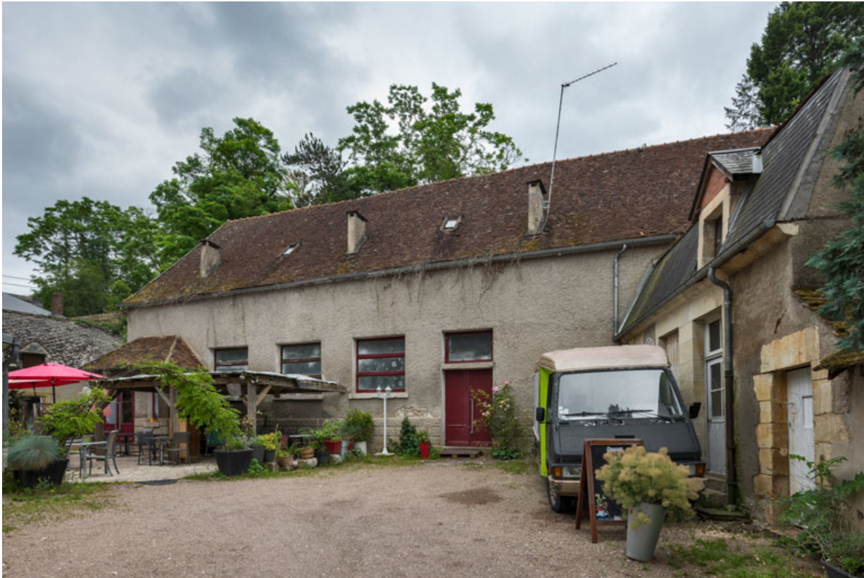
Donzy : le Monarque (10 rue de l'Etape).