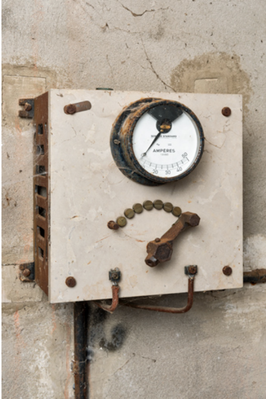
Cabine de projection : un rhéostat.