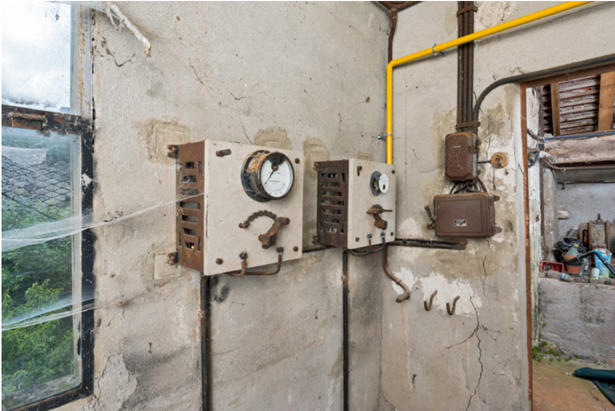
Cabine de projection : rhéostats.