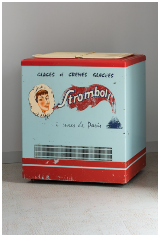
Vestibule : congélateur avec une publicité pour les glaces Stromboli.

58, Saint-Honoré-les-Bains, 18 rue Henri Renaud