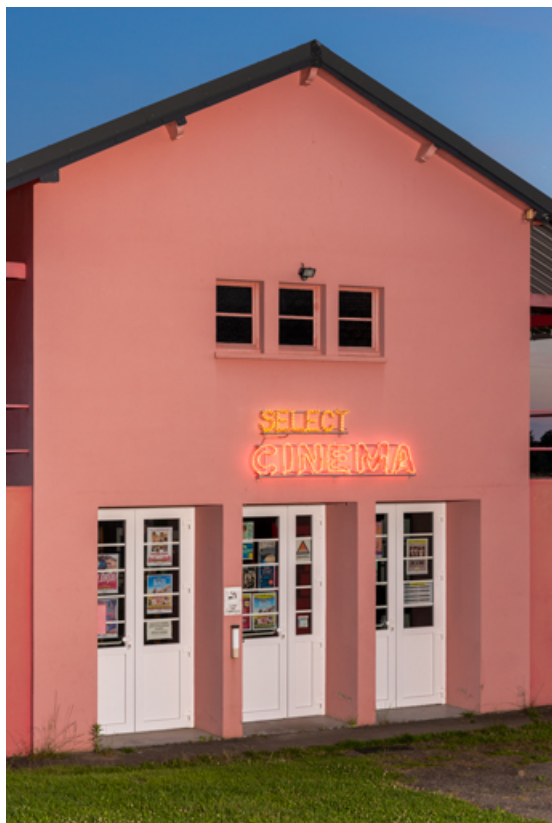
Façade antérieure, de trois quarts gauche, de nuit (vue rapprochée). 58, Saint-Honoré-les-Bains, 18 rue Henri Renaud