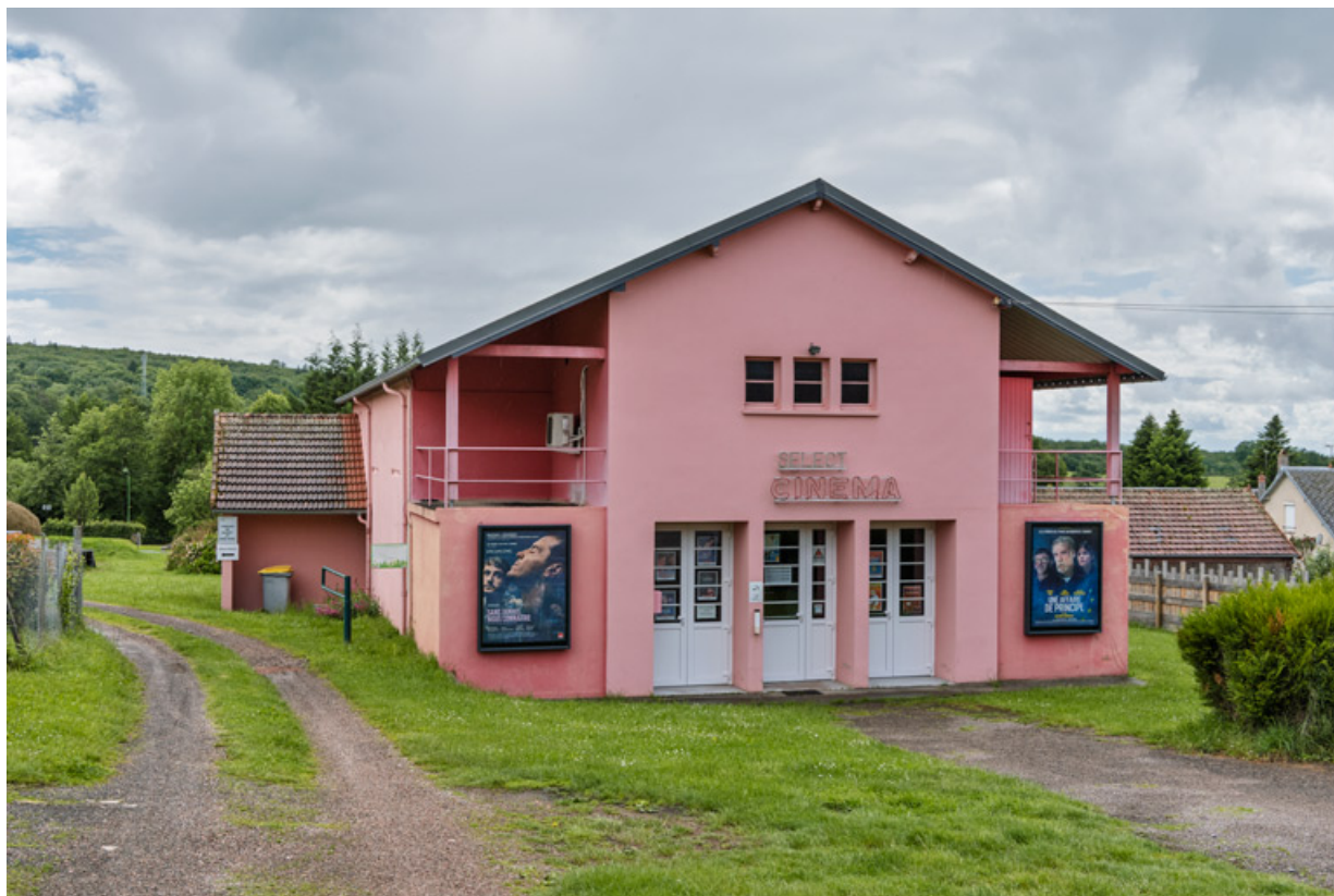
Façade antérieure, de trois quarts gauche.