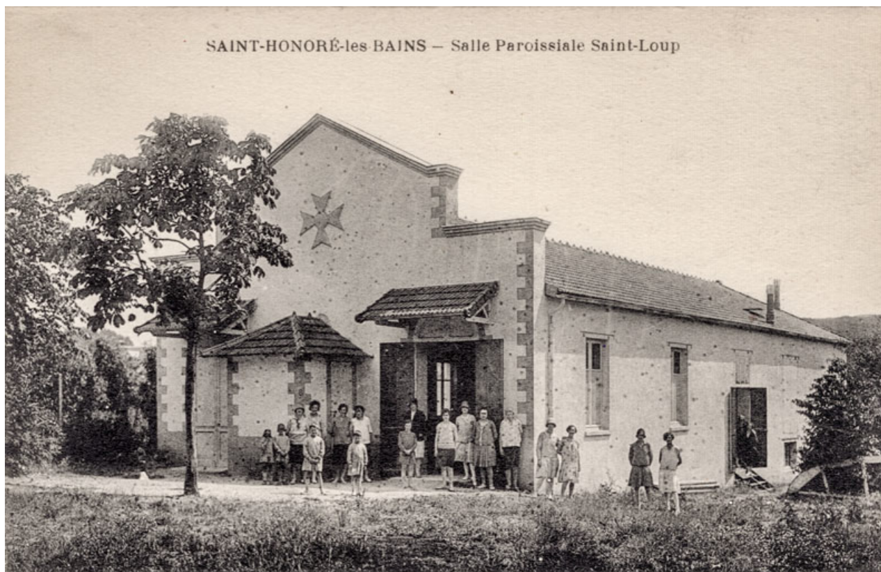
Saint-Honoré-les-Bains - Salle paroissiale Saint-Loup [extérieur]. S.d. [milieu 20e siècle].

58, Saint-Honoré-les-Bains, 18 rue Henri Renaud