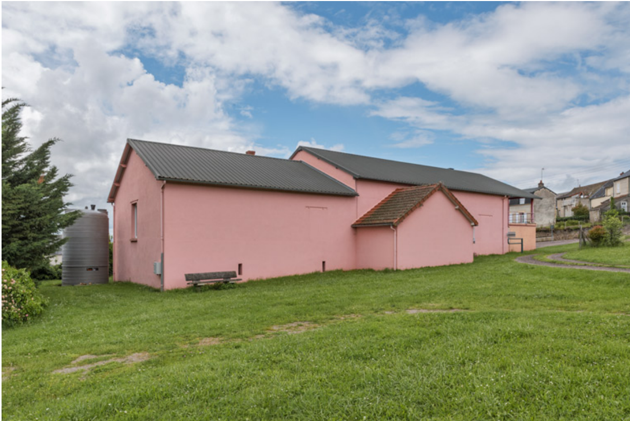
Façade postérieure et latérale gauche.

58, Saint-Honoré-les-Bains, 18 rue Henri Renaud