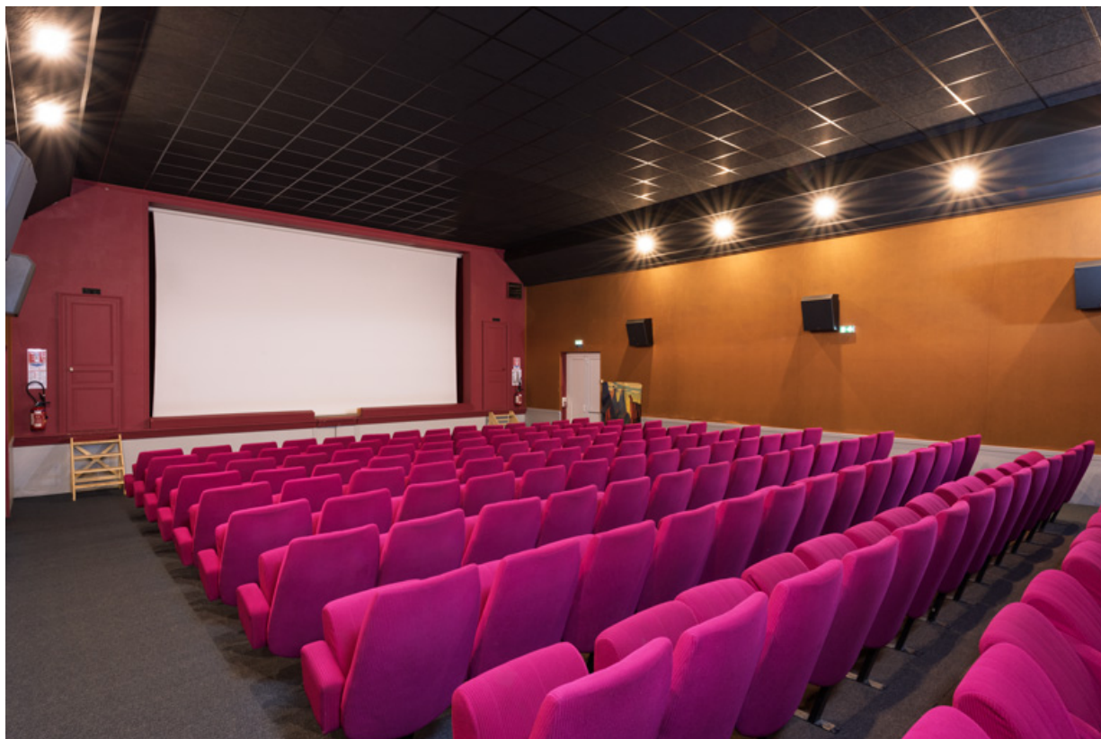
Salle : vue vers la scène, de trois quarts gauche, écran baissé.

58, Saint-Honoré-les-Bains, 18 rue Henri Renaud