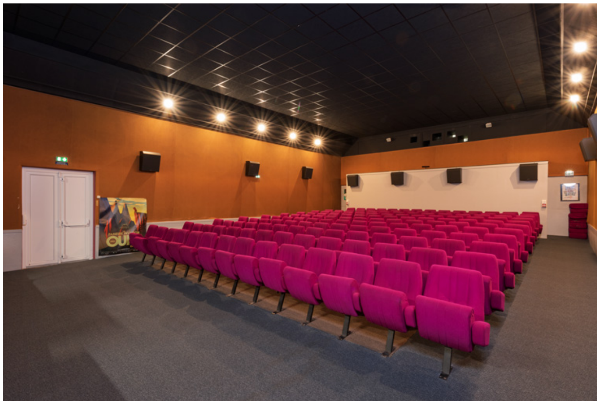
Salle : vue depuis la scène, de trois quarts droite.

58, Saint-Honoré-les-Bains, 18 rue Henri Renaud