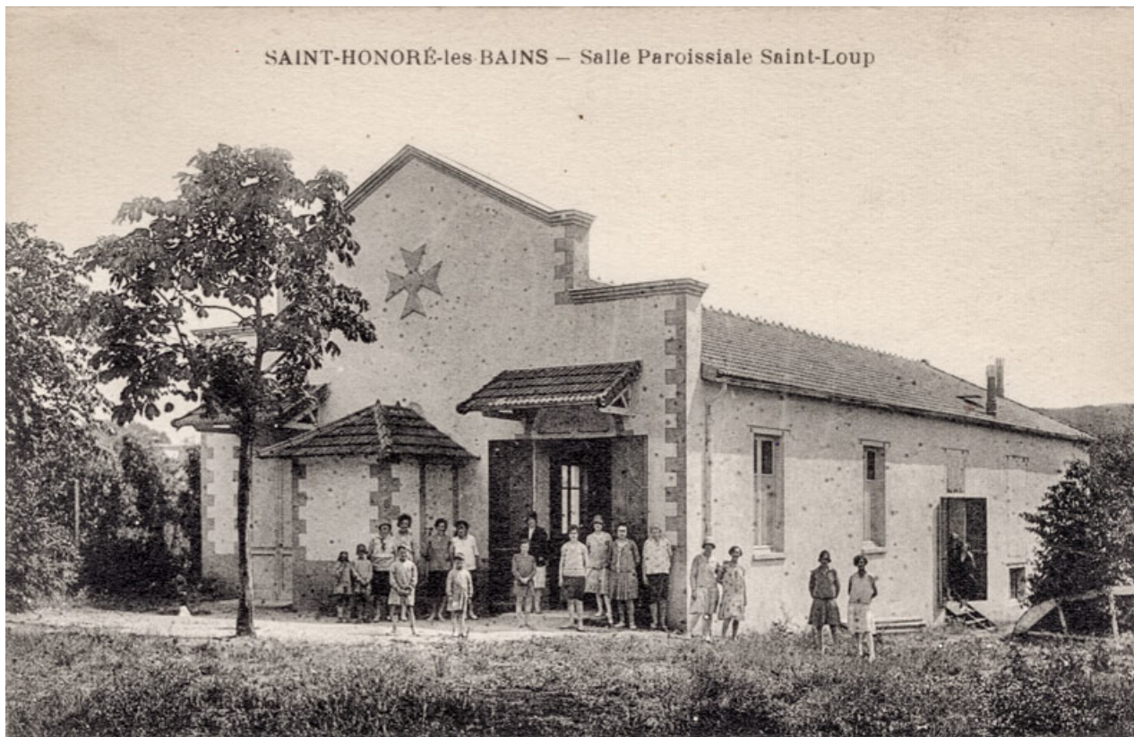
Saint-Honoré-les-Bains - Salle paroissiale Saint-Loup [extérieur]. S.d. [milieu 20e siècle].

58, Saint-Honoré-les-Bains, 18 rue Henri Renaud