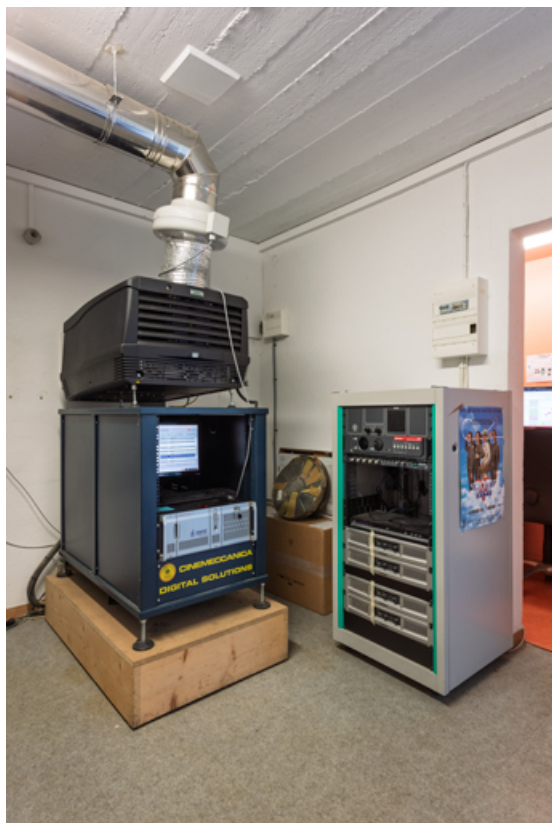
Cabine de projection : projecteur numérique Barco DP2K-15C.

58, Saint-Honoré-les-Bains, 18 rue Henri Renaud