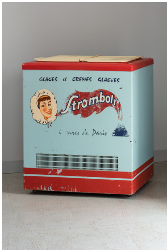
Vestibule : congélateur avec une publicité pour les glaces Stromboli.

58, Saint-Honoré-les-Bains, 18 rue Henri Renaud