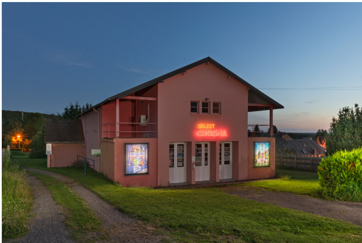
Façade antérieure, de trois quarts gauche, de nuit.

58, Saint-Honoré-les-Bains, 18 rue Henri Renaud