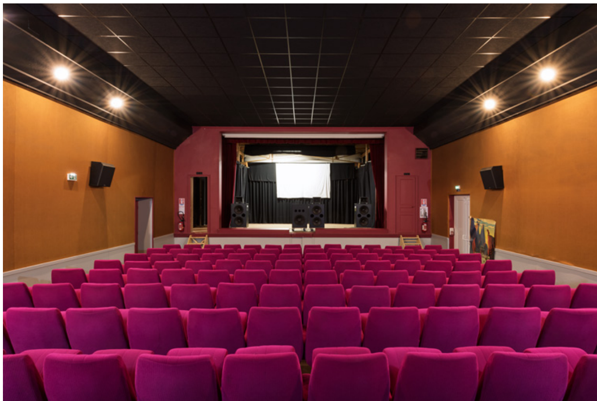
Salle : vue vers la scène, écran levé.

58, Saint-Honoré-les-Bains, 18 rue Henri Renaud