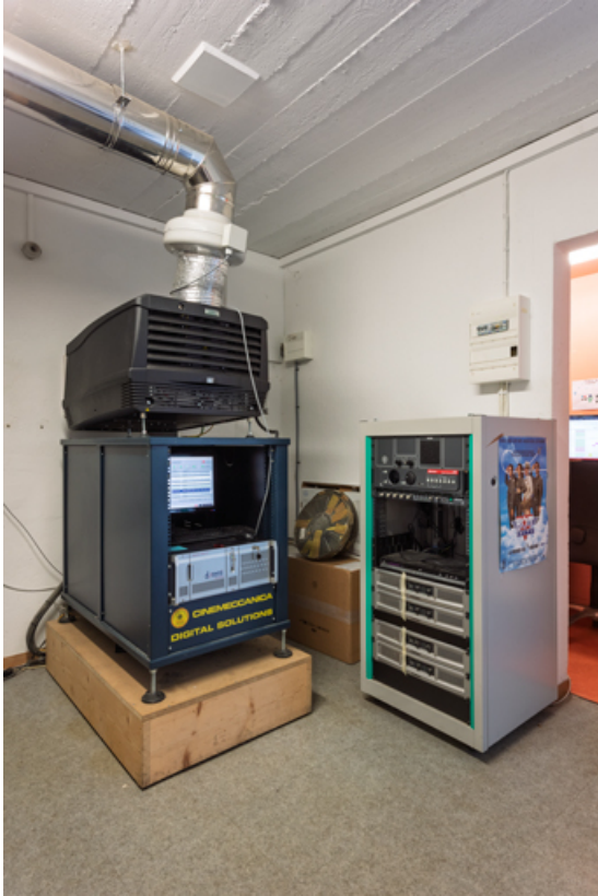
Cabine de projection : projecteur numérique Barco DP2K-15C.

58, Saint-Honoré-les-Bains, 18 rue Henri Renaud