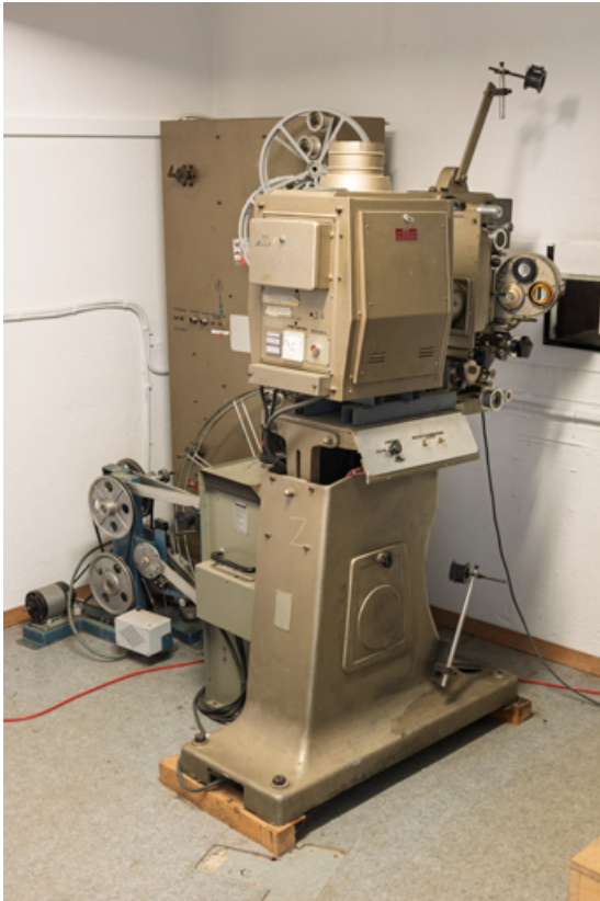
Vue d'ensemble, de trois quarts arrière.

58, Saint-Honoré-les-Bains, 18 rue Henri Renaud