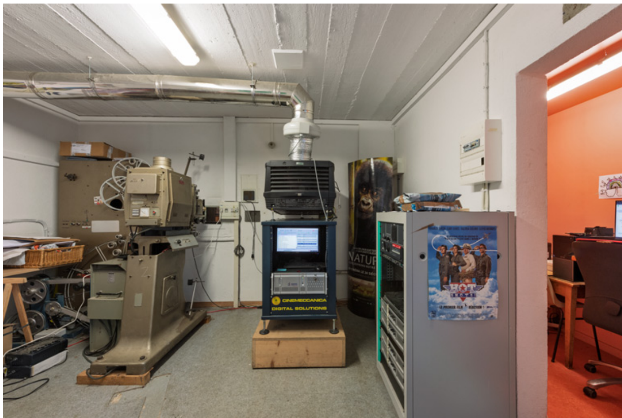
Cabine de projection.