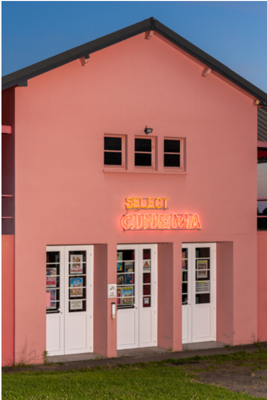
Façade antérieure, de trois quarts gauche, de nuit (vue rapprochée). 58, Saint-Honoré-les-Bains, 18 rue Henri Renaud