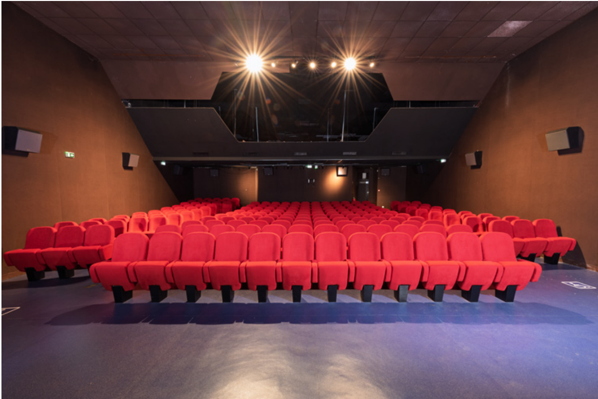
Salle 1 : vue depuis l'écran.

58, La Charité-sur-Loire, 14 rue de Bourgogne