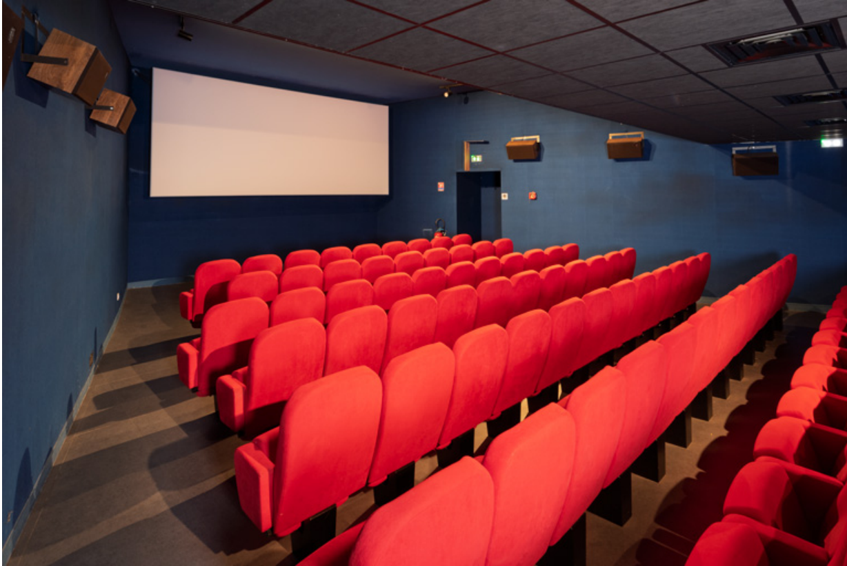
Salle 2 : vue vers l'écran, de trois quarts gauche.

58, La Charité-sur-Loire, 14 rue de Bourgogne