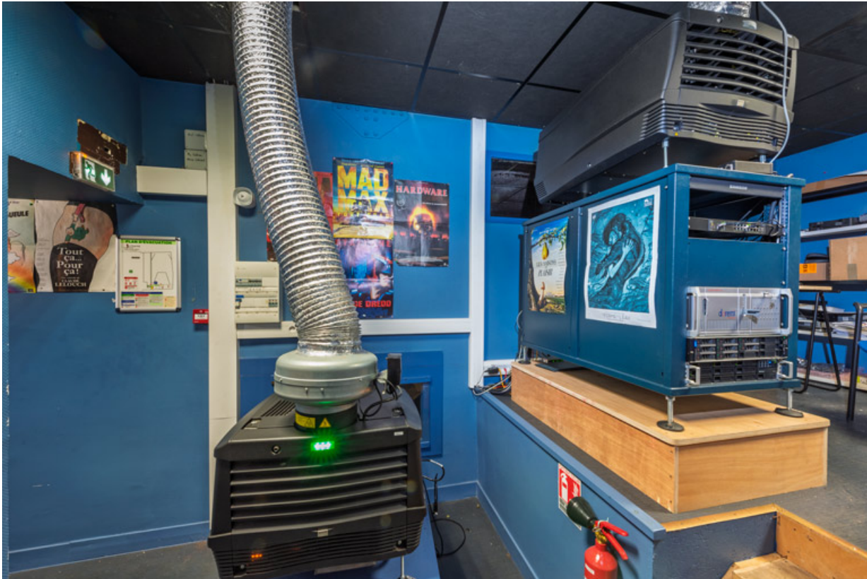
Cabine de projection : projecteurs Barco DP2K12C.

58, La Charité-sur-Loire, 14 rue de Bourgogne