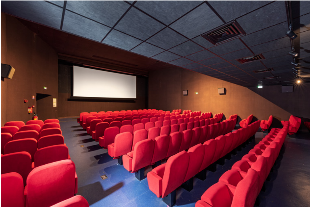
Salle 1 : vue vers l'écran, de trois quarts gauche.

58, La Charité-sur-Loire, 14 rue de Bourgogne