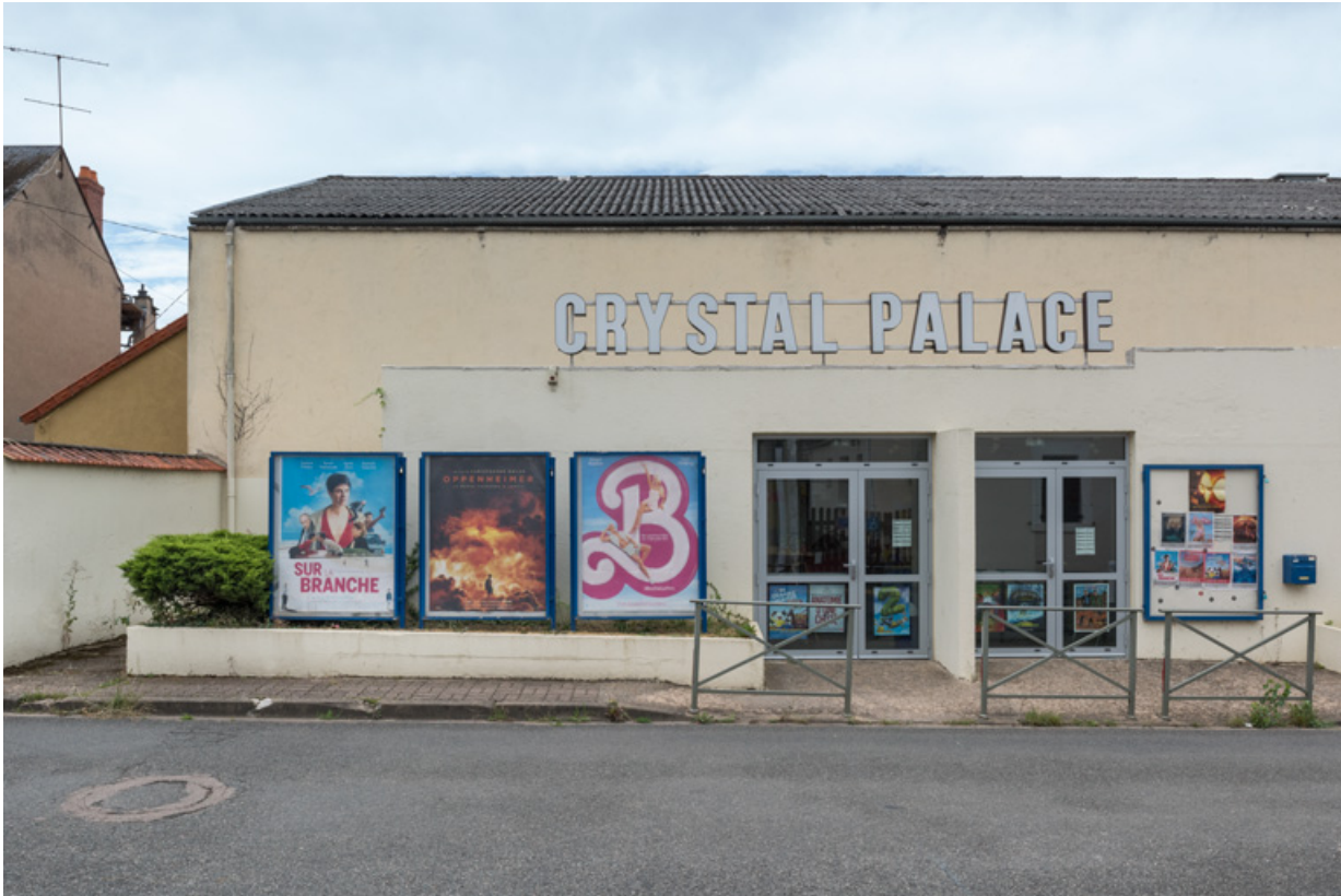
Façade antérieure : entrée.

58, La Charité-sur-Loire, 14 rue de Bourgogne