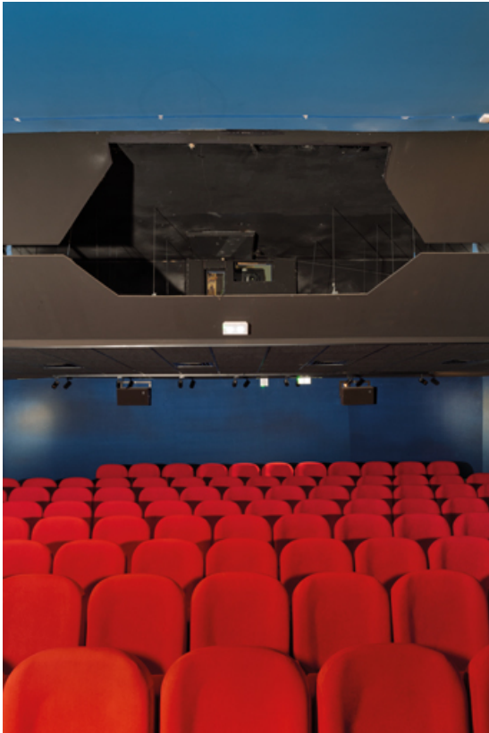
Salle 2 : vue rapprochée depuis l'écran.

58, La Charité-sur-Loire, 14 rue de Bourgogne