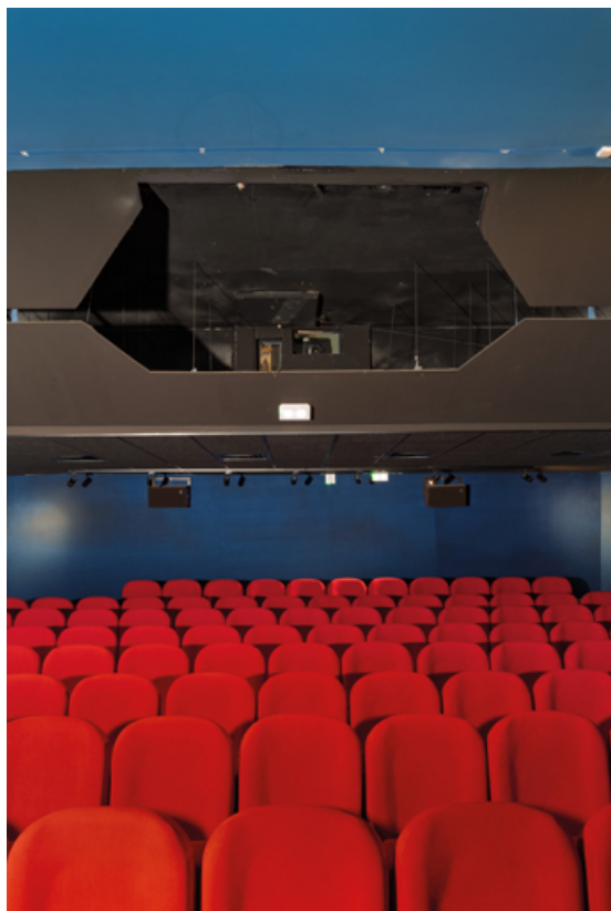
Salle 2 : vue rapprochée depuis l'écran.

58, La Charité-sur-Loire, 14 rue de Bourgogne