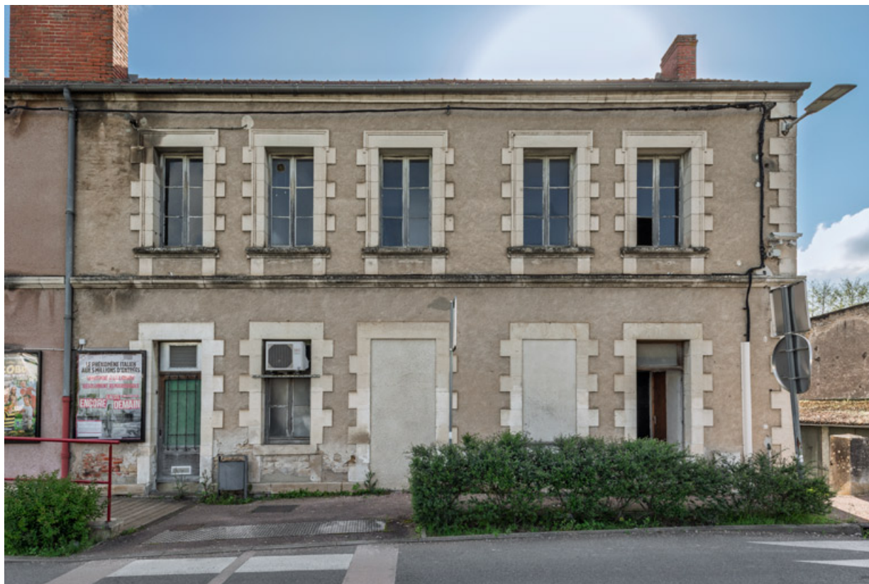
Façade antérieure, partie droite.