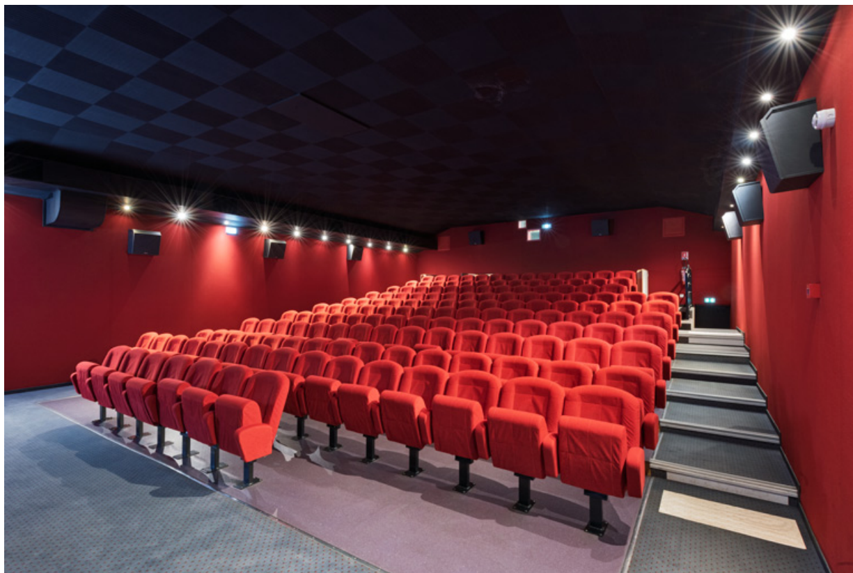
Salle 1 : intérieur depuis l'écran.