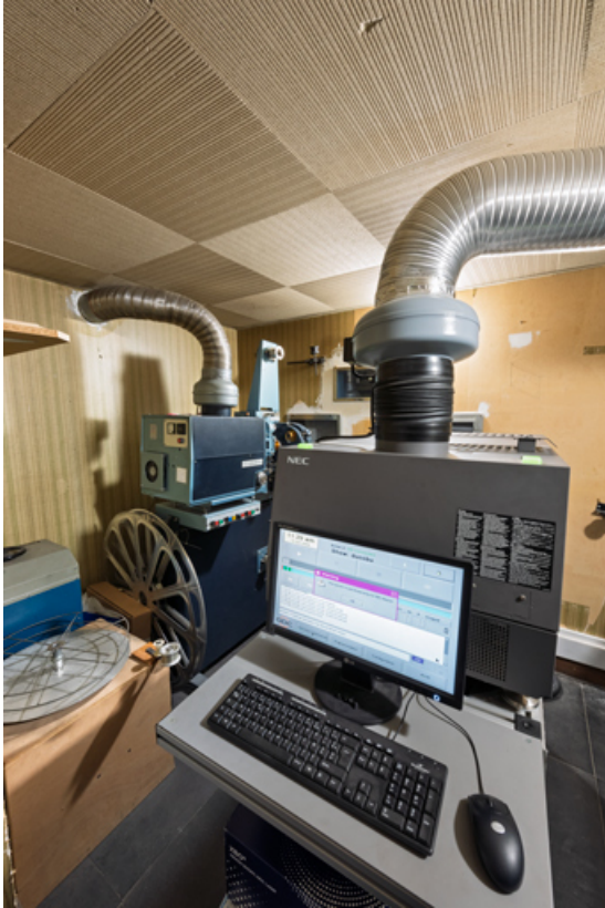
Salle 2 : la cabine de projection.