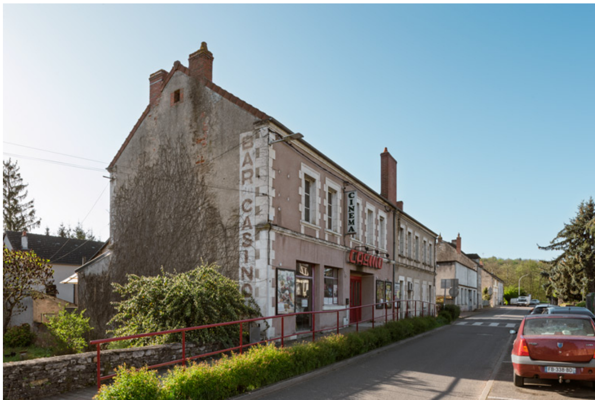
Vue d'ensemble, depuis le nord (façade antérieure).