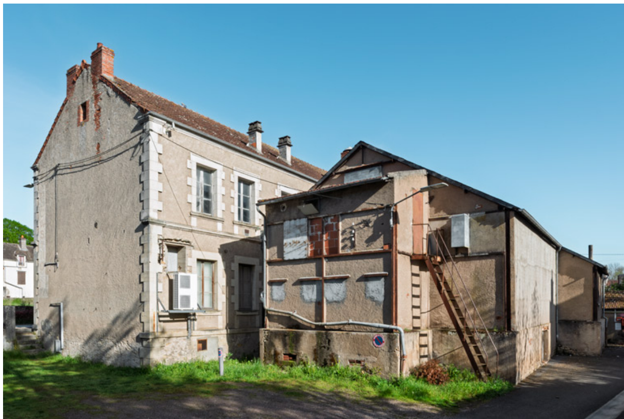
Façade postérieure et salle 1 (avec sa cabine de projection en saillie), depuis le sud-est. 58, Clamecy, 41 route de Pressures