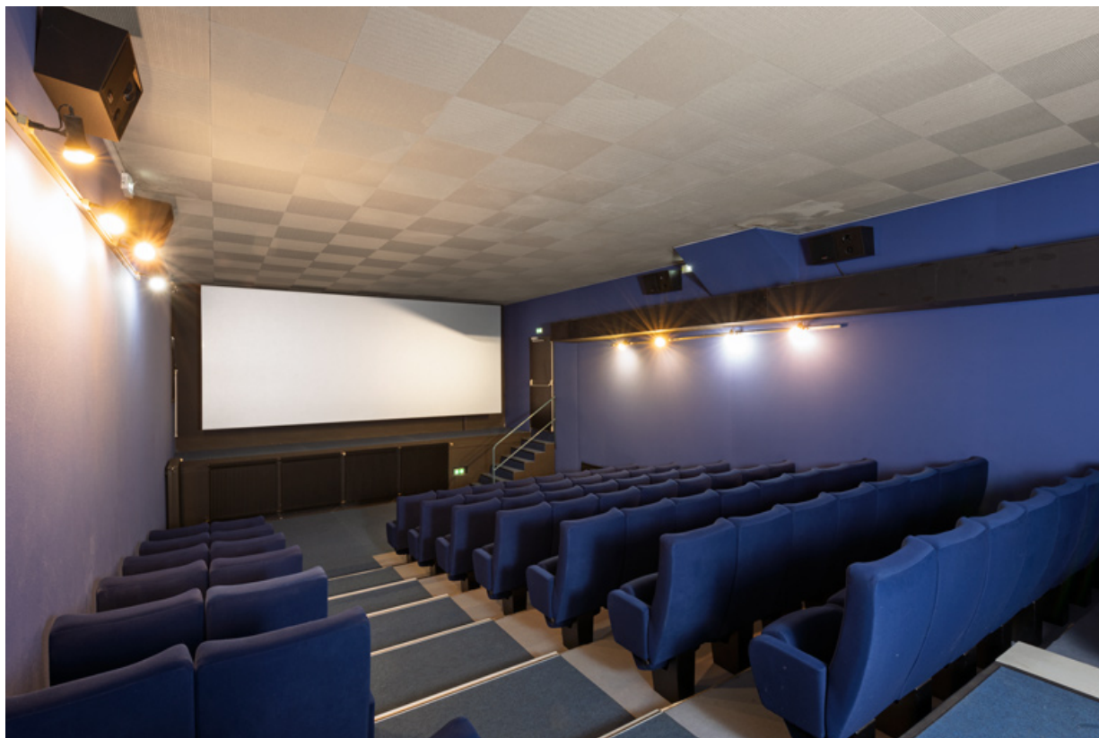
Salle 2 : intérieur depuis le fond. 58, Clamecy, 41 route de Pressures