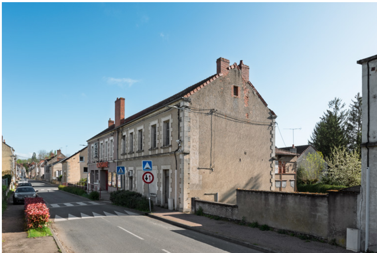
Vue d'ensemble, depuis le sud (façade antérieure).