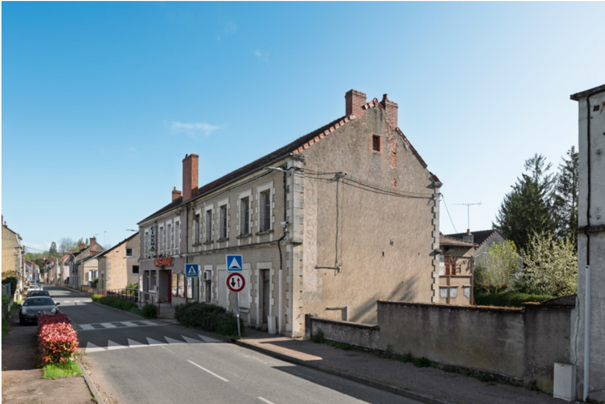
Vue d'ensemble, depuis le sud (façade antérieure).