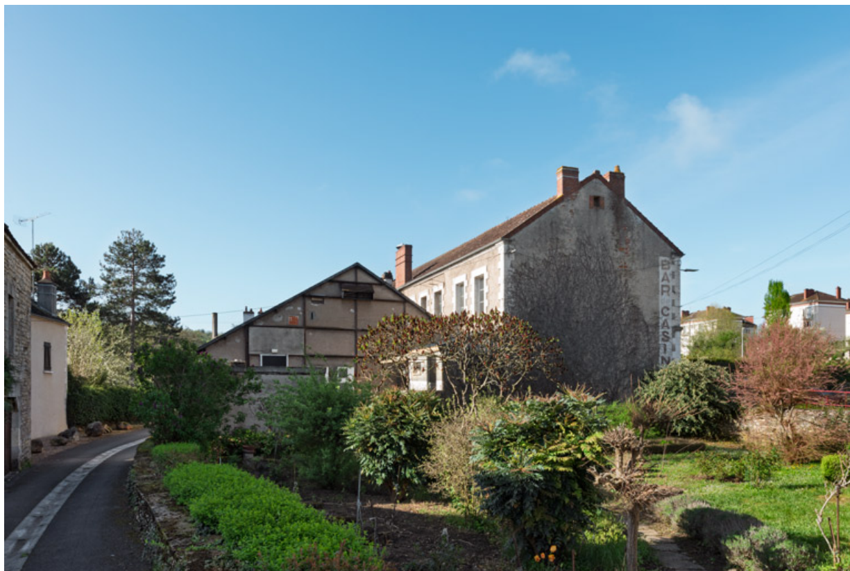
Façade postérieure et salle 1, depuis le nord-est.