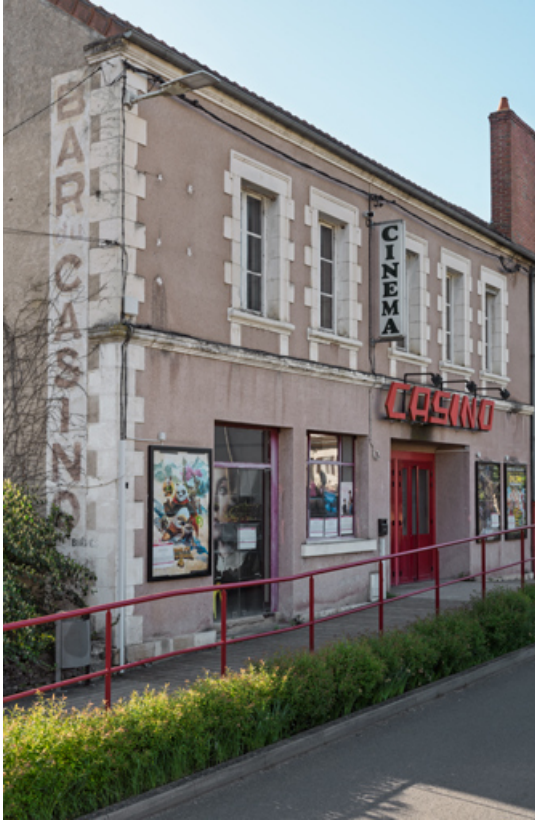
Entrée du cinéma, de trois quarts gauche.