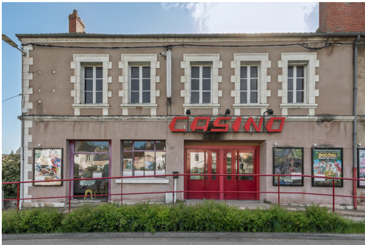
Clamecy : le Casino (41 route de Pressures).