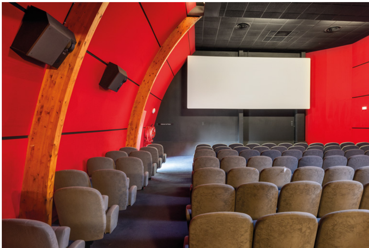
Salle 2 : vue vers l'écran. 58, Decize rue des Halles