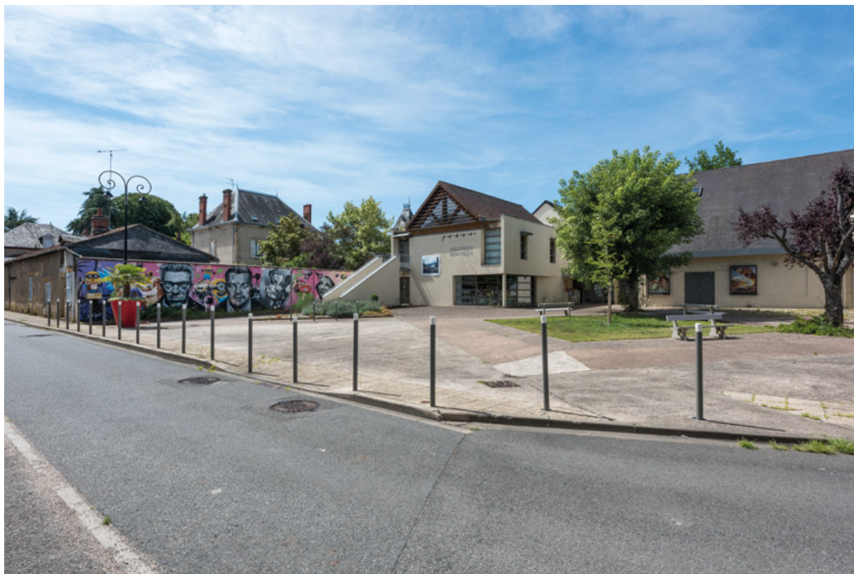
Vue d'ensemble, depuis le nord-est. 58, Decize rue des Halles