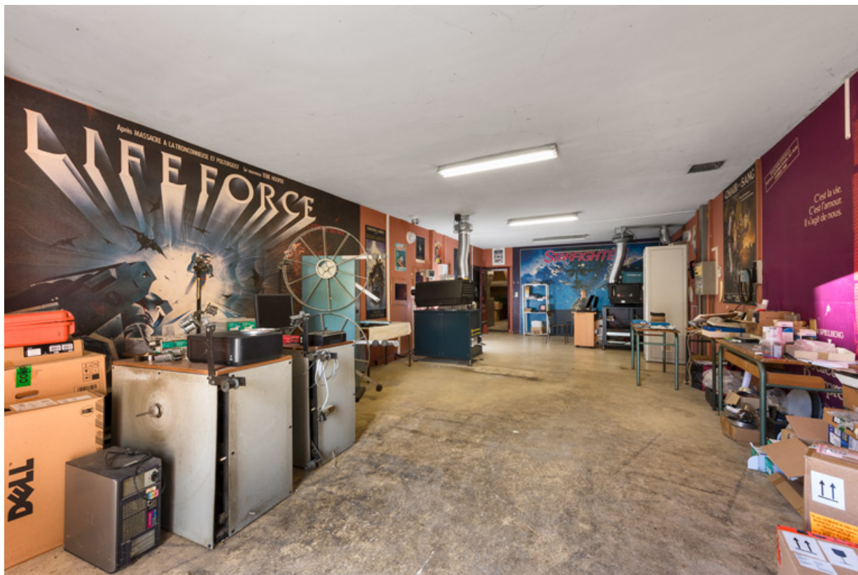
Cabine de projection. Le projecteur numérique au fond à gauche donne sur la salle 2, celui de droite sur la salle 1. 58, Decize rue des Halles