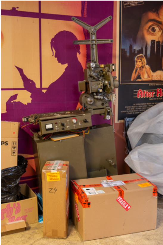
Cabine de projection : projecteur argentique Cinémeccanica (n° D 15188). 58, Decize rue des Halles