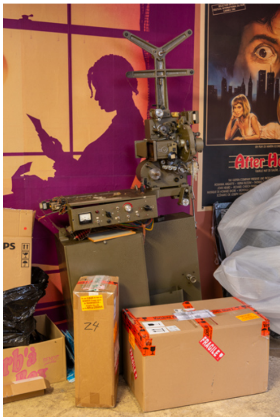
Cabine de projection : projecteur argentique Cinémeccanica (n° D 15188). 58, Decize rue des Halles