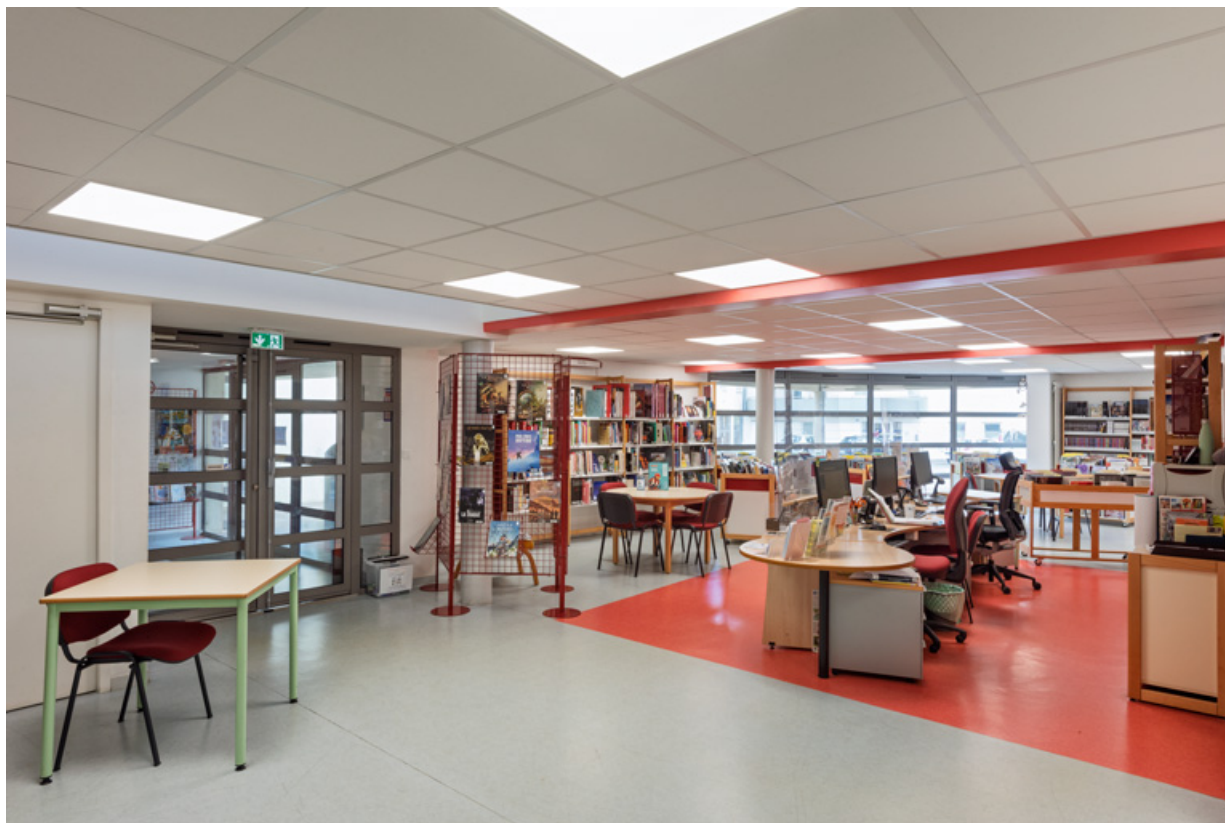
Bibliothèque. Le cinéma se trouve à gauche. 58, Decize rue des Halles