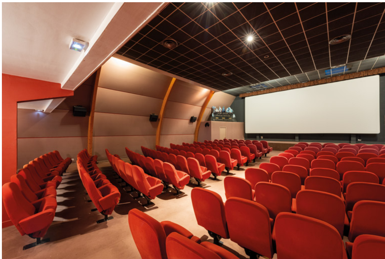
Salle 1 : vue depuis l'arrière côté cour. 58, Decize rue des Halles