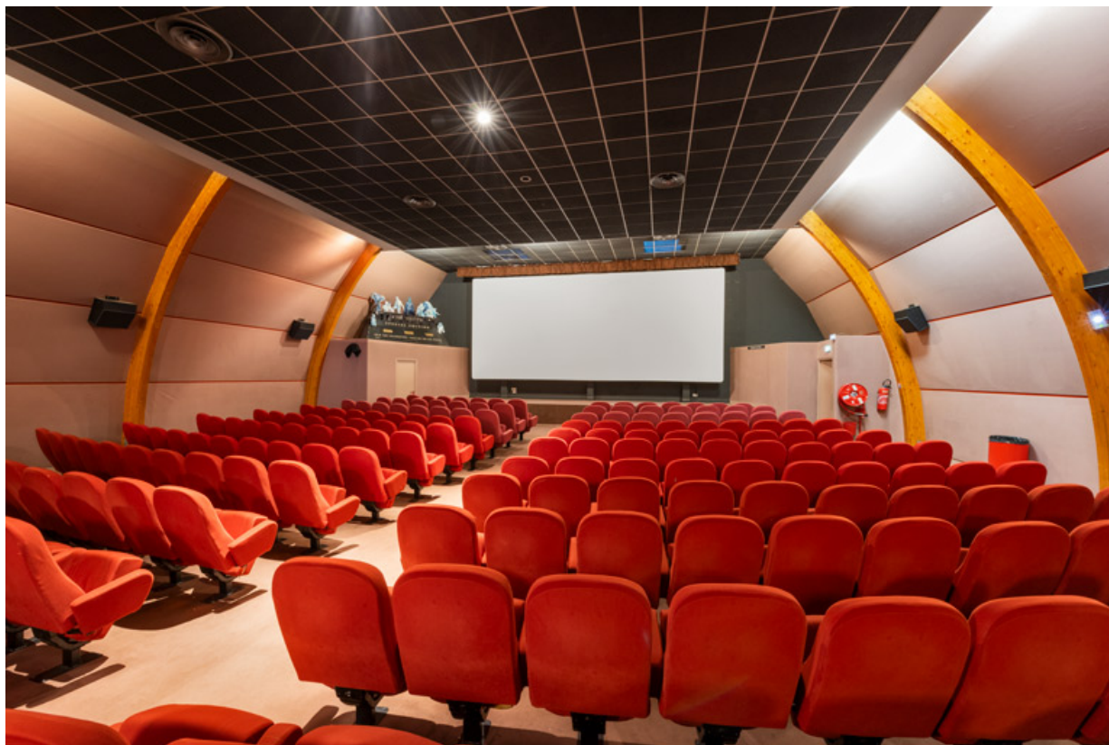
Salle 1 : vue vers l'écran, de trois quarts droite. 58, Decize rue des Halles