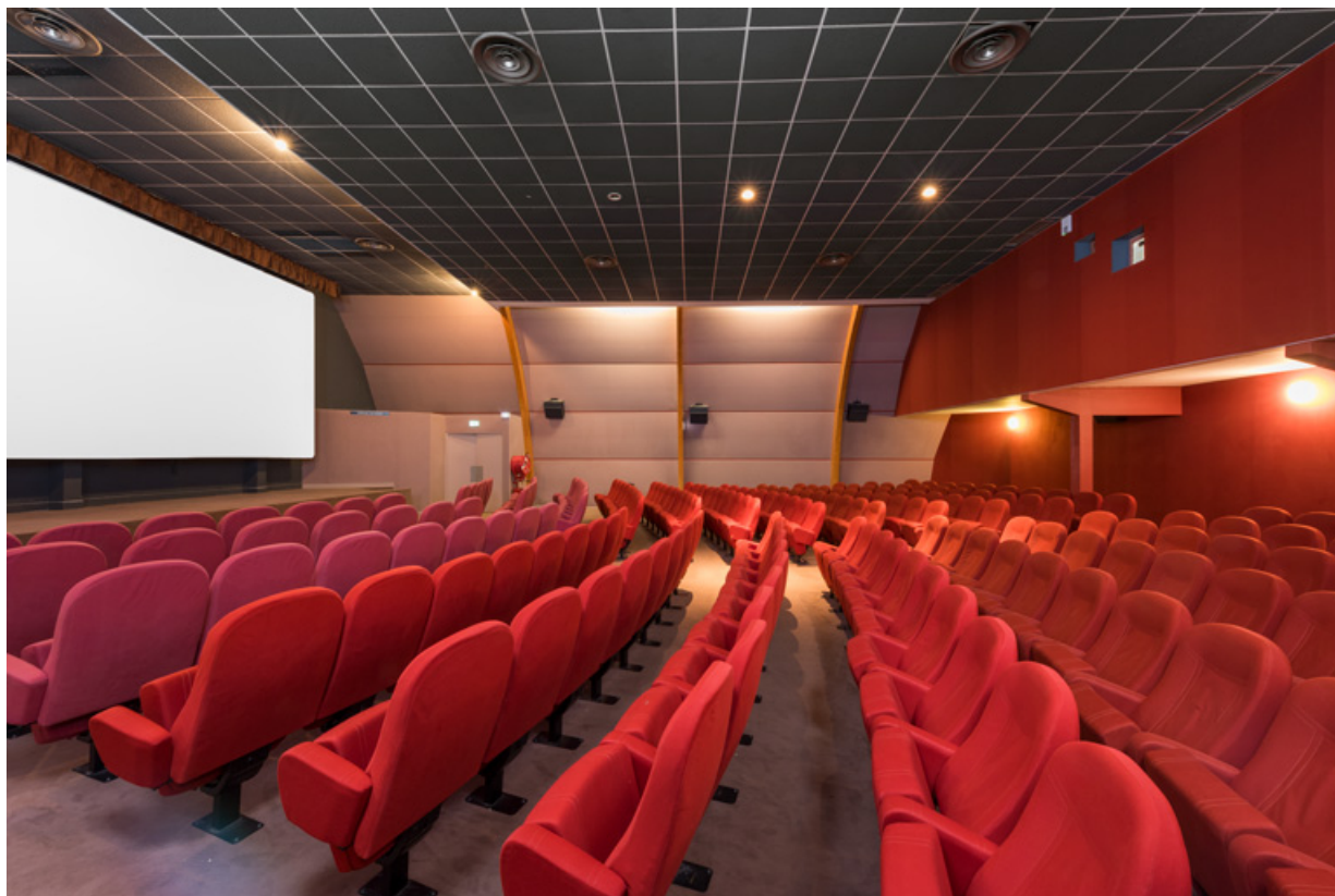
Salle 1 : vue depuis le mur côté jardin. 58, Decize rue des Halles