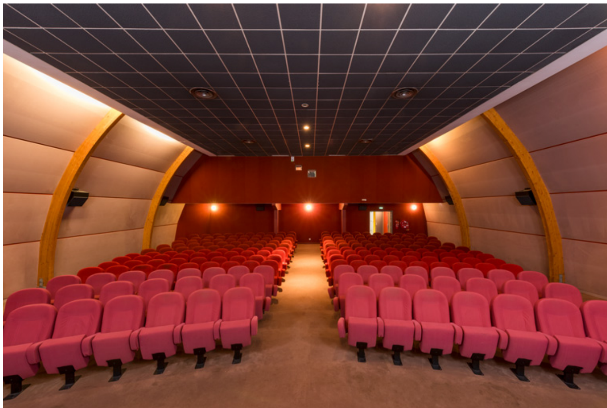
Salle 1 : vue depuis l'écran.