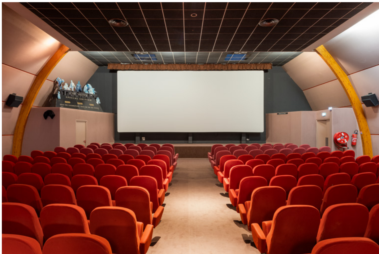
Salle 1 : vue vers l'écran.