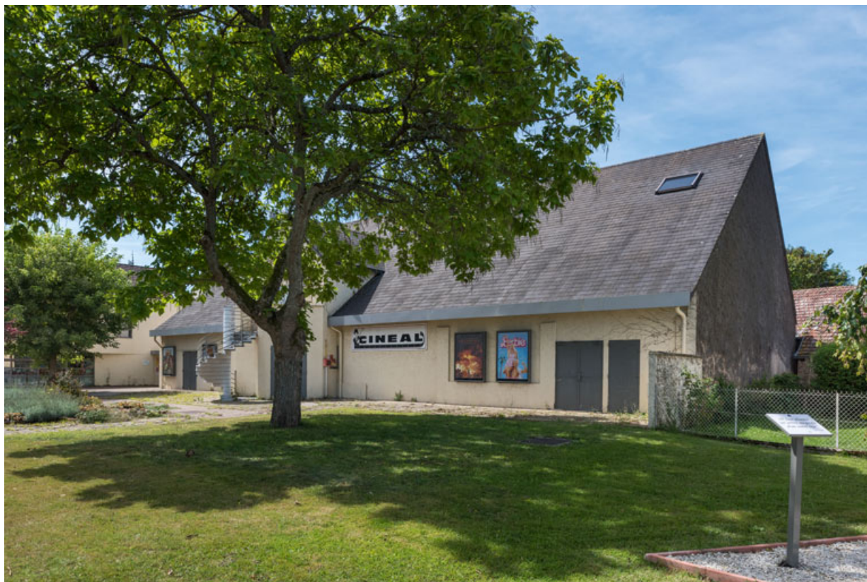
Cinéma, de trois quarts droite.