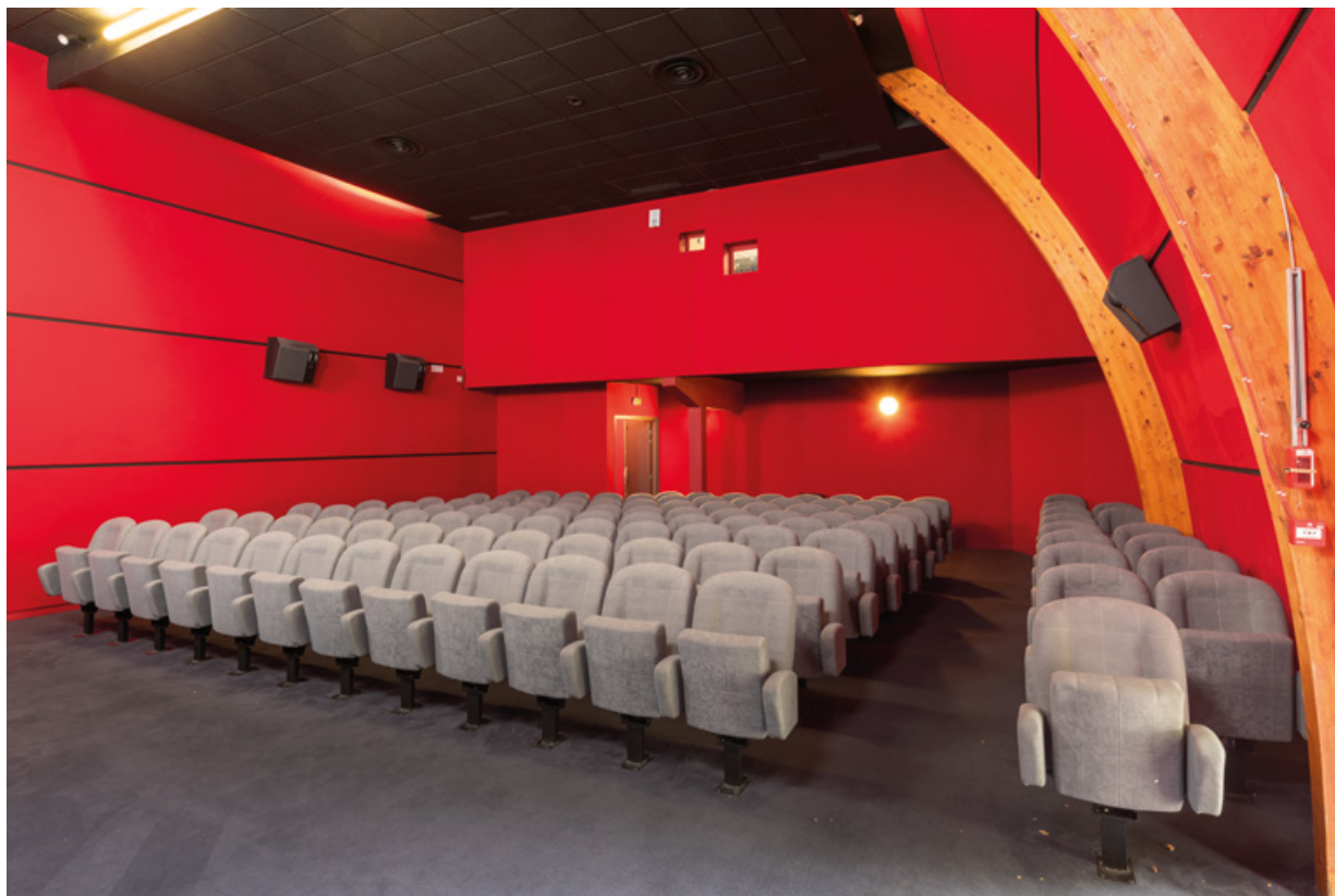
Salle 2 : vue depuis l'écran, de trois quarts droite. 58, Decize rue des Halles